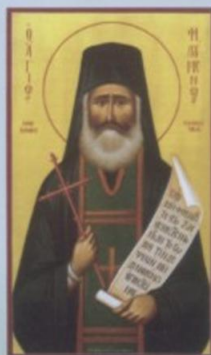
Ο Άγιος Φιλούμενος

εορτή του Αγίου Πνεύματος, εγκαινιάστηκε, στην ανακαινισθείσα Μονή, αδελφότητα πέντε μοναζουσών. Αυτή ήταν η πρώτη μέρα επαναλειτουργίας της Μονής μετά από δύο αιώνες και η επιλογή της ημέρας δεν ήταν τυχαία, καθώς ο σκοπός της ζωής κάθε ανθρώπου είναι ο αγιασμός του με τη χάρη του Αγίου Πνεύματος.