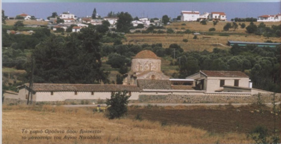
Το χωριό Ορούντα όπου βρίσκεται το μοναστήρι του Αγίου Νικολάου.

Η Μονή πανηγυρίζει στις 6 Δεκεμβρίου, εορτή του Αγίου Νικολάου και τη Δευτέρα του Αγίου Πνεύματος, ημέρα της επαναλειτουργίας της.