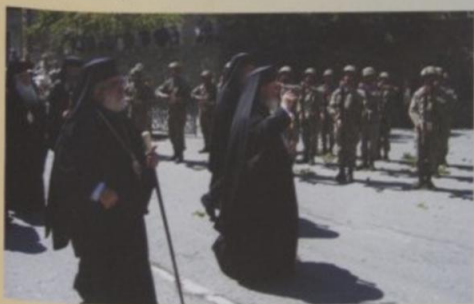
Ο Μακαριώτατος Αρχιεπίσκοπος Αθηνών και πάσης Ελλάδος κ. Χριστόδουλος γίνεται δεκτός στην Ιερά Μονή Κύκκου με όλες τις πρέπουσες τιμές

Σ τα πλαίσια της οκταήμερης παραμονής του στην Κύπρο, κατά το διάστημα 29 Απριλίου έως 6 Μαΐου, ο Μακαριώτατος Αρχιεπίσκοπος Αθηνών και πάσης Ελλάδος επισκέφθηκε την πανεύφημη και παλαιάτη Μονή της Παναγίας του Κύκκου, «το Παλλάδιον της Ορθοδόξου Εκκλησίας της Κύπρου και το σέμνωμα της καθόλου ορθοδοξίας», όπως ο ίδιος την χαρακτήρισε.