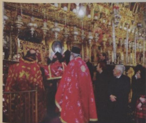
Αποκαθίλιση της Αγίας Εικόνας

Μ ε μια σεμνή και γεμάτη κατάνυξη τελετή έγινε το Μεγάλο Σάββατο η αλλαγή του καλύμματος της εικόνας της Παναγίας της Ελεούσας του Κύκκου. Το παλαιότερο κάλυμμα που σκέπαζε την Αγία