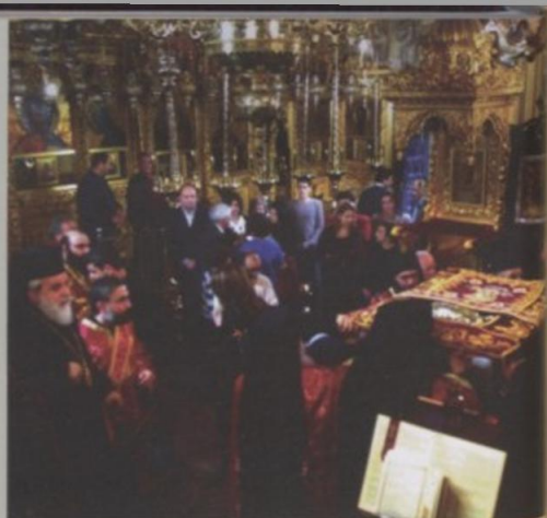
«Μήτηρ του Θεού φύλαξον ημάς υπό την σκέπην σου»

σει. Όσοι επιχειρήσαν στο παρελθόν να πράξουν αυτό από περιέργεια, έχασαν τη φυσική τους όραση από το υπέρλαμπρο φως που ακτινοβολούσε η αγία μορφή Της. Η Αγία Εικόνα σύμφωνα με την παράδοση αποκαλυπτόταν από τους πατέρες της Μονής σε περιπτώσεις μεγάλων δοκιμασιών που έπλητταν τον τόπο. Η αφαίρεση του κάλυμματος της Αγίας Εικόνας γινόταν μόνο στο θρόνι, χωρίς οι μοναχοί να τολμούν να δουν το πρόσωπό Της, που ήταν στραμμένο προς τον ουρανό. Εκεί φαλλόταν παράκληση και διαβάζονταν οι σχετικές για την περίπτωση ευχές. Αρκετές όμως ήταν οι φορές που η χαριτόβρυτος εικόνα ταξίδευε σε κάθε γωνιά της νήσου για να θεραπεύσει, να πα-