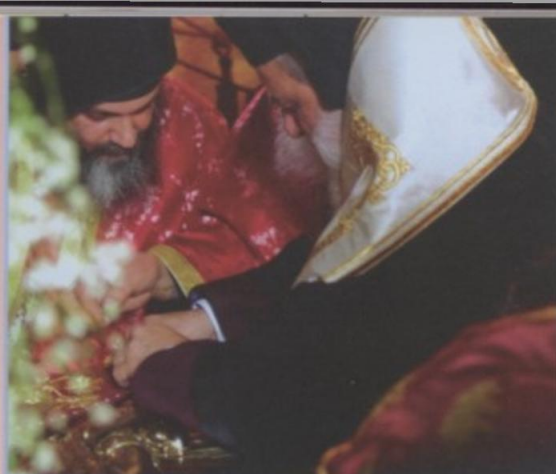
Ο Ηγούμενος της Μονής με την βοήθεια πατέρων αλλάζει το κάλυμμα