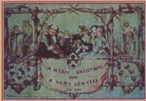
Η πρώτη χριστουγεννιάτικη κάρτα.

Η κάρτα αυτή μεγέθους 8X13 εκ. λιθογραφήθηκε σε χοντρό χαρτόνι και έχει ζωγραφιστεί με το χέρι. Χαρακτηριστικό της κάρτας αυτής είναι ότι χωρίζεται σε τρία μέρη: στο κέντρο παρουσιάζει ένα οικογενειακό πάρτι και στο κάτω μέρος της αναγράφονται οι λέξεις «A Merry Christmas and a Happy New Year to you» - «Χαρούμενα Χριστούγεννα και Ευτυχισμένο το Νέο Έτος». Στην αριστερή πλευρά της κάρτας υπάρχει μία σκηνή που ταΐζουν κάποιον πεινασμένο, ενώ στη δεξιά πλευρά υπάρχει μία αναπαράσταση όπου ντύνουν τους φτωχούς.