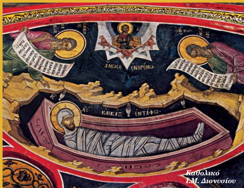
Καθολικό Γ.Μ. Διονυσίου

Το βάρος της περιγραφής των τεσσάρων Ευαγγελιστών πέφτει στην ατράνταχτη μαρτυρία αυτών που μετείχαν τη συγκεκριμένη ιστορική στιγμή στην υπερκόσμια χαρά της αναστάσεως, αλλά και όλων όσων συμμετέχουν αενάως σε αυτή ψηλαφώντας διά ζώσης πίστεως το κοσμογονικό γεγονός. Η νίκη της ζωής διαγράφεται τη στιγμή που η θεότητα συναντά απέναντί της, στο απύθμενο φρεάτιο του Άδη, τον θάνατο. Εκεί που κρατά αλυσοδεμένες τις ψυχές των νεκρών ο διάβολος. Η ζωή, ο ίδιος ο Χριστός, μηδενίζει το θάνατο όπως το φως που διαλύει το σκότος. Η εικόνα του Άδη συμβολίζει την κυριαρχία του θανάτου πάνω στον άνθρωπο. Η γη δεχόμενη στα σπλάχνα της το ζωοδότη σείετε, αδυνατεί να αντέξει το βάρος της παρουσίας Του και τον εκβάλλει εκ του μνήματος νικητή και τροπαιούχο της ζωής.