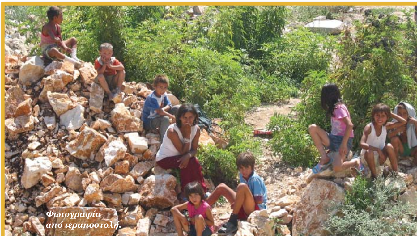
Φωτογραφία από ιεραποστολή.

- Η ένταξη της Ιεραποστολής στους σκοπούς του Ομίλου εδόθη με τη σκέψη ότι εφόσον βάζουμε στον Όμιλο επωνυμία τον Απόστολο Βαρνάβα πρέπει ν' ακολουθήσουμε τα ίχνη του, της πορείας της διδασχής και διαφώτισης προς τον άνθρωπον, να γνωρίσει το Θεό που είναι η πηγή της ζωής, ο φωτισμός, η δύναμις. Να δυναμώσει η πίστις στην ψυχή του, η ελπίδα, η υπομονή, η μακροθυμία στις ώρες της δοκιμασίας και του πειρασμού. Παράλληλα όμως και η σκέψη ηθικά και υλικά να βρούμε τις δυνατότητες να βοηθήσουμε και συμπαρασταθούμε στις Ιεραποστολές στην Αφρική, την Ασία και οπουδήποτε το Ευαγγέλιο κηρύττεται σε λαούς με στέρηση και φτώχεια, για να νοιώσουν την αγάπη Θεού στο πρόσωπο των αδελφών του. Ο Απόστολος Βαρνάβας είναι για μας πρότυπο αγάπης και ιεραποστολής δι' έργων ενεργουμένης, ως ανεφέρθη άνωθεν (Πράξ. Κεφ. δ' 37). ■