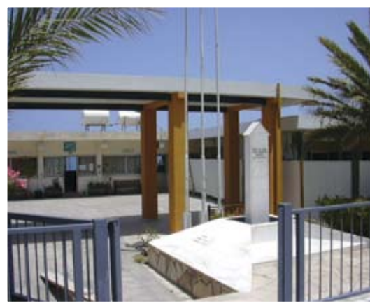
Το Γυμνάσιο-Λύκειο Κάτω Πύργου Τηλλυρίας