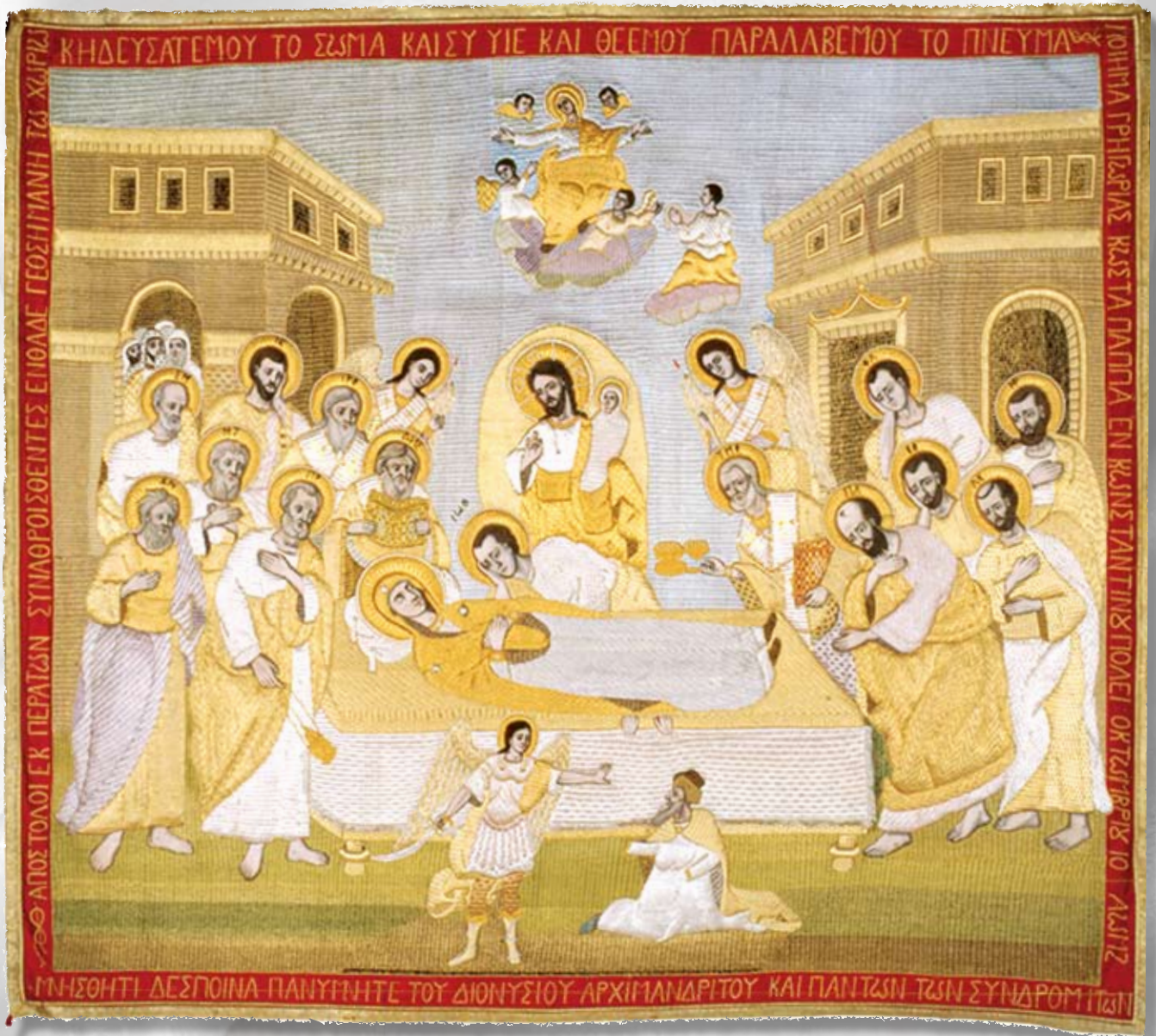
Έγρασμα με τη σκηνή της Κοιμήσεως της Θεοτόκου, το οποίο φυλάσσεται στο Μουσείο της Ιεράς Μονής Κύκκου.