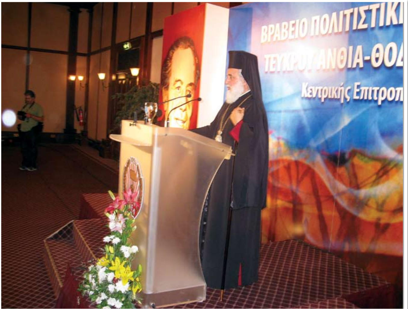
Ο Πανιερώτατος Μητροπολίτης Κύκκου ομιλεί στο Βήμα της εκδήλωσης.

την πρωτοφανή για τέτοιες εκδηλώσεις προσέλευση του κόσμου.