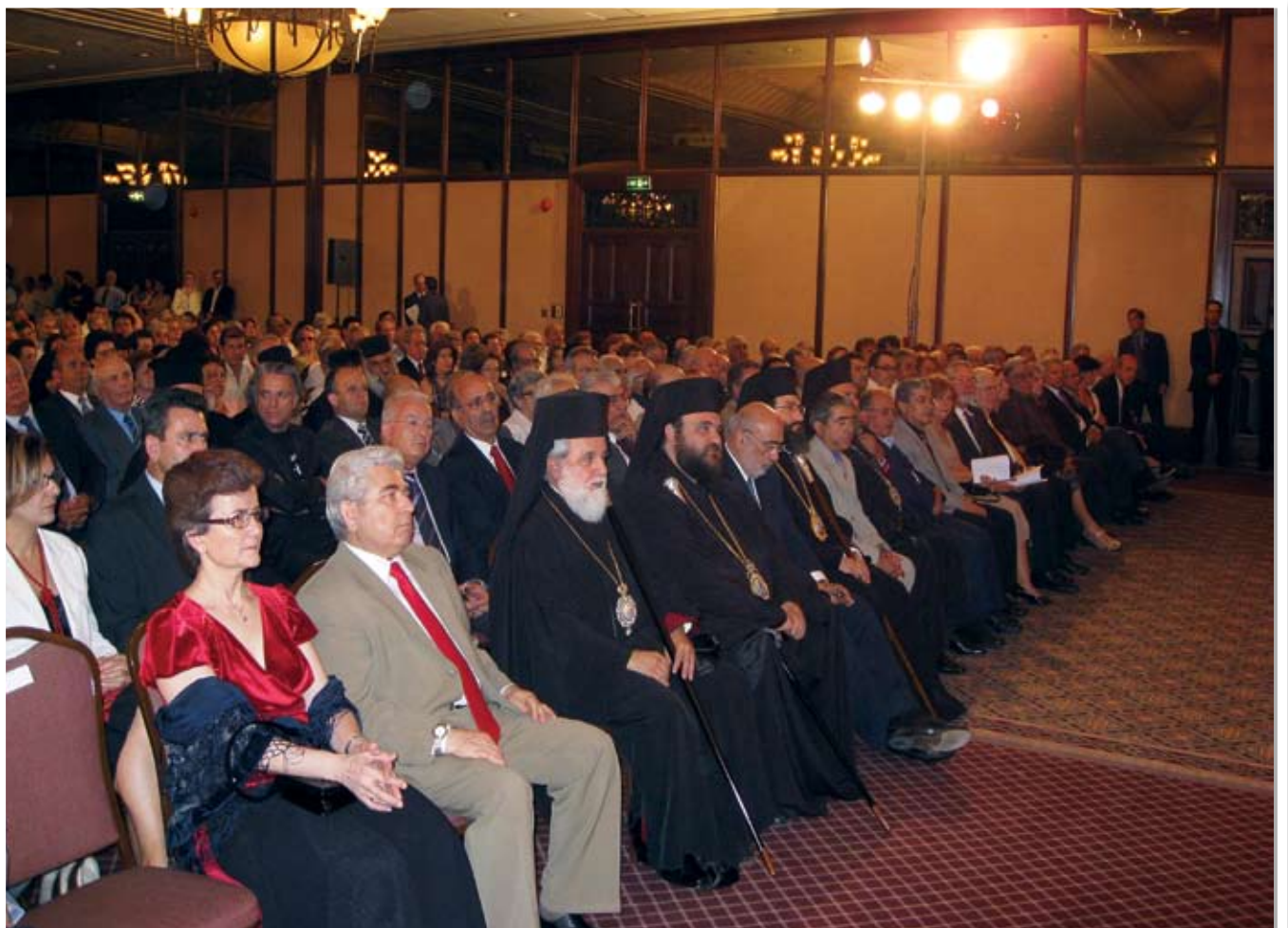
Οι πολιτειακές, πολιτικές και Εκκλησιαστικές αρχές κόσμησαν με την παρουσία τους την εκδήλωση.