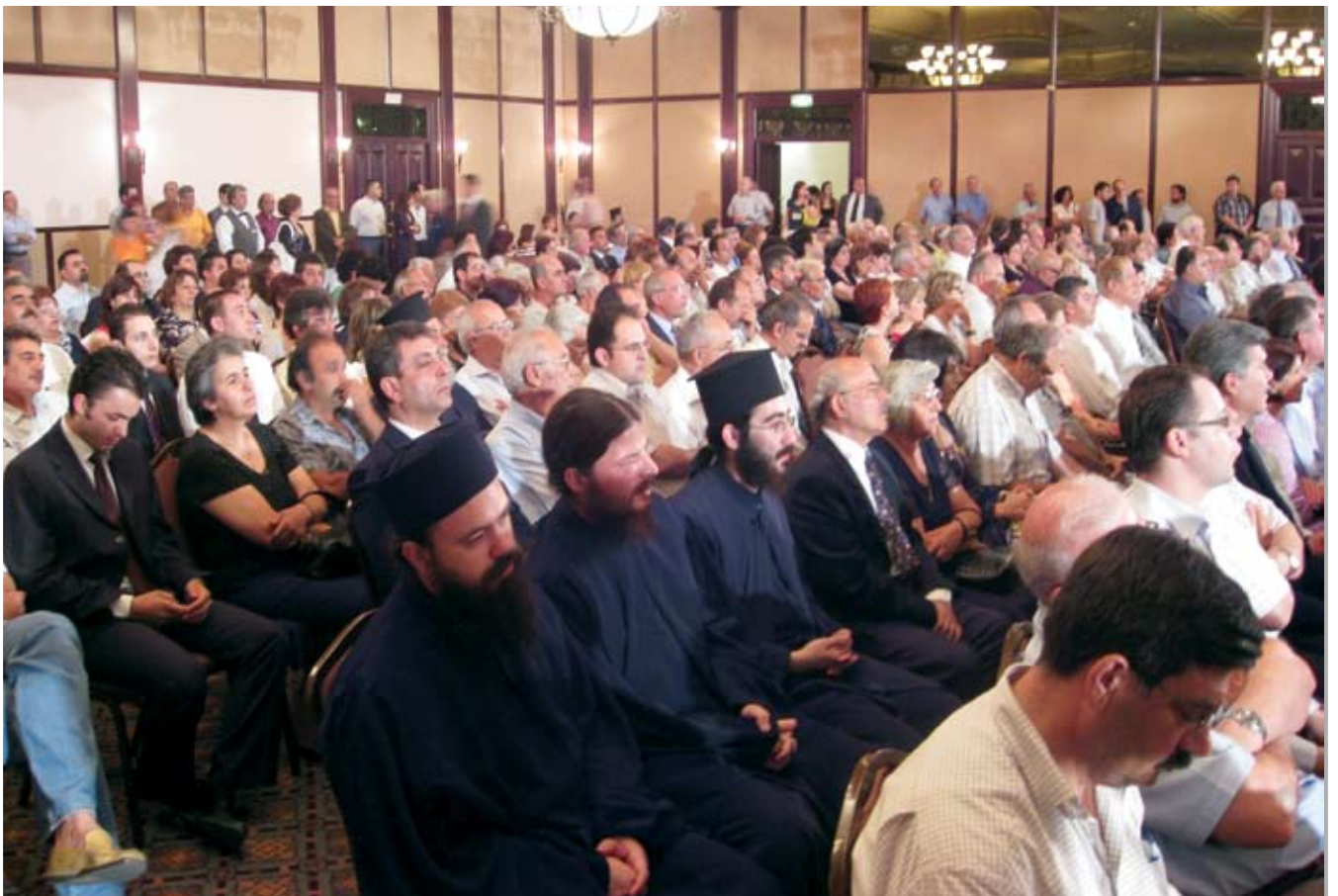
Απόψεις της κατάμεστης αίθουσας του ξενοδοχείου Hilton Park από κόσμο.