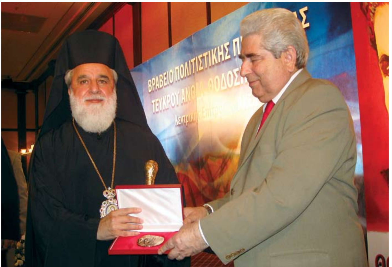
Ο Μητροπολίτης Κύκκου και Τηλλυρίας παραλαμβάνει το βραβείο από τον Πρόεδρο της Δημοκρατίας κ. Δημήτρη Χριστόφια.