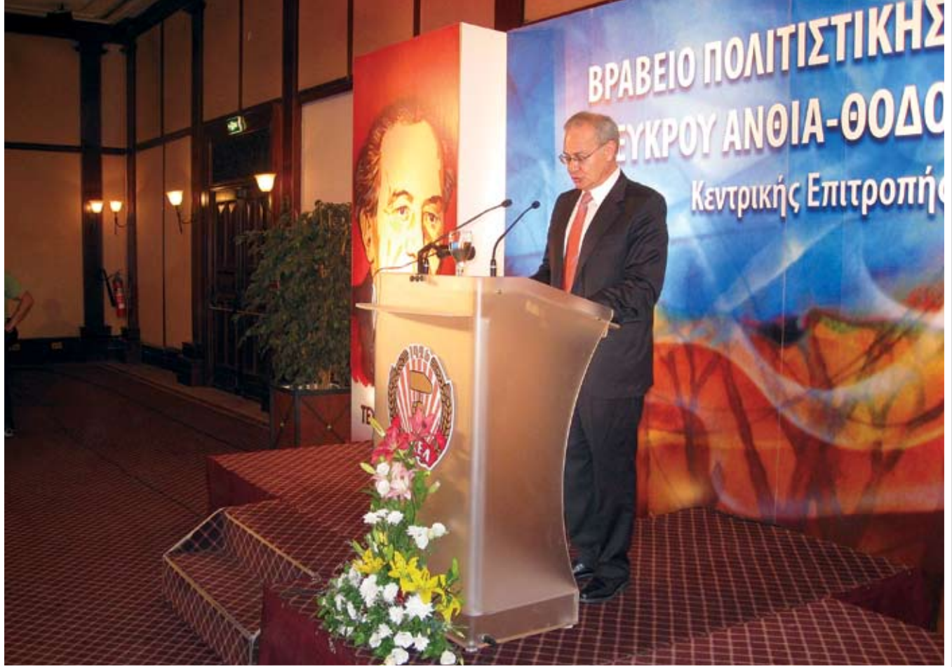
Ο Υπουργός Παιδείας και Πολιτισμού προσφωνεί την εκδήλωση.