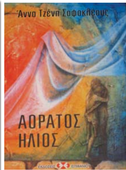
Το εξώφυλλο είναι από πίνακες της ζωγράφου Δάφνης Τριμικλιιώτη.