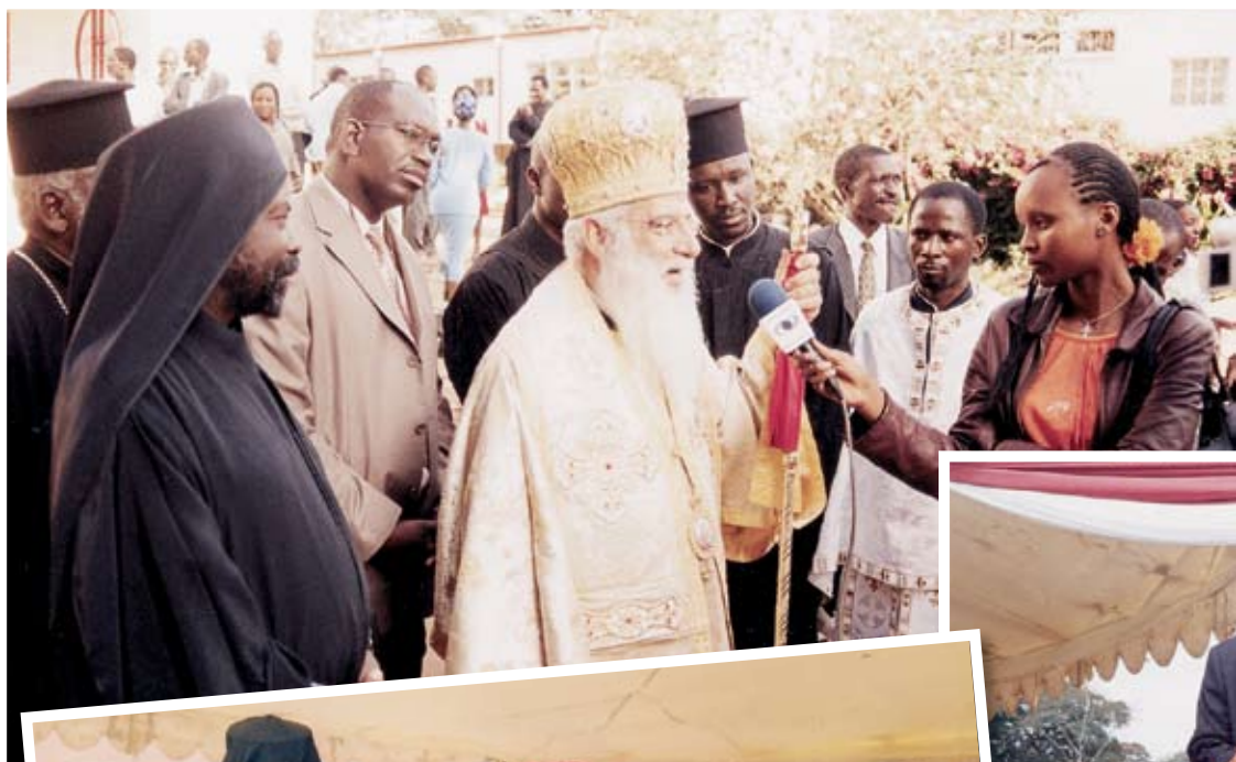
Ο Σεβασμιώτατος Μητροπολίτης Κέννας κ. Μακάριος εν ώρα δηλώσεων σε τοπικό τηλεοπτικό σταθμό