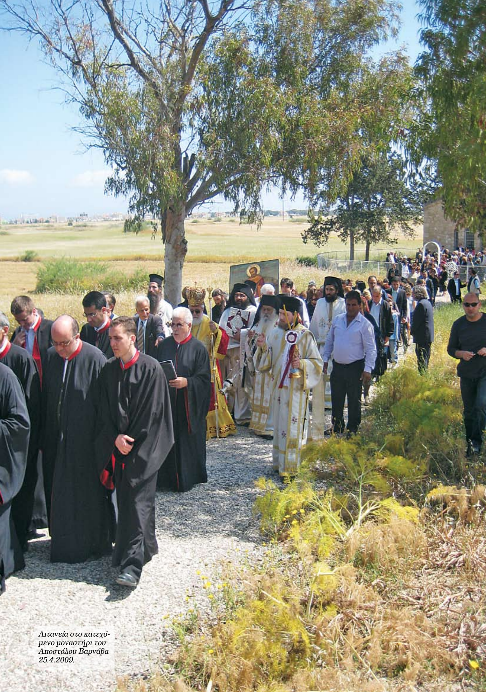
Λιτανεία στο κατεχόμενο μοναστήρι του Αποστόλου Βαρνάβα 25.4.2009.