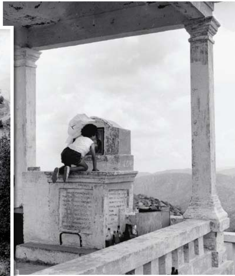
Το θρόνι της Παναγίας, όπως σωζόταν το 1966.