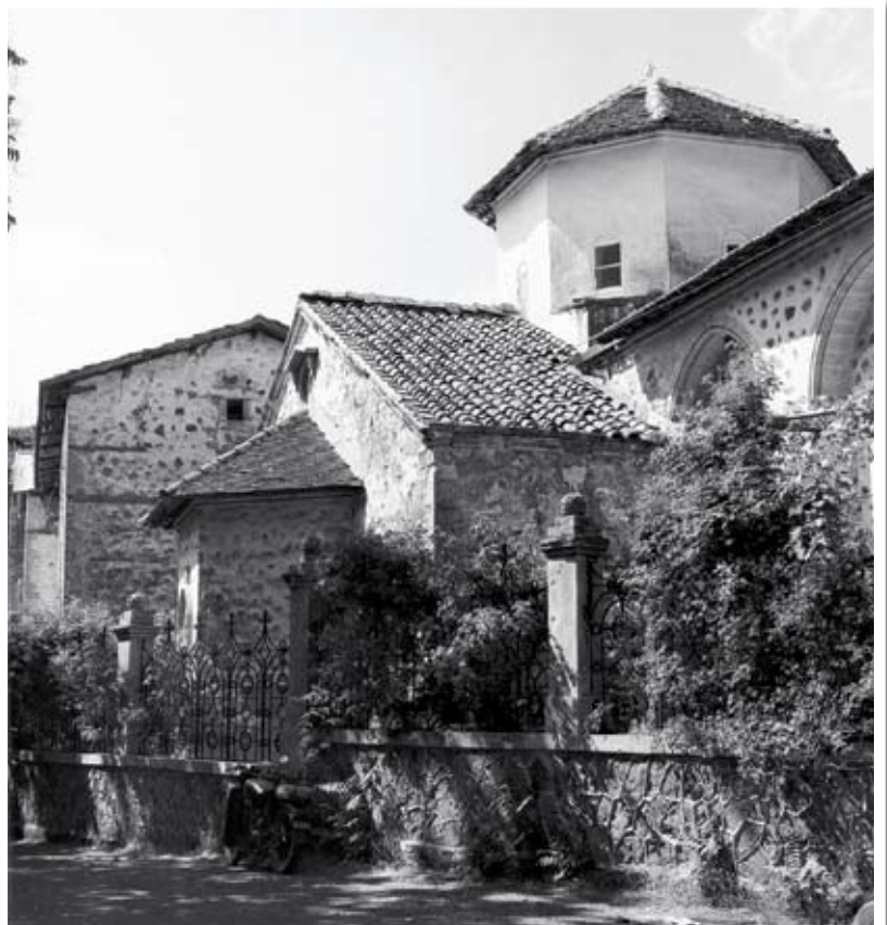
Πανοραμική άποψη της Ιεράς Μονής Κύκκου (1966).