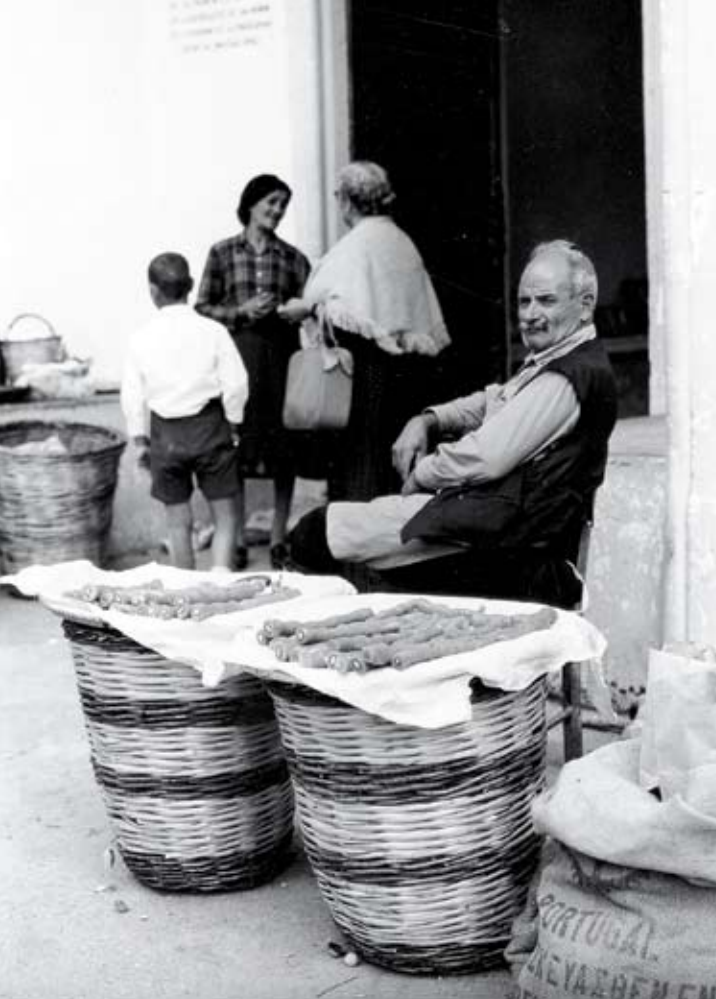
Πλανώδιος πωλεί σουζούκο στους προσκυνητές έξω από την Ιερά Μονή Κύκκου (1966).