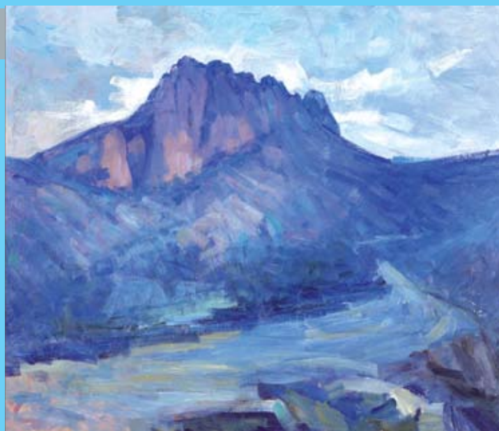
Δρόμος στον Πενταδάκτυλο. Symeon Volchkov Arthouse.

«Πολλή ποίηση και πολλή αγάπη για την Κύπρο. Θαυμαστή ευαισθησία και έκδηλη καλλιτεχνική ψυχή».