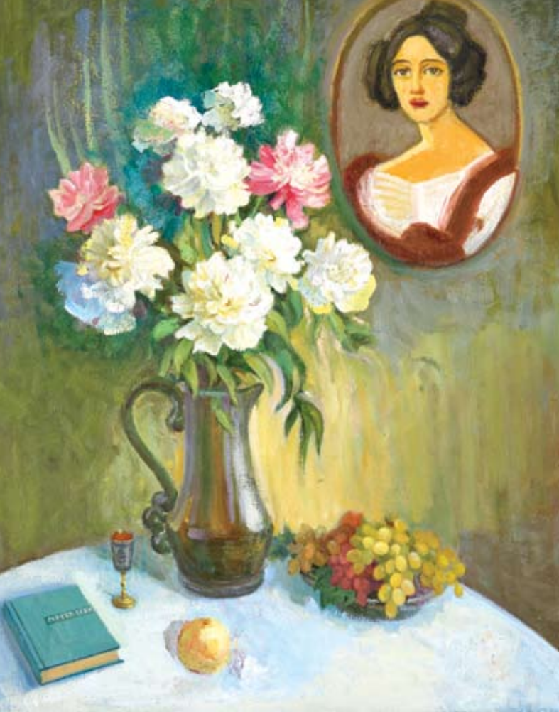
Νεκρά φύση με το πορταίτο της κόρης του. Symeon Volchikov Arthouse.