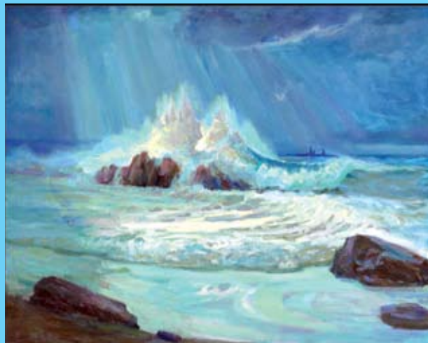
Αμμοχωστιανή Συμφωνία. Ιδιωτική Συλλογή.

Μακρόσυρτα, αργά σερνόντουσαν τα χρόνια, Άλλαζαν οι γενιές, διάβαινε η ιστορία, Η ξένη κατοχή φαινόταν αιώνια, Μα ήρθε η ώρα! Ήρθε η ελευθερία!