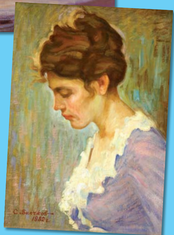
Κοπέλα με τα μοβ. Πορτραίτο της κόρης του. Symeon Volchkov Arthouse.

Διάφοροι, που μίλησαν για τον Συμεών Βολτσκόβ, γράφουν για το αποδημητικό πουλί που ήταν και το ακραίο μεταίχμιο στο οποίο βρισκόταν διαρκώς. Αν συμφωνούμε μ' αυτές τις θέσεις, είναι για να τις προχωρήσουμε στην καθολικότητα, στην οικουμενικότητα του θερμού λόγου, ζωγραφικού και ποιητικού, που τον διακρίνει. Επικυρώνει δόκιμα την ομορφιά της αλήθειας, την αλήθεια της ομορφιάς σε κάθε εικαστική του σύνθεση, σε κάθε ποιητικό του ρήμα. Πρόκειται για Ζηνώναιο