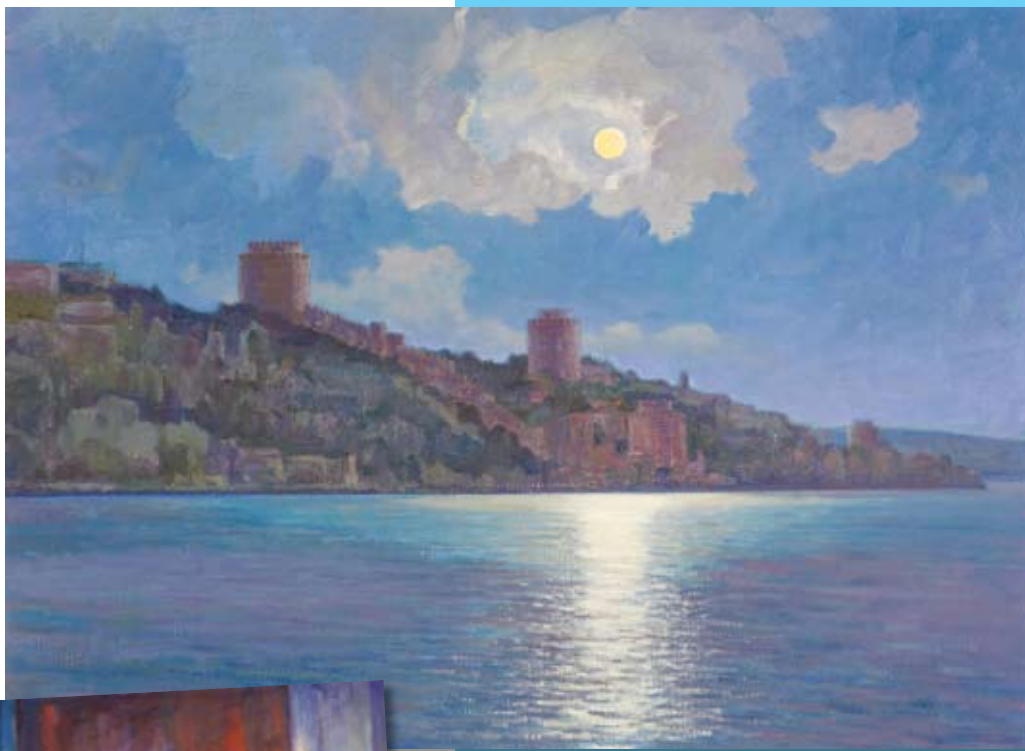
Φεγγαρόλουστη νύχτα στο Βόσπορο. Symeon Volchkov Arthouse.