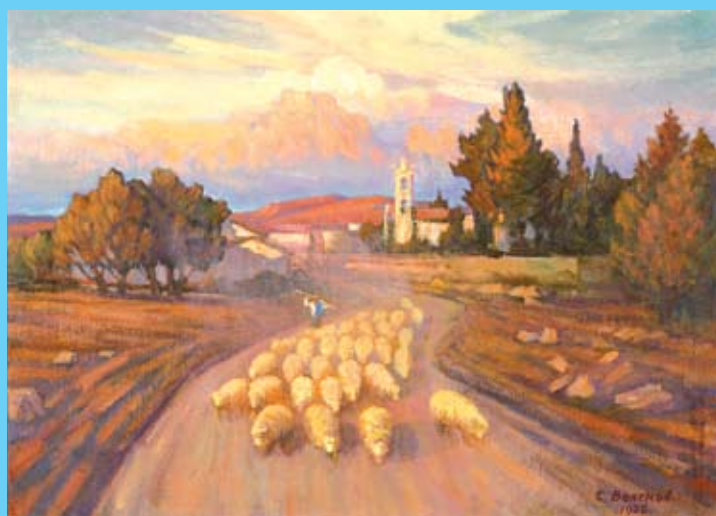
Ο βοσκός και τα πρόβατα. Symeon Volchkov Arthouse.