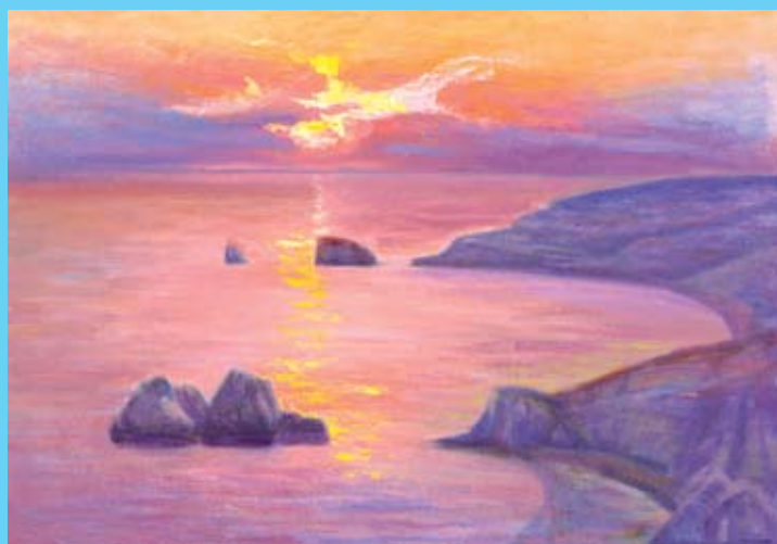
Η Πέτρα του Ρωμιού στη δύση του ήλιου. Symeon Volchkov Arthouse.