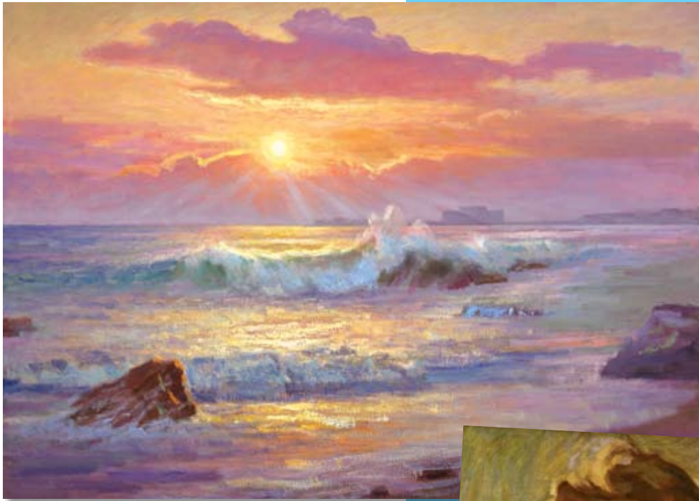
Το Κάστρο της Πάφου στο ηλιοβασίλεμα. Πινακοθήκη Ιδρύματος Μακαρίου Γ'.

απ' τον λυρισμό του ζωγράφου-ποιητή, βίωσα τον μυστικισμό της άγιας Ρωσσίας, που μεταφράστηκε σε πάναγνη ρωσική και κυπριακή φύση, τοπογραφία της ψυχής και συγκροτημένη εσωτερική γεωγραφία του είναι, χαμηλόφωνη οντική σημειολογία.