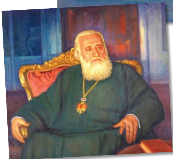
Ο Αρχιεπίσκοπος Κύπρου κ.κ. Χρυσόστομος Α'. Ιδιωτική συλλογή.

γική συνέπεια της οργής των θεών και των δαιμόνων στη ρομαντική, κατά τα άλλα, ατμόσφαιρα της όμορφης αέναης φύσης). Ταξιδεύοντας στον ατέλειωτο πανοραμικό κόσμο των χρωμάτων της Κύπρου, βλέπουμε την Πάφο, αρχαία και μεσαιωνική, το Τρόδος με την πλούσια του βλάστηση, όπου κάθε μίλι και κρυμμένος θησαυρός των Βυζαντινών μας χρόνων, τους απρόσιτους κρημνούς του Σταυροβουνίου «με το σταυρό, που ακουμπά στο γαλανό της Οικουμένης», Καντάρα, Λάρνακα στο φεγγαρόφως και στο λιόγερμα, «η Αμμοχωστιανή συμφωνία», δοσμένη μέσα από το καταπληκτικό φως, που πέφτει εκ του Ουρανού με μια υπόσχεση, που εκκολάπτει την ελπίδα για αναγέννηση τη δραματική εκείνη ώρα της φουρτουνιασμένης θάλασσας – όλα αυτά που συνθέτουν την κυπριακή εποποιΐα. Αλλά και πανέμορ-