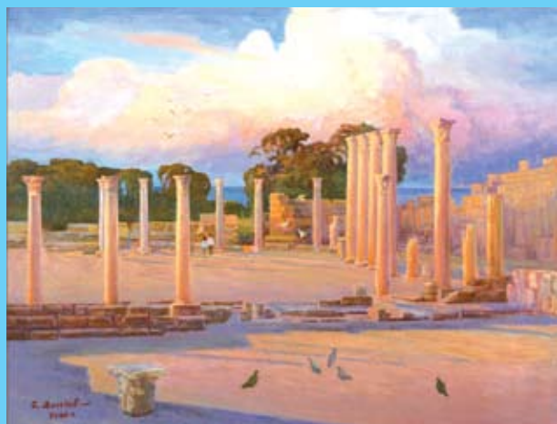
Σαλαμίνα Παλαίστρα στη δύση του ήλιου. Βουλή των Αντιπροσώπων Κύπρου.