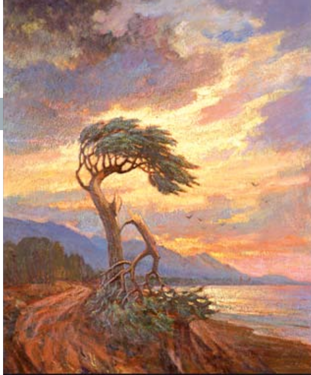
Κύπρος τον Ιούλιο του 1974. Πινακοθήκη Ιδρύματος Αρχιεπισκόπου Μακαρίου Γ'.