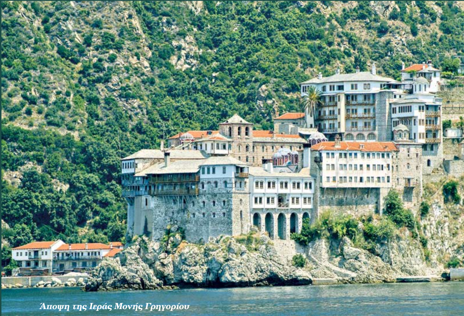
Αποψη της Ιεράς Μονής Γρηγορίου