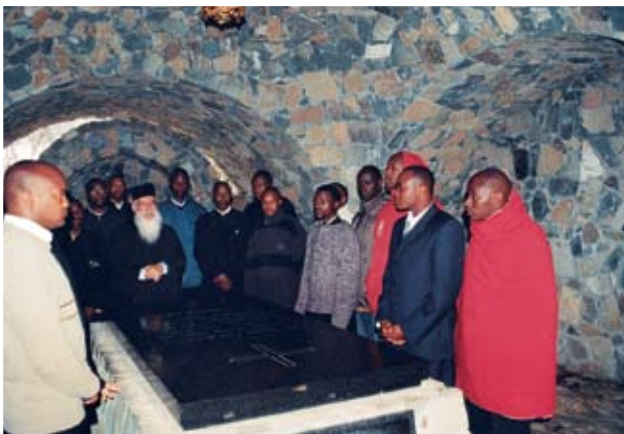
Από την επίσκεψη των μαθητών της Πατριαρχικής Σχολής «Αρχιεπίσκοπος Μακάριος Γ'» στον τάφο του Αρχιεπισκόπου και Εθνάρχη Μακαρίου Γ'

ναγήθηκαν στους χώρους της από τον Πρωτοσύγκελλο της Ιεράς Μητροπόλεως Κύκκου και Τηλλυρίας Αρχιμανδρίτη Αγαθόνικο. Οι μαθητές της Πατριαρχικής Σχολής επισκέφθηκαν τον τάφο του Αρχιεπισκόπου Μακαρίου Γ', όπου τέλεσαν μνημόσυνο.