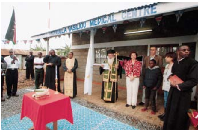
Από τα εγκαίνια του Νέου Ιατρικού Κέντρου στην Κένυα, το οποίο κτίστηκε με έξοδα της Επιτρόπου Υγείας της Ευρωπαϊκής Ένωσης κ. Ανδρούλας Βασιλείου και του συζύγου της

Η κ. Βασιλείου ξεναγήθηκε στους χώρους της Ιεράς Μητροπόλεως Κένυας, όπου καθηγητές και μαθητές της επιφύλαξαν θερμότατη υποδοχή και έψαλλαν σ' αυτήν στα ελληνικά και στα σουαχίλι. Η κ. Βασιλείου επισκέφθηκε όλες τις τάξεις, από το Νηπιαγωγείο μέχρι το Πανεπιστήμιο, και συνομίλησε με μαθητές και καθηγητές. Το μεσημέρι ο Σεβασμιώτατος παρέθεσε επίσημο γεύμα προς τιμή της κ. Βασιλείου στην Ορθόδοξη Πατριαρχική Σχολή «Αρχιεπίσκοπος Μακάριος Γ'».