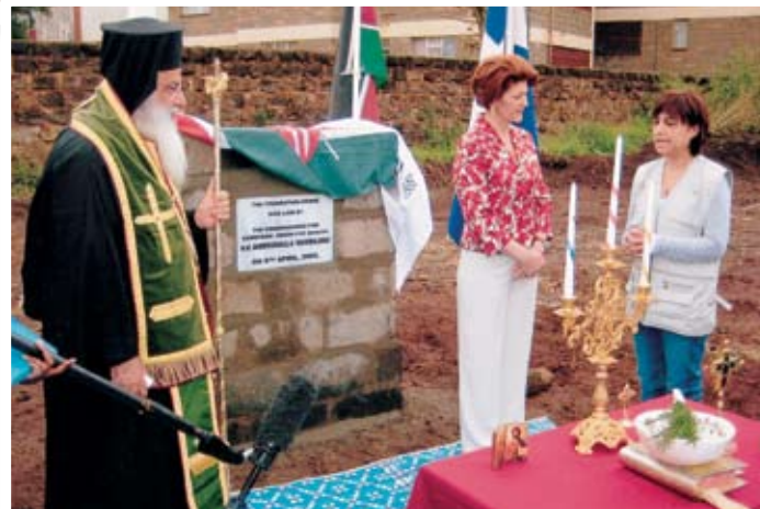
Από τον αγιασμό και την κατάθεση του θεμέλιου λίθου του Νέου Ορφανοτροφείου της Ιεράς Μητροπόλεως Κένυας, το οποίο ανεγείρεται με δαπάνες των εθελοντών ιατρών της Κύπρου