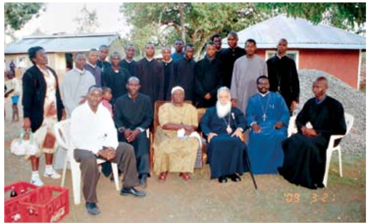
Στιγμιότυπο από την επίσκεψη του Σεβασμιωτάτου Μητροπολίτη Κένυας κ. Μακαρίου στη γιαγιά του Προέδρου των ΗΠΑ κ. Σάρρα Ομπάμα

Μ ε την ευκαιρία της επισκέψεως των «Γιατρών της Καρδιάς» στην Κένυα, οι οποίοι προσφέρουν εθελοντικά τις υπηρεσίες τους στον λαό της χώρας, μέσω της Ιεράς Μητροπόλεως Κένυας, ο Σεβασμιώτατος Μητροπολίτης Κένυας, συνοδευόμενος από τους ιατρούς και τους μαθητές της Πατριαρχικής Σχολής, επισκέφθηκε τη γιαγιά του Προέδρου των ΗΠΑ. Οι μαθητές εκτέλεσαν μουσικό πρόγραμμα, και ο Σεβασμιώτατος προσέφερε χρηματική βοήθεια για τα ορφανά, που περιθάλπει η γιαγιά του Αμερικανού Προέδρου.