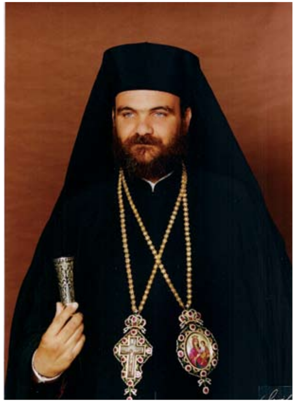
Ο Πανιερώτατος Μητροπολίτης Ταμασού και Ορεινής κ. Ησαΐας, Πρόεδρος του Φιλανθρωπικού και Ιεραποστολικού Ομίλου «Απόστολος Βαρνάβας»

Στην αρχή της ομιλίας του ο Σεβασμιώτατος Μητροπολίτης Σισανίου και Σιατίστης κ. Παύλος επισήμανε ότι οι έως τώρα συζητήσεις του με γονείς και παιδιά, που αναζητούν τον λόγο του Θεού και ψάχνουν εναγωνίως λύσεις στα προβλήματά τους, αποτέλεσαν βάση προβληματισμού για τον ίδιο και συνεχούς προσπάθειας άμβλυσης των επίμαχων σχέσεων ανάμεσα στους γονείς και στα παιδιά. Η κατάλληλη χρονική περίοδος και ο τρόπος ενασχόλησης των γονέων με τα προβλήματα των παιδιών τους αποτελούν μέλημα και ανησυχία των γονέων, που αρκετές φορές αναζητούν την πνευματική συνδρομή της Εκκλησίας, όταν τα προβλήματα υπάρχουν. Σε αυτό το πλαίσιο και με πρόθεση να καθορίσει τη σωστή χρονική περίοδο ενασχόλησης των γονέων με τα προβλήματα των παιδιών, ο ομιλητής προσπάθησε να ερμηνεύσει τους λόγους που ωθούν τους γονείς σε τέτοιους λανθασμένους χειρισμούς και κινήσεις που θα μπορούσαν να είχαν προληφθεί. Ένα σημαντικό πρώτο λόγο αποτελεί η άγνοια των γονέων για την ύπαρξη προβλημάτων στα παιδιά τους, καθώς θεωρούν ότι η παροχή υλικών αγαθών είναι αρκετή για την εξασφάλιση ενός υψηλού βιοτικού επιπέδου και αρμονικών σχέσεων μεταξύ τους. Έναν