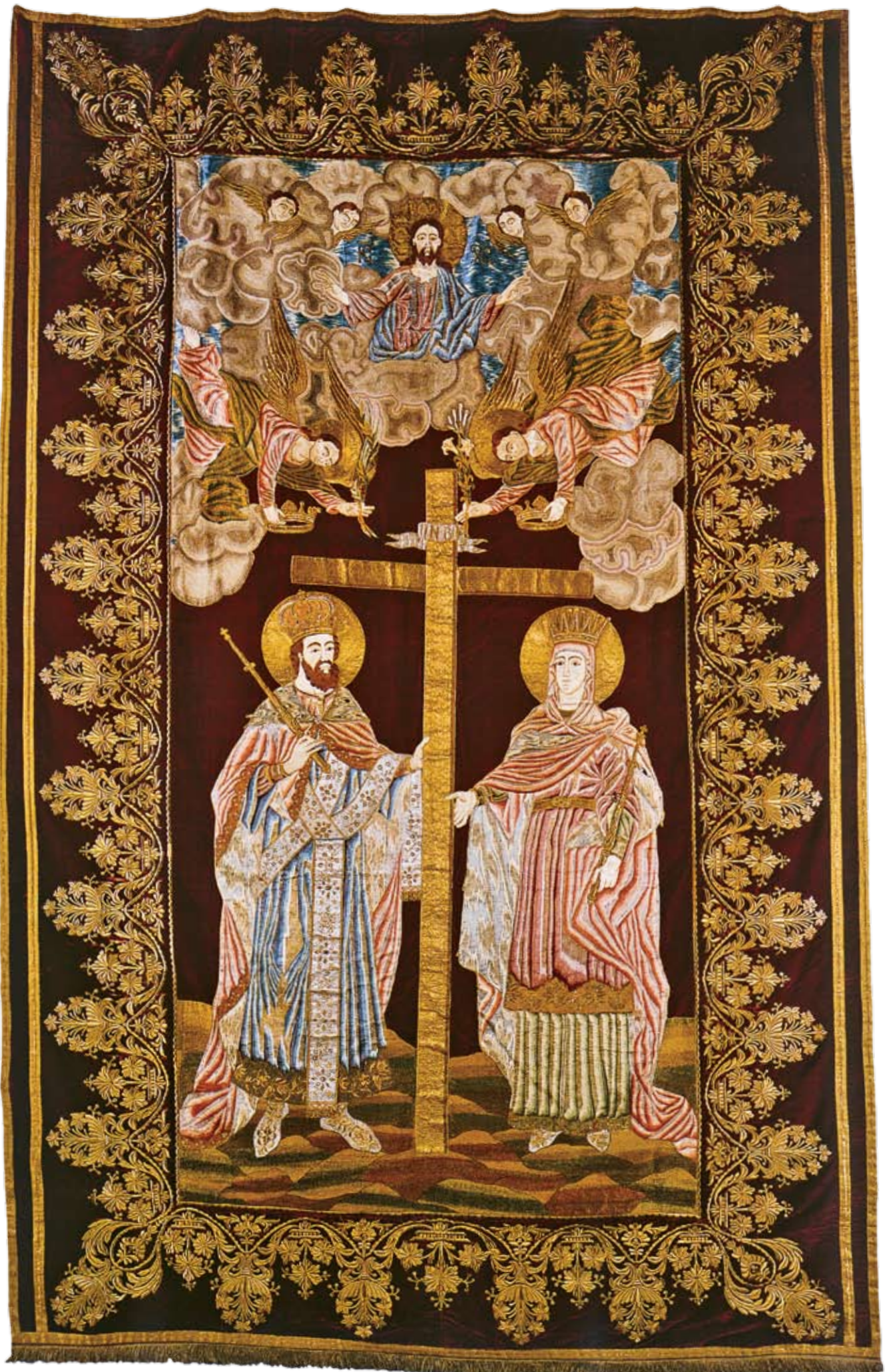
Πύλη Αγίων Κωνσταντίνου και Ελένης