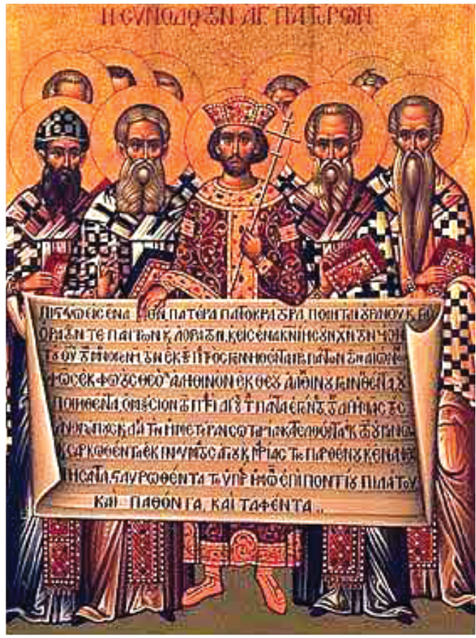
Ο Μέγας Κωνσταντίνος περιστοιχούμενος από εκκλησιαστικούς Πατέρες της Α' Οικουμενικής Συνόδου (325 μ.Χ.). Ο ρολός περιέχει το πρώτο μισό του συμβόλου Πίστεως Νίκαιας - Κωνσταντινούπολης

Στο πλαίσιο αυτό αναλύονται ορισμένα σημαντικά σημεία που συνθέτουν την ιστορία του Χριστιανισμού, της Εκκλησίας και της θρησκευτικής πολιτικής της υστερορωμαϊκής περιόδου 8 , και αποτελούν απαραίτητη προϋπόθεση για την κατανόηση του ιστορικού, πολιτικού και θρησκευτικού πλαισίου, στο οποίο στηρίχθηκε και μέσω του οποίου εκφράστηκε ο χαρακτήρας της πρωτεύουσας της αυτοκρατορίας,