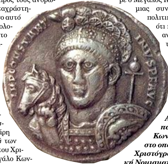
Αργυρό νόμισμα που παριστάνει τον Μεγάλο Κωνσταντίνο με κράνος, στο οποίο απεικονίζεται το Χριστόγραμμα. (Μόναχο, Κρατική Νομισματική Συλλογή)

Η νίκη του Μεγάλου Κωνσταντίνου κατά του