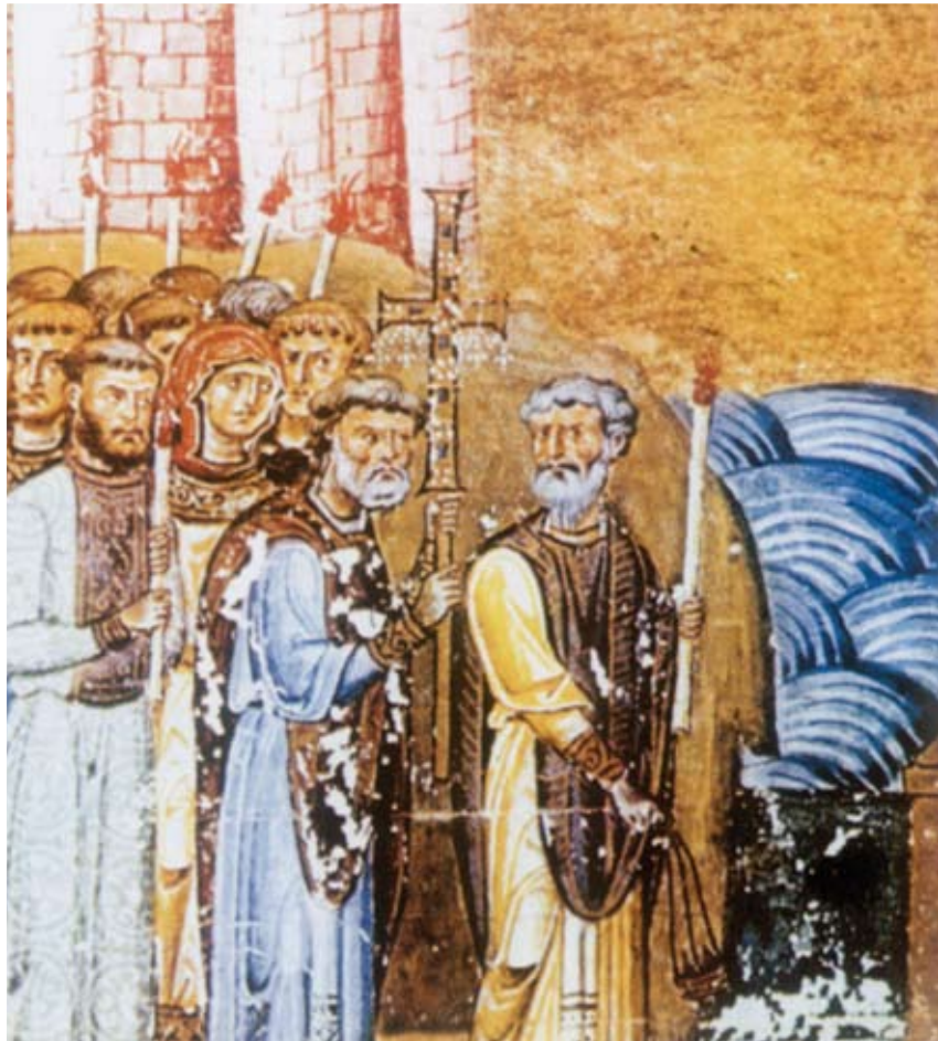
Απεικόνιση του Μεθοδίου και Κυρίλλου όπως παρουσιάζεται στο έργο «Η ζωή του Βασιλείου Β'». Εκδόθηκε από τον B. Chropovský, Stované, Orbix, Praha 1989

βασης του Πάπα ήταν η αποστολή από τον ίδιο ενσφράγιστης επιστολής που απευθυνόταν στον λαό της Μοραβίας – Παννονίας με οδηγίες ν' αναγνωσθεί δημόσια. Η συγκέντρωση του λαού ήταν τεράστια που περίμενε με κομμένη την ανάσα, φοβούμενος πως ο αγαπημένος του πνευματικός πατέρας θα αποπέμπετο. Η επιστολή όμως του Πάπα αποκαθιστούσε πλήρως τον Μεθόδιο. Η επιστολή μεταξύ άλλων έγραφε: «Ο αδελφός ημών Μεθόδι-