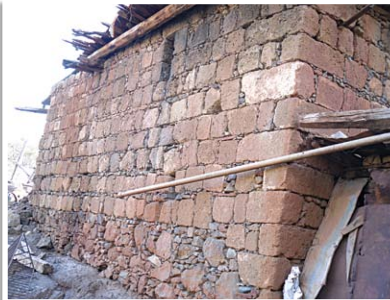
Οικία Κάβουρα στον Πάνω Πύργο Τηλλυρίας δομημένη σχεδόν εξολοκλήρου από ορθογωνισμένους πωρόλιθους οι οποίοι αφαιρέθηκαν από τα ερείπια της τοποθεσίας Αυλή

Η φετινή ανασκαφή επικεντρώθηκε προς τα βόρεια των οικοδομικών καταλοίπων, που εντοπίστηκαν κατά την περσινή πρώτη ανασκαφική φάση. Όπως αναμενόταν, το οικοδόμημα που ήταν κτισμένο με ορθογωνισμένους πωρόλιθους σε ισοδομικό σύστημα, επεκτεινόταν προς βορρά. Πρόκειται για την ανατολική πτέρυγα της οικοδομής, διαστάσεων περίπου 38 X 6.30 μέτρα και με άξονα νότος – βορράς, η οποία πιστεύεται ότι ήταν το σημαντικότερο τμήμα του όλου συγκροτήματος. Σύμφωνα με τα ανασκαφικά δεδομένα αυτή αποτελείται από έξι δωμάτια ανισομερή μεταξύ τους. Οι διαστάσεις τους ποικίλλουν ως προς το μήκος από 5.50, 6.60, 6.90 μέτρα. Ιδιαίτερα μεγάλη είναι η αίθουσα 6 με διαστάσεις 9.70 X 5.30 μέτρα. Η θεμελίωση και της πτέρυγας αυτής έγινε απ' ευθείας πάνω στον φυσικό ηφαιστειογενή βράχο της περι-