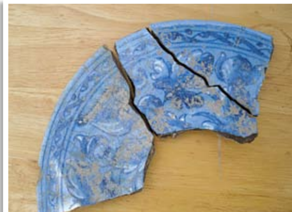
Τμήμα εισηγμένου μαγιόλικου πινακίου

Το ύψος διάσωσης των τοίχων είναι αισθητά χαμηλότερο από τα κατάλοιπα της νότιας πτέρυγας της οικοδομής. Κυμαίνονται από μηδενικό ύψος μέχρι και 80 εκ. Τούτο οφείλεται αφενός στην ανοδική πορεία του φυσικού βράχου προς τα βόρεια και κατά συνέπεια στη μικρή επίγωση, καθώς και στην εκτενέστερη λιθολόγηση του μνημείου, που έλαβε χώρα στα νεώτερα χρόνια. Οι εξωτερικοί τοίχοι του κτίσματος έχουν κυμαινόμενο πάχος γύρω στα 65