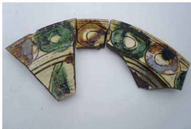
Τμήμα εφωλωμένου πινακίου