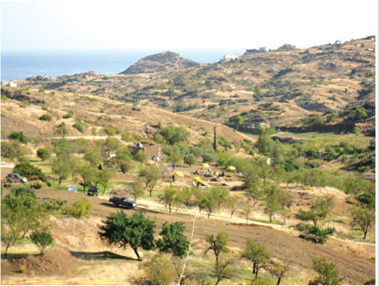
Γενική άποψη του χώρου της ανασκαφής από νοτιοδυτικά