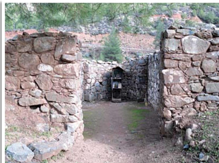
Το εσωτερικό του ναού της Αγίας Βαρβάρας από δυτικά

Καθοριστική στη διάσωση και ανάδειξη του καθόλα ταπεινού ναΐσκου της Αγίας Βαρβάρας υπήρξε η συμβολή του Μητροπολίτη Κύκκου και Τηλλυρίας κ. κ. Νικηφόρου, ο οποίος με το ευρύ πνεύμα σκέψης, που διαθέτει, αντελήφθη τη σημασία και την αξία του ναΐσκου αυτού, που όσο άσημος και αν παρουσιάζεται για μας σήμερα, τόσο σημαντικός, αν όχι και καθοριστικός, υπήρξε για τους προγόνους μας στα δίσεκτα χρόνια της Τουρκοκρατίας. Σε ένα τόπο ορεινό, δύσβατο και ιδιαίτερα φτωχό, όπως ήταν η περιοχή Τηλλυρίας, περιοχή που μαστιζόταν έντονα από το φαινόμενο του εξισλαμισμού – λινοβαμβακισμού, αυτοί οι ευτελείς ναοί από ακανόνιστους λίθους συνέβαλαν τα μέγιστα στη διατήρηση της ορθόδοξης χριστιανικής πίστης. Είναι αδιάψευστη μαρτυρία χριστιανικής πίστεως ή, όπως λέει και ο ποιητής, «φωνή πατρίδος». Ουκ εν τω μεγέθει το ευ! ■