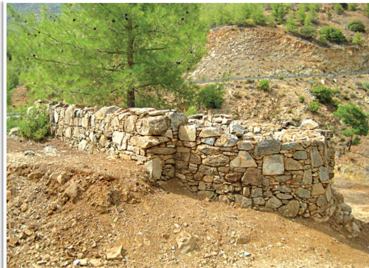
Εξωτερική νοτιοανατολική άποψη του ναού της Αγίας Βαρβάρας μετά την αποκατάσταση (2009)

τοιχών, που είναι θεμελιωμένοι πάνω στον φυσικό βράχο, κυμαίνεται γύρω στα 50 εκ. Οι τοίχοι είναι δομημένοι με ευτελή υλικά, τοπικούς λίθους, που αφθονούν στην περιοχή, οι οποίοι συγκρατούνται μεταξύ τους με απλή χωματόλασπη. Τα κενά μεταξύ των λίθων συμπληρώνονται με ιδιαίτερη επιμέλεια και πυκνότητα με χαλίκια από θρυμματισμένες πέτρες και κεραμικά από σπασμένα αγγεία και κεραμίδια. Το μέγιστο ύψος διάσωσης των τοίχων ανέρχεται γύρω στα 200 εκ. Η πρόσβαση στον ναό γίνεται από τη μοναδική είσοδο, πλάτους 120 εκ., που βρίσκεται στη δυτική πλευρά. Το τμήμα του τοίχου στα βόρεια της θύρας έχει μήκος 90 εκ. και το αντίστοιχο στα νότια 60 εκ. Στην κατάσταση διατήρησης, που είναι ο ναός, δεν είναι δυνατό να διευκρινιστεί η ύπαρξη η μή παραθύρων. Αδιευκρίνιστος είναι και ο τρόπος στέγασής του, αφού δεν διασώζονται στοιχεία, που να παραπέμπουν σ' αυτή. Δύο υποθέσεις μπορούν να γίνουν: ή ήταν καλυμμένος με δίρριχτη ξύλινη στέγη και επίπεδα αγκιστρωτά κεραμίδια, κάτι που συμβαίνει σε αρκετούς ναούς της ευρύτερης περιοχής, ή στεγα-