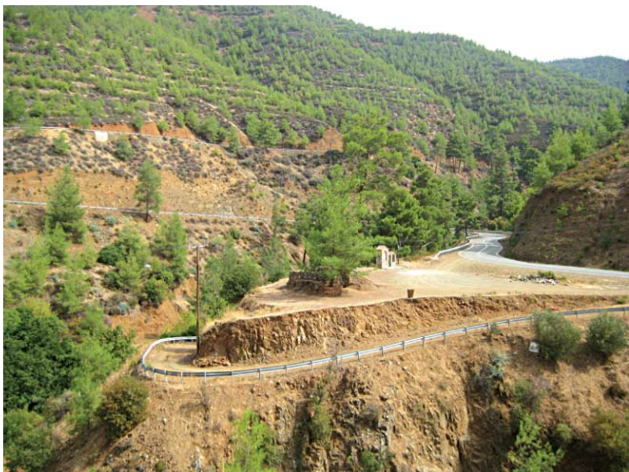
Γενική άποψη του ναού της Αγίας Βαρβάρας στον Κάμπο από βορειοδυτικά