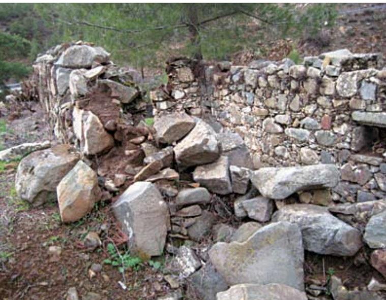
Εξωτερική νοτιοανατολική άποψη του ναού της Αγίας Βαρβάρας πριν την αποκατάσταση (2008)

έχει μήκος 20 εκ. και στα νότια 34 εκ. Στον βόρειο τοίχο και σε απόσταση 115 εκ. από τον ανατολικό τοίχο δημιουργείται τυφλή εσοχή με διαστάσεις 42 εκ. πλάτος, 34 εκ. ύψος και 45 εκ. βάθος, που χρησίμευε μάλλον σαν πρόθεση. Το πάχος των