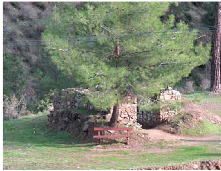
Ο ναός της Αγίας Βαρβάρας από βορειοδυτικά