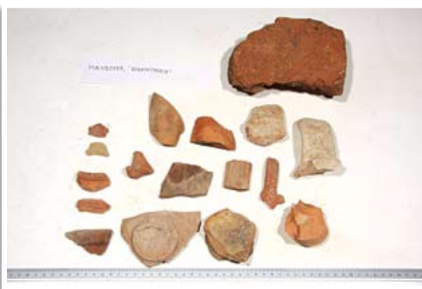
Κεραμικά όστρακα από την επιφανειακή επισκόπηση στη νεκρόπολη της Μανσούρας, τοποθεσία «Κοκκινούθκια»