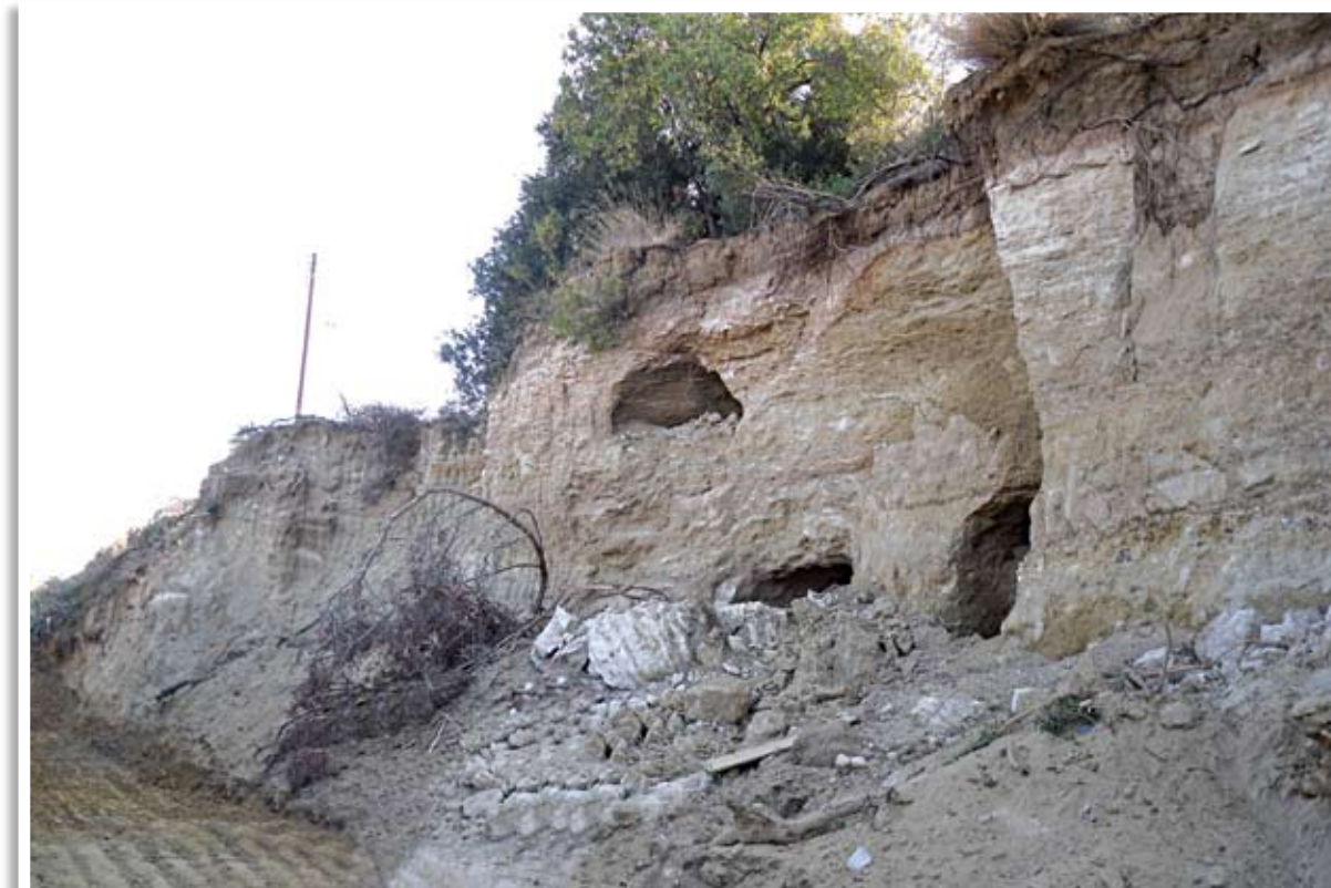
Κάτω Πύργος Τηλλυρίας. Αρχαίοι τάφοι στην τοποθεσία «Κοιλιάδα-Παλιάλωνα»

Αρκετοί τάφοι ανευρέθηκαν συλημένοι από παλαιότερα, αλλά δεν αποκλείεται να υπάρχουν και ασύλητοι. Αρχιτεκτονικά ανήκουν στον τύπο των λαξευτών στο φυσικό βράχο τάφων με κατεύθυνση, κατά κανόνα, προς τη θάλασσα. Ανάγονται στην ελληνιστική περίοδο με παρατεταμένη χρήση μέχρι τους ρωμαϊκούς χρόνους, ενδεχομένως και αργότερα. Τα στοιχεία αυτά θα επιβεβαιωθούν και θα ενισχυθούν, μόνο, εφόσον καθαριστεί και μελετηθεί ενδεικτικός αριθμός τάφων από κάθε νεκρόπολη.