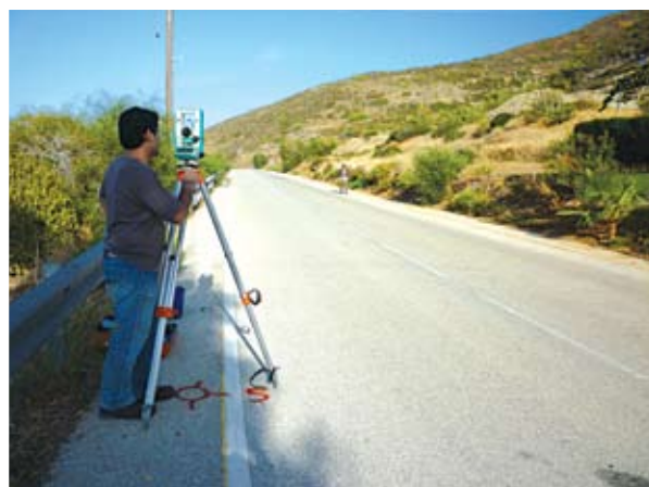
Τοπογραφική αποτύπωση με χρήση GPS

νης Κύκκου και πρόθεση του Μητροπολίτη Κύκκου και Τηλλυρίας κ.κ. Νικηφόρου είναι να ανασκαφούν οι τάφοι της περιοχής και να δημιουργηθεί ένα, πρωτότυπο στο είδος του, ταφικό αρχαιολογικό πάρκο. Με αυτό τον τρόπο, θα δοθεί νέα ώθηση στην περιοχή, η οποία παρουσιάζεται ελάχιστα μελετημένη από αρχαιολογική άποψη και γενικότερα παραμελημένη από πολλές άλλες απόψεις. ■