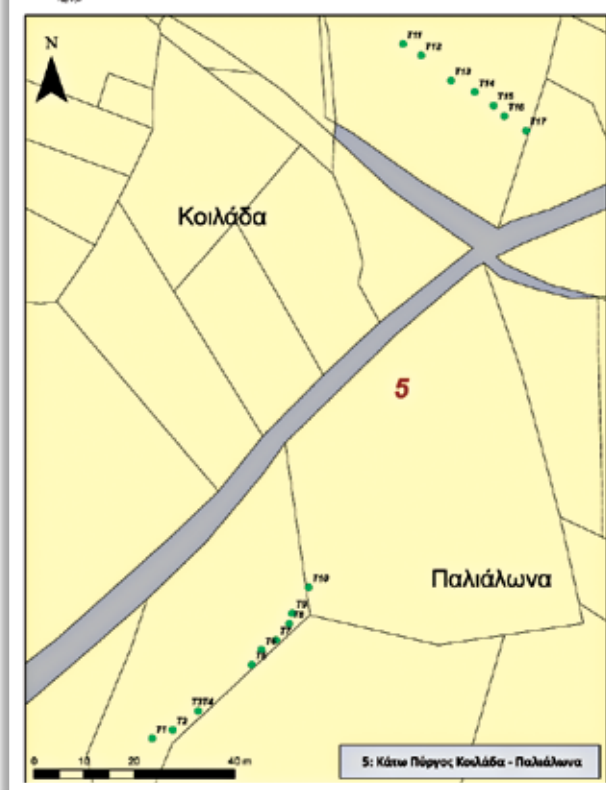
Αρχαίοι τάφοι που εντοπίστηκαν εντός του χωριού Κάτω Πύργος, στην τοποθεσία «Κοιλιάδα-Παλιάλωνα»

στηκαν αρκετοί νέοι τάφοι, προερχόμενοι από διαφορετικές νεκροπόλεις της ευρύτερης περιοχής Τηλλυρίας και καταγράφηκαν, ακολουθώντας τη διαδικασία που περιγράφηκε πιο πάνω. Μία από αυτές βρίσκεται στην Μανσούρα, τοποθεσία «Κοκκινιούθκια», νοτιοδυτικά της γνωστής νεκρόπολης της τοποθεσίας «Σπήλιος του Ληστή». Πιθανόν πρόκειται για το ίδιο εκτεταμένο νεκροταφείο των Ελληνιστικών-Ρωμαϊκών χρόνων. Άλλοι τάφοι εντοπίστηκαν στην περιοχή Πηγεγιών και στις τοποθεσίες «Καφιές» και «Ασβεστοκάμινος». Τέλος, νεκροταφείο εντοπίστηκε εντός του χωριού του Κάτω Πύργου, στην τοποθεσία «Κοιλιάδα-Παλιάλωνα».