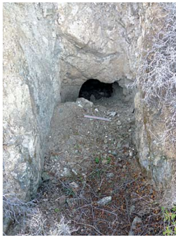
Είσοδος και στόμιο αρχαίου τάφου, στην τοποθεσία «Κοκκινούθκια», Μανσόρα

Κατά τη διάρκεια της επισκόπησης, εντοπί-