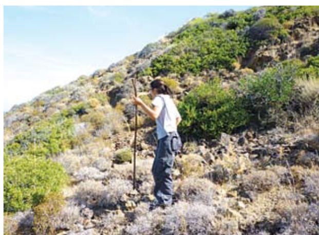
Κατά τη διάρκεια της επιτόπιας έρευνας στο λόφο της Μανσούρας