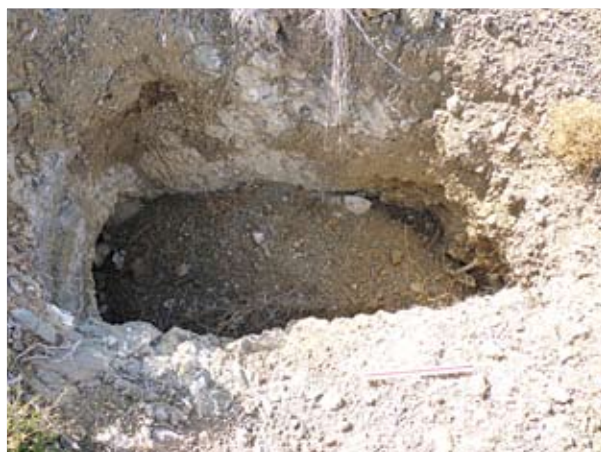
Συλημένος αρχαίος τάφος από τη νεκρόπολη της Μανσόυρας, τοποθεσία «Κοκκινούθκια»

● Της Βασιλικής Λυσάνδρου Αρχαιολόγου Μουσείου Ιεράς Μονής Κύκκου