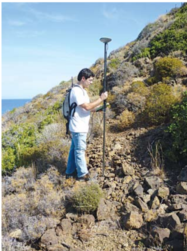
Τοποθέτηση σταθερών σημείων και προετοιμασία τοπογραφικής αποτύπωσης