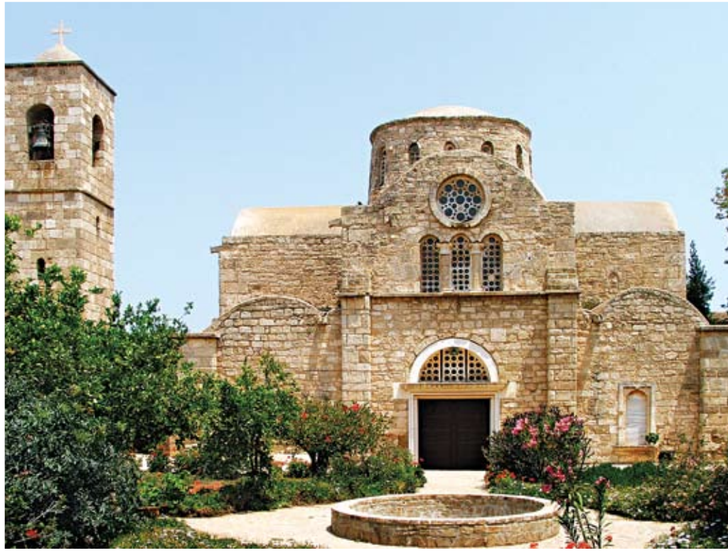
Ιερά Μονή του Αποστόλου Βαρνάβα (σήμερα κατεχόμενη)