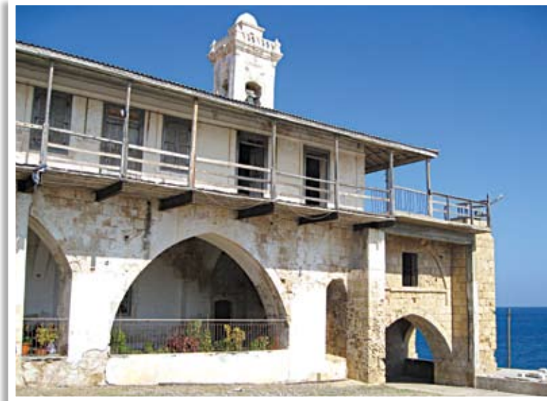
Ιερά Μονή του Αποστόλου Ανδρέα (σήμερα κατεχόμενη)

Μονής του ιδρυτή και προστάτη της Εκκλησίας της Κύπρου. Το βιβλίο επιμελήθηκε ο Κωστής Κοκκινόφτας και αποτελείται από 200 σελίδες. Διαχωρίζεται σε τρία μεγάλα τμήματα, στα οποία προτάσσεται χαιρετισμός του Αρχιεπισκόπου Κύπρου κ. Χρυσόστομου και πρόλογος του Ηγουμένου της Μονής Γαβριήλ. Το πρώτο από αυτά περιλαμβάνει τέσσερις μελέτες: για τον βίο του Αποστόλου Βαρνάβα από τον Αρχιμανδρίτη Βαρνάβα, για τις πηγές για τον βίο και την ιεραποστολική δράση στην Κύπρο του Αποστόλου από τον Σταύρο Γεωργίου, για τη Μονή του Αποστόλου Βαρνάβα και την επαναλειτουργία της στα νε-