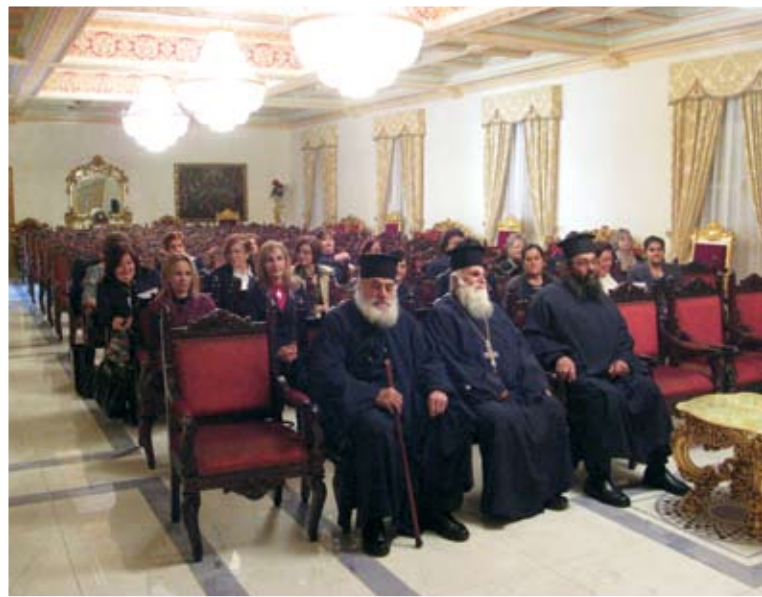
Αποψη από τη συγκέντρωση στο Μέγα Συνοδικό του Μετοχίου Κύκκου στη Λευκωσία

Όσον αφορά στις κοινές δραστηριότητες όλων των Συνδέσμων, λήφθηκε απόφαση, όπως την Κυριακή των Μυροφόρων (17 Απριλίου 2010), μέρα κατά την οποία εορτάζουν κατ' εξοχήν οι Χριστιανικοί Σύνδεσμοι, πραγματοποιηθεί στην Ιερά Μονή Κύκκου προσκυνηματική επίσκεψη με συμμετοχή στη θεία Λειτουργία, κατά την οποία θα προστεί ο Πανιερώτατος μας κ.κ. Νικηφόρος. Στη συνέχεια θα οργανωθεί πρόγραμμα με ομιλία, καλλιτεχνικό περιεχόμενο και επίδοση αναμνηστικού δώρου από μέρος του Πανιερωτάτου. Η όλη εκδήλωση θα περατωθεί με κοινό γεύμα. Επίσης, αποφασίστηκε να λειτουργήσει, κατά τους θερινούς μήνες, ένα κατασκηνωτικό τριήμερο για τα μέλη των Συνδέσμων στην Ιερά Μονή Κύκκου. Η