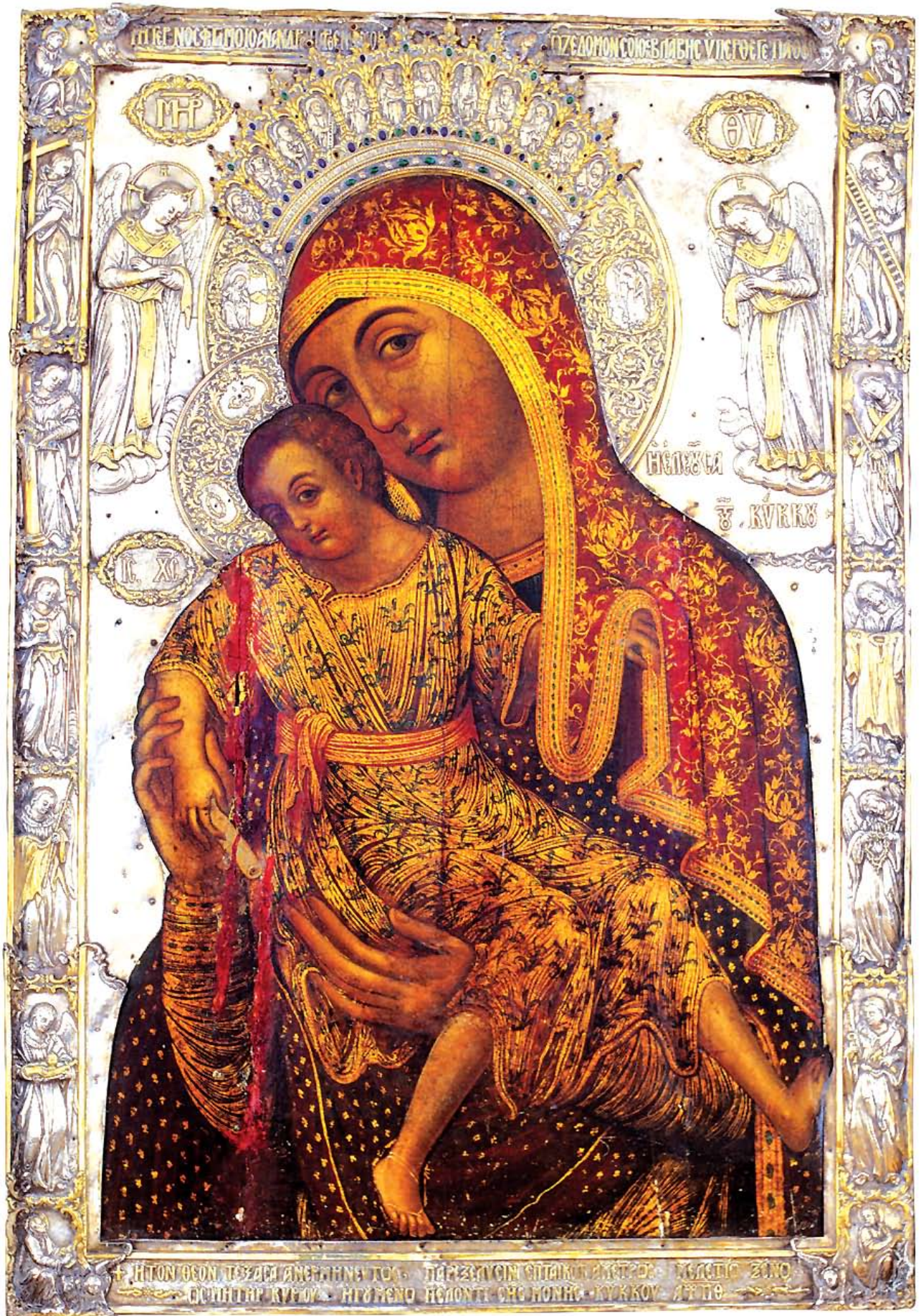
Η Ελεούσα του Κύκκου