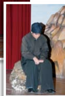
Στιγμιότυπο από την θρησκευτική παράσταση «Η προσαγή της Κυκκώτισσας»