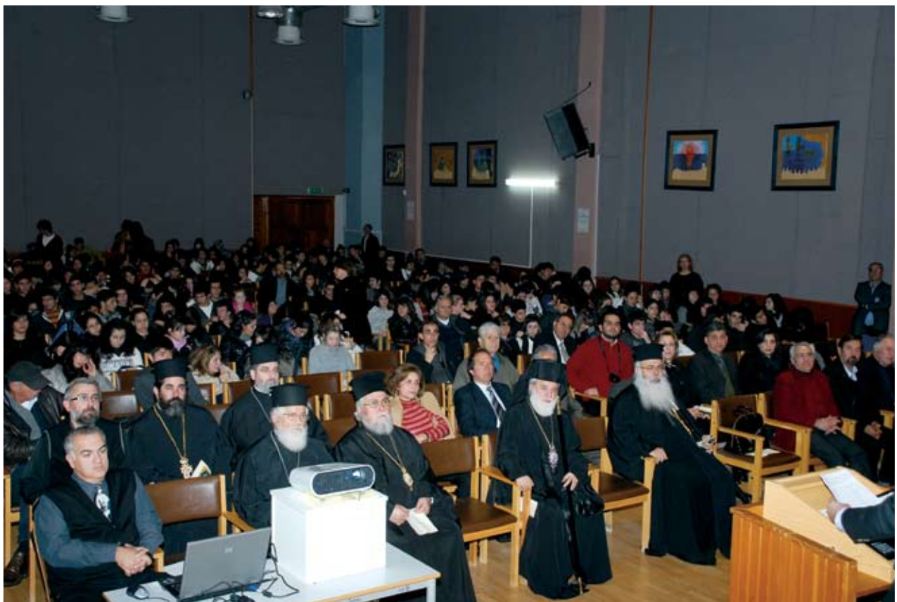
Αποψη από την Εκδήλωση. Διακρίνονται (στο κέντρο) ο τιμώμενος Μητροπολίτης Κύκκου και Τηλλυρίας κ.κ. Νικηφόρος, ο Πανιερωτάτος Μητροπολίτης Πάφου κ. Γεώργιος (δεξιά), ο Θεοφιλέστατος Χωρεπίσκοπος Χύτρων και Ηγούμενος της Ιεράς Μονής Αγίου Νεοφύτου κ. Λεόντιος και άλλοι επίσημοι

του Κύκκου Μονής». Στη συνέχεια, ο φιλόστοργος πνευματικός πατέρας, που έχει αγκαλιάσει το Λύκειο Κύκκου Πάφου μέσα στην ορθάνοικτη αγκαλιά του, είπε: «Δηλώνουμε ως από δώματος υψηλού πως από σήμερα το Λύκειο Κύκκου Πάφου θα βρίσκεται κάτω από την προστασία της περίπιστης ανά την ορθοδοξία Ιεράς Βασιλικής και Σταυροπηγιακής Μονής Κύκκου».