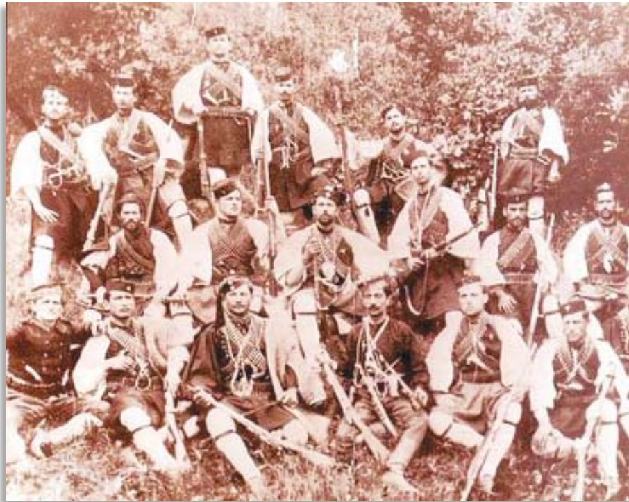
Χαρακτηριστικὴ φωτογραφία ἀπὸ ἔνοπλη ὁμάδα κατὰ τὸ Μακεδονικὸ Ἀγῶνα

Ἡ βοήθεια τῆς Ἐκκλησίας στὸν ἀγῶνα τοῦ '40 δὲν ἦταν ἀπλῶς ἠθικὴ, ἀλλὰ καὶ γενναϊόδωρα οικονομικὴ. Μόνο τὸ ἱερὸ ἴδρυμα τῆς Εὐαγγελίστριας τῆς Τήνου διέθεσε γιὰ τὸν ἀγῶνα τοῦ '40, 5.000.000 δρχ. καὶ ὅλα τὰ ἀφιερῶματα καὶ κοσμήματα. Στὴν Ἀρχιεπισκοπὴ Ἀθηνῶν συστάθηκε πρόνοια στρατευομένων μὲ 173 παραρτήματα σὲ ὁλόκληρη τὴν πρωτεύουσα καὶ τὸν Πειραιᾶ. Μὲ τὸ Β.Δ. τῆς 12ης Ἰουνίου 1940 ἐπιστρατεύθηκαν πλεῖστοι κληρικοὶ ὡς