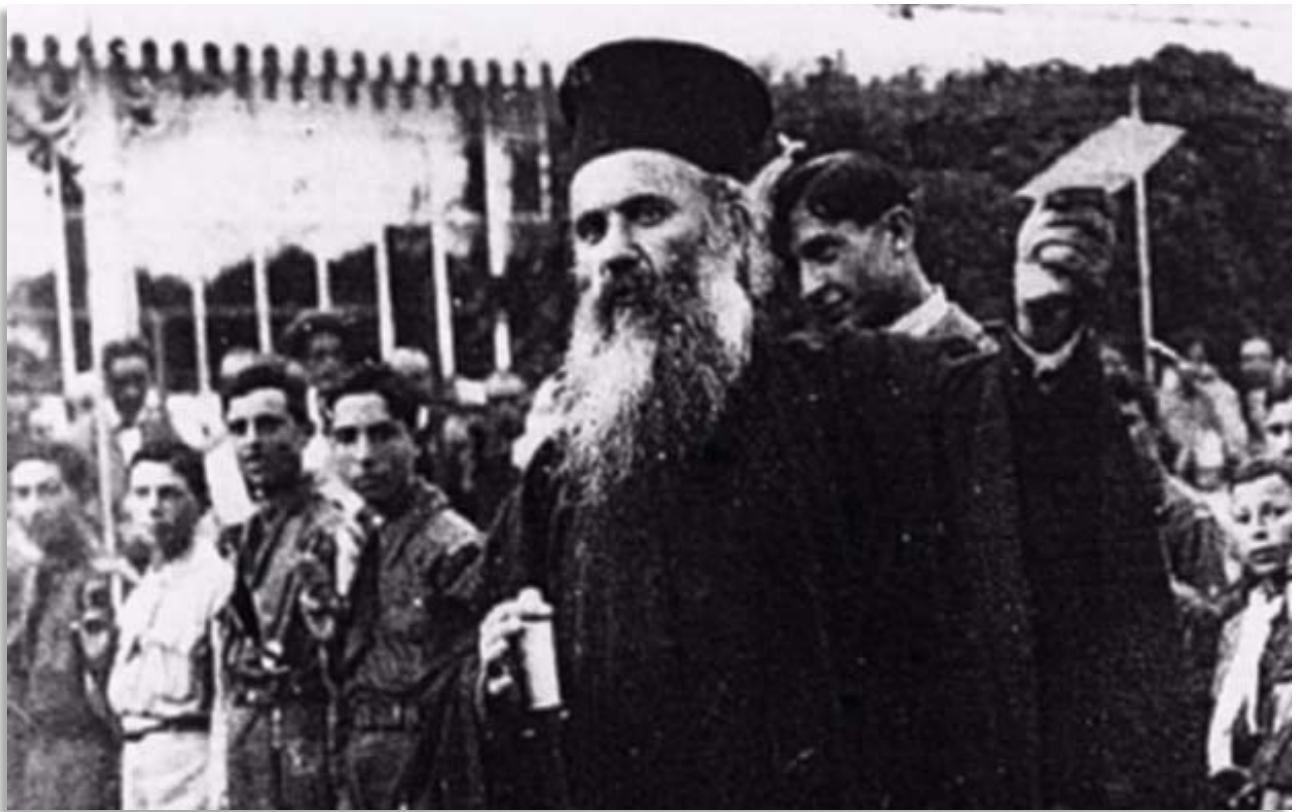
Ὁ ἐθνομάρτυρας καὶ ἱερομάρτυρας Μητροπολίτης Σμύρνης Χρυσόστομος

Σήμερα, καθὼς μπήκαμε στὸν νέο εὐρωπαϊκὸ Status καὶ ἀναγκαστικὰ θὰ ὀδηγηθοῦμε σὲ ἓνα πολιτιστικὸ καὶ πνευματικὸ συγκρητισμὸ τῶν λαῶν τῆς Εὐρώπης, ἡ Ὁρθοδοξία ἔχει πολλὰ νὰ προσφέρει ὄχι μόνον στὴ διατήρηση τῆς φυσιογνωμίας τοῦ ἐθνικοῦ καὶ πνευματικοῦ μας βίου, ἀλλὰ κυρίως ὡς ζύμη στὶς ἀναζητήσεις τῆς Δύσεως. Ἡ Ὁρθόδοξη Ἐκκλησία ἄλλως τε ὑπῆρξε ἀπὸ τὴν ἀρχὴ σημαντικὸς παράγων στὴ διαμόρφωση τῆς πνευματικῆς ταυτότητας τῆς Εὐρώπης καὶ τοῦ εὐρωπαϊκοῦ