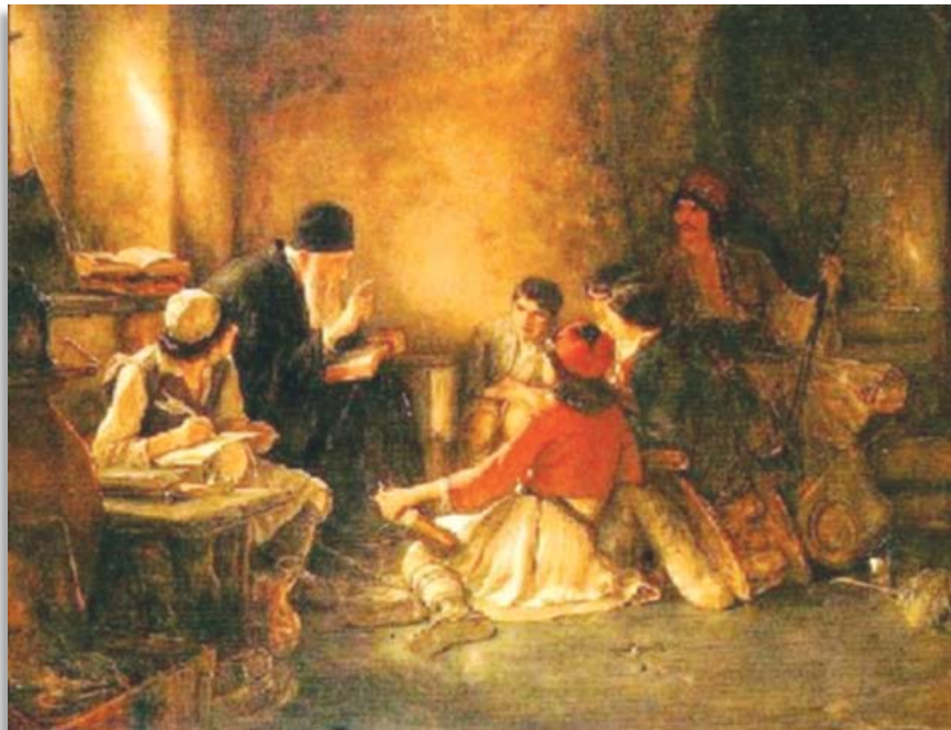
Τὸ κρυφὸ σχολεῖο

Τρεῖς εἶναι οἱ σπουδαιότεροι στόχοι τῆς Ὁρθοδοξίας αὐτὴ τὴν περίοδο. Ἡ διατήρησιν