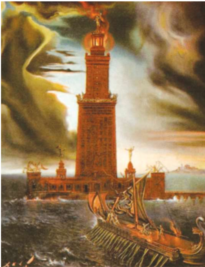
Σχηματική αναπαράσταση του Φάρου της Αλεξάνδρειας και πλοίου της εποχής εκείνης

Φάρος και έλεγε «Σώστρατος Κνίδιος Δεξιφάνους Θεοίς Σωτήριον υπέρ των πλωιζομένων». Ο πύργος αυτός ο οποίος τόσο πολύ θαυμάστηκε για το μέγεθός του και το κάλλος του, ώστε αργότερα συμπεριελήφθη στα Επτά θαύματα του Κόσμου.