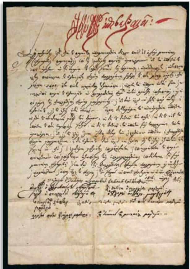
Έγγραφο του εθνομάρτυρα αρχιεπισκόπου Κύπρου Κυπριανού (1810-1821)

Κύπρου και του ευρύτερου Ελληνισμού ή σχετικού με τη δράση της Ε.Ο.Κ.Α. αποθησαυρίζεται στα αρχεία της Μονής Κύκκου.