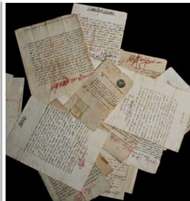
Μερικά από τα νεοαποκτηθέντα έγγραφα

Εξαίρεση στα πιο πάνω αποτελεί η Ιερά Μονή Κύκκου, η οποία στην τελευταία δεκαετία με τα ερευνητικά της κέντρα, όχι μονάχα προχωρεί στον εντοπισμό αρχειακού υλικού και στην έκδοσή του, αλλά και στην αγορά του. Πέραν των τριάντα χειρόγραφων βιβλίων έχουν αγοραστεί ή δωρηθεί στο Μουσείο της Μονής. Μερικά μάλιστα είναι περγαμηνά, και διασώζουν έγχρωμες μικρογραφίες. Αρχειακό υλικό σημαντικών προσωπικοτήτων της