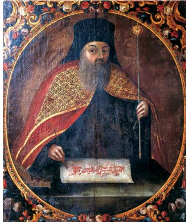
Ο αρχιεπίσκοπος Κύπρου Χρυσανθος (1767-1810)

Συμφωνία (Ιούνιος 1880) αγοραπωλησίας με-