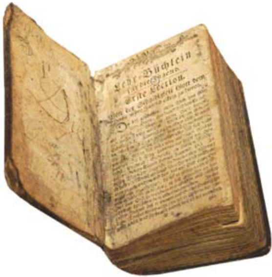
Ξερόγλωσσο βιβλίο του 18ου αιώνα που φυλάσσεται στη Βιβλιοθήκη του Κέντρου Μελετών της Ιεράς Μονής Κύκκου