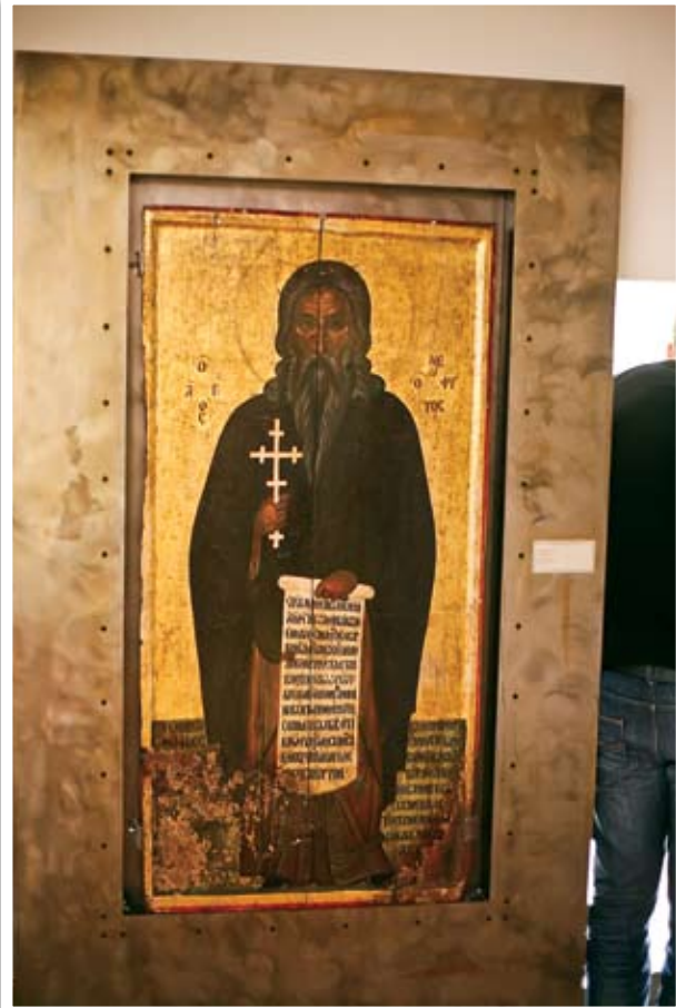
Ο Άγιος Νεόφυτος, εικόνα 15ου αιώνα

Η Ιερά Μονή μας και η Αδελφότητα αυτής αποδέχεται αυτή τη βράβευση ως μια πνευματική τόνωση και ηθική ενίσχυση, για να μπορέσουμε έτσι με ανανεωμένες τις δυνάμεις να συνεχίσουμε την περαιτέρω προσπάθεια για το επόμενο στάδιο, που αφορά σε νεοελληνική μετάφραση των έργων του Αγίου Νεοφύτου. Μόνο έτσι θα γίνει γνωστή η διδασκαλία του και θα αναδειχθούν στο σύνολο του απλού θρησκευόμενου και ορθόδοξου λαού μας οι μεγάλοι ασκητικοί και