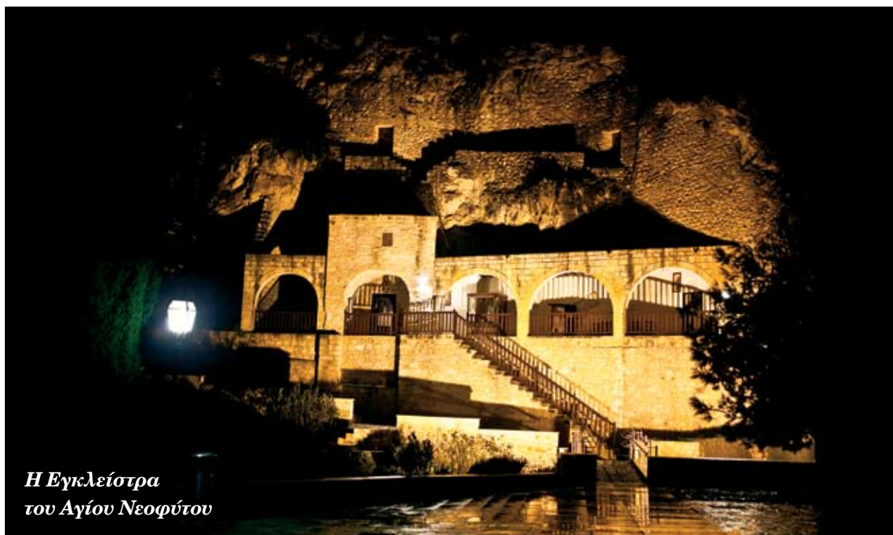
Η Εγκλείστρα του Αγίου Νεοφύτου

Σ' αυτό το συνέδριο, που από τις κριτικές που έγιναν, περαίνεται ότι στέφθηκε με πλήρη επιτυχία, έλαβαν μέρος πέραν των πενήντα και πλέον διακεκριμένων προσωπικοτήτων από διάφορα πανεπιστήμια της Ελλάδος και του εξωτερικού. Ανάμεσα σ' αυτούς ήταν, η διαπρεπής Πρύτανης του Πανεπιστημίου της Σορβόνης κα Γλυκατζή Αρβελέρ, και ο διακεκριμένος Κύπριος Ακαδημαϊκός