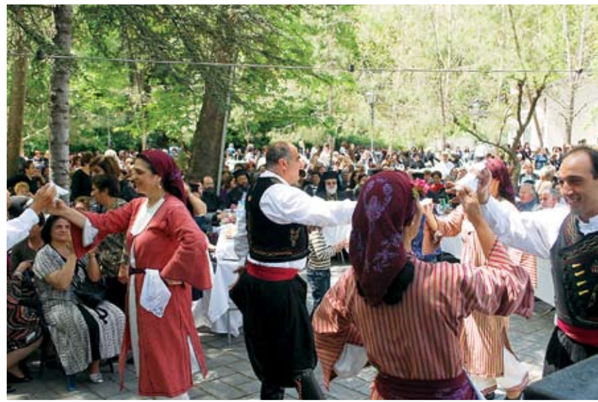
Την έναρξη των χορών άνοιξε το Χορευτικό Συγκρότημα «Λίμνη» Παραλιμνίου, για να δοθεί το σύνθημα και να χαρούν με τους χορούς και τα μέλη των Συνδέσμων Γυναικών