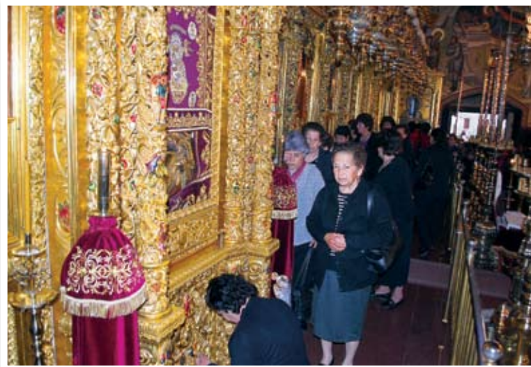
Στιγμιότυπα από τη Θεία Λειτουργία στην Ιερά Μονή Κύκκου