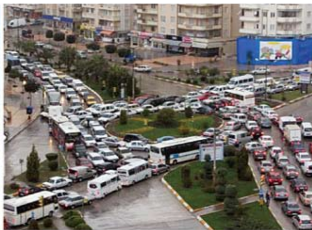
Αδανα: Κυκλοφοριακή συμφόρηση

πληθυσμός της ξεπερνά σήμερα τις 220.000 κατοίκους.