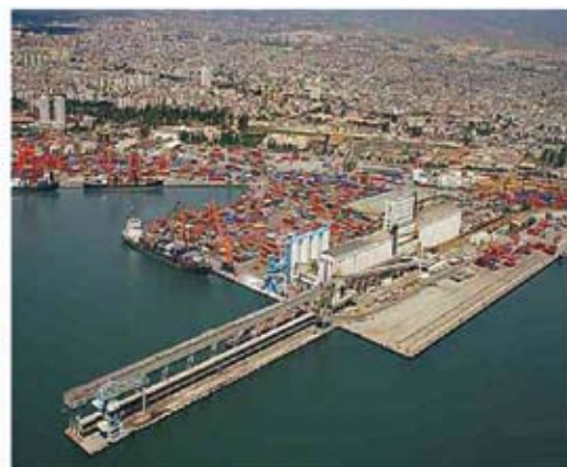
Μερσίνα: Άποψη του λιμένος