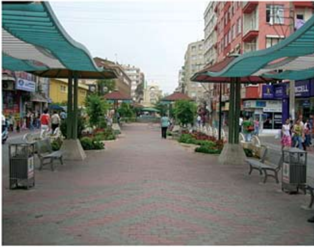
Ταρσός: Εμπορικός πεζόδρομος