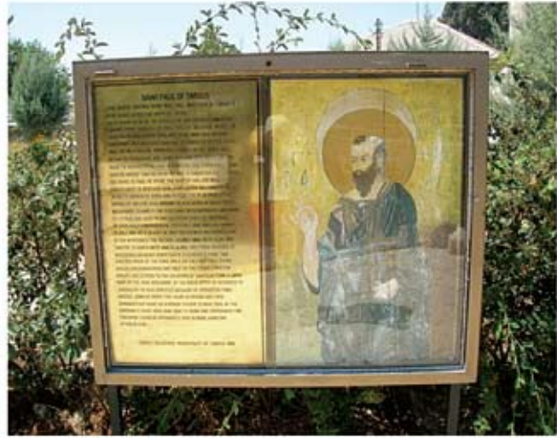
Ταρσός: Το πάρκο «Απόστολος Παύλος»

πόλη σημαντικό κέντρο εμπορίου και βιομηχανίας. Ο δρόμος προς βορρά μέσα από τις Κιλικίες Πύλες οδηγεί στην Καππαδοκία και από εκεί στην Άγκυρα. Ο δρόμος προς νότο κατευθύνεται προς τη Συρία και από εκεί σ' όλη τη Μέση Ανατολή. Εδώ δημιουργήθηκε ένα από τα μεγαλύτερα υδροηλεκτρικά εργοστάσια της Τουρκίας, για να ακολουθήσει στη συνέχεια η εγκατάσταση πλήθους βιομηχανικών μονάδων παραγωγής υφασμάτων, τροφίμων και οικοδομικών υλικών.