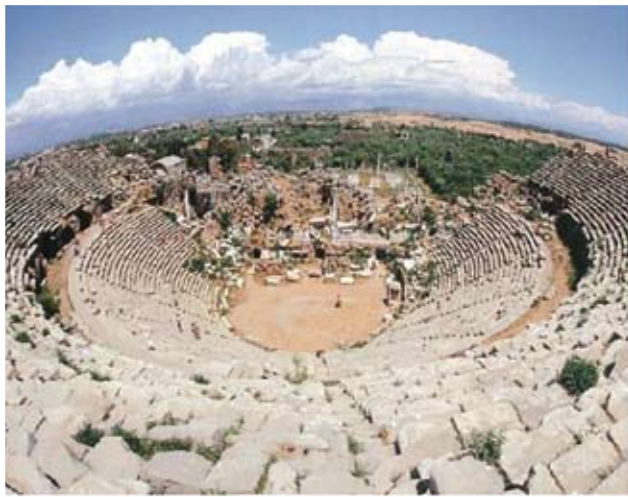
Το Αμφιθέατρο της Παμφυλίας

Με ένα νοικιασμένο μεγάλο τζιπ, πρωί-πρωί, η ομάδα μας, επτά άτομα, πήρε το δρόμο για τη Manavgat , με κατεύθυνση στα βουνά προς το Seydisehir . Εκεί έγινε η πρώτη διανυκτέρευση για να αρχίσει την επόμενη μέρα η κάθοδος προς το νότο, προς τα χωριά της Κιλικίας. Η Τραχεία Κιλι-