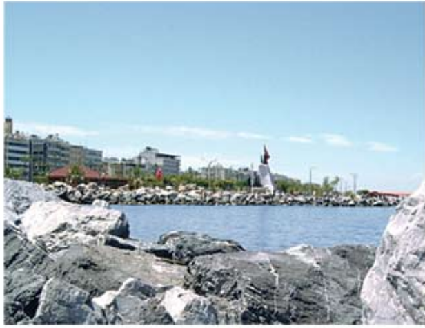
Αλεξανδρέττα: Άποψη της παραλίας