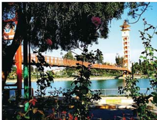
Αδανα: Πάρκο αναψυχής