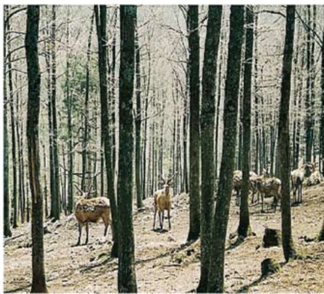
Εθνικό πάρκο με ελάφια στο Uludağ