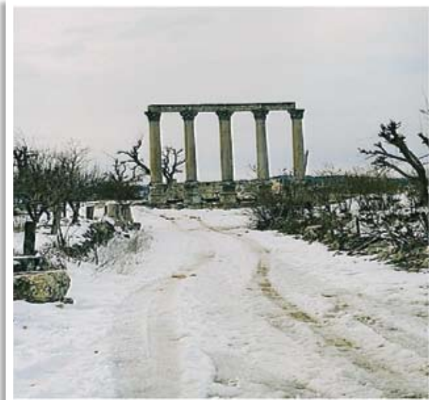
Αρχαίος ελληνικός ναός στην Οίβα