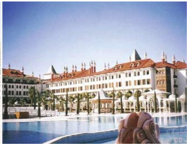
Antalya – Topkapi Palace Hotel

στική εποχή, κατά το ιπποδάμειο σύστημα, με το κέντρο και τα γύρω τετράγωνα, έχει το περίφημο αμφιθέατρό της στις παρυφές των προς βορράν υψωμάτων, στην αγκαλιά του βράχου. Τρεις μαρίνες δέχονται ξένα σκάφη και το αρχαιολογικό μουσείο της θεωρείται από τα πιο άρτια, πλούσιο σε πολύτιμα ευρήματα από κάθε πολιτισμό της Ανατολίας. Εδώ ο Ελληνισμός έχει αφήσει ανεξίτηλα τα σημάδια της παρουσίας του ιδιαίτερα στη συνοικία Kaleici, όπου βρίσκονται τα ελληνικά αρχοντικά, με εξαιρετική εξωτερική διακόσμηση, που αναπαλαιώθηκαν και λειτουργούν ως ξενώνες και μοτέλ.