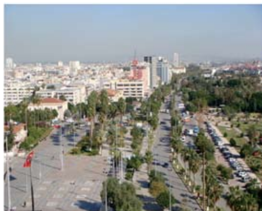
Μερσίνα: Άποψη της πόλης

Δεξιά η θάλασσα της Μεσογείου και αριστερά οι κατάφυτοι λόφοι και τα βουνά προσφέρουν μια εντυπωσιακή εικόνα. Η πόλη είναι καινούργια. Ιδρύθηκε το 1832, αλλά από τις ανασκαφές που έγιναν το 1947 βρέθηκαν κτίσματα αρχαίας πόλης που καλύπτουν μία μεγάλη χρονική περίοδο από την 7η ως τη 2η χιλιετία π.Χ. Φθάσαμε κατά τις 2.30' το μεσημέρι, κατάκοποι, αλλά χαρούμενοι γιατί επιτέλους τελειώσε η ταλαιπωρία των βουνών, με τους δύσκολους δρόμους, το υψόμετρο, την υγρασία και τους επικίνδυνους χειμάρους. Η Μερσίνα τα τελευταία είκοσι χρόνια έχει αναπτυχθεί τουριστικά και αξιοποίησε σε εντυπωσιακό βαθμό της φυσικές ομορφίες των παραλιών της. Ο