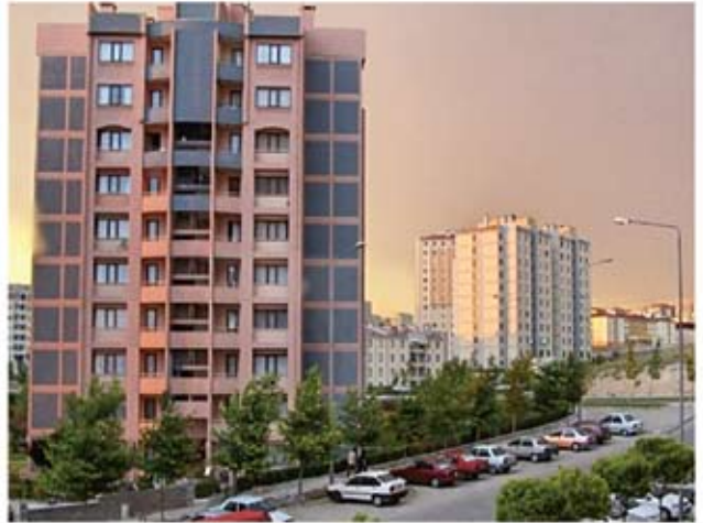
Αλεξανδρέττα: Το ξενοδοχείο του «Κρητικού»

του λεωφορείου, πλησίασε κοντά μας, μας χαιρέτησε σε άψογα ελληνικά και φώναξε: « Καλώς ορίσατε ». « Σας περιμένω από το πρωί ». « Ήρθατε επιτέλους ». « Το ξενοδοχείο μου είναι δικό σας ». Αυτή ήταν η μεγάλη μας έκπληξη. Το βράδυ τις ίδιες μέρας μας περίμενε και μια δεύτερη. Στην ταράτσα του ξενοδοχείου είχε ετοιμαστεί ένα μεγάλο τραπέζι σε σχήμα Π, για ένα εξαιρετικό δείπνο που μας πρόσφερε ο ιδιοκτήτης του. Καθήσαμε ελαφρά σφιγμένοι. Κάτι συνέβαινε.