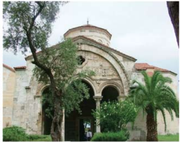
Σελεύκεια: Η Αγία Σοφία έρημη

Από εδώ μπαίνουμε σε τουριστική περιοχή, με σύγχρονους μεγάλους δρόμους και το ταξίδι μας προς την Μερσίνα δεν θα είναι περισσότερο από μια ώρα. Ο παραλιακός δρόμος συνδυάζει θέαμα,