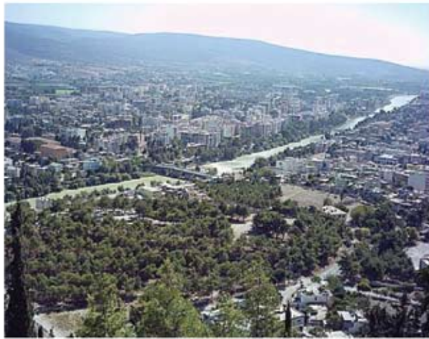
Σελεύκεια: Πανοραμική άποψη.

Έπρεπε να αφήσουμε τα δυτικά της οροσειράς του Ταύρου, την Τραχεία Κιλικία και να κατεβούμε στα παράλια. Ευτυχώς, όπως μας πληροφορήσαν, οι δρόμοι προς το νότο ήταν πολύ καλοί. Αν φθάναμε στη Silifke (Σελεύκεια) θα τελειώνει η ταλαιπωρία μας. Βέβαια η Σελεύκεια ήταν αρκετά μακριά. Χρειάστηκαν έξι ώρες ταξίδι για να δούμε τα τείχη της από τα δυτικά και να μπούμε στο κέντρο. Μια πόλη πάνω στον Καλύκανδο ποταμό, τόπο αγίων και μαρτύρων, με ελληνιστικά και βυζαντινά κάστρα.