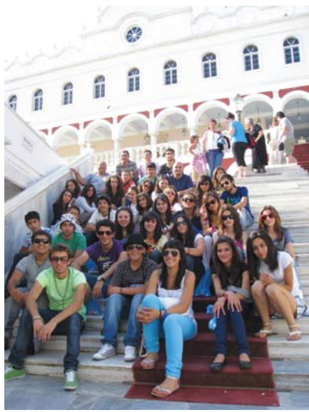
Μια αναμνηστική φωτογραφία μπροστά από την εκκλησία της Παναγίας της Τήνου