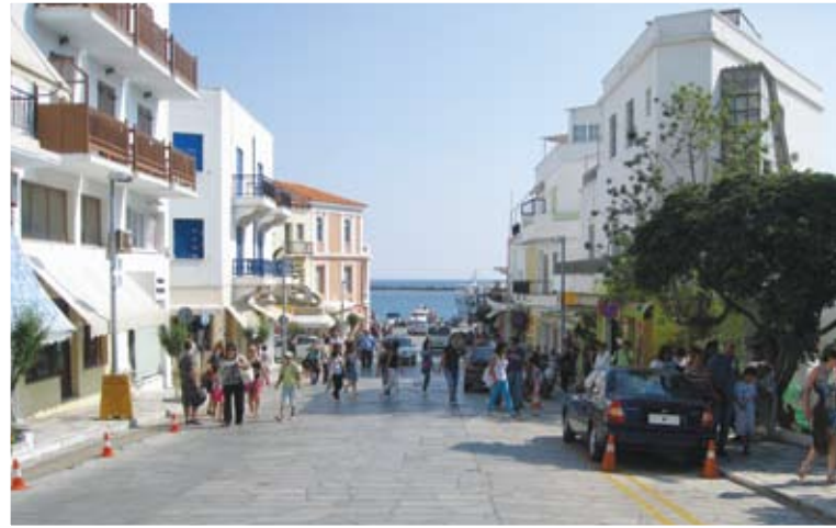
Ανηφορίζοντας το πλακόστρωτο στην κεντρική πλατεία της Τήνου που οδηγεί στο πανιέρο προσκύνημα της Παναγίας