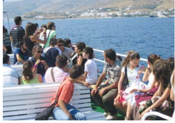
Ταξιδεύοντας στα γαλάζια νερά του Αιγαίου και ατενίζοντας τα γραφικά και υπέροχα νησιά του

Για όλα αυτά και πολλά άλλα οφείλουμε ένα μεγάλο ευχαριστώ στον πνευματικό μας Πατέρα, τον Μητροπολίτη μας κ.κ. Νικηφόρο, και μια προσευχή ώστε ο Θεός να του δίδει υγεία, μακροήμευση και δύναμη πολλή, για να επιτελεί το έργο που του ανέθεσε. ■