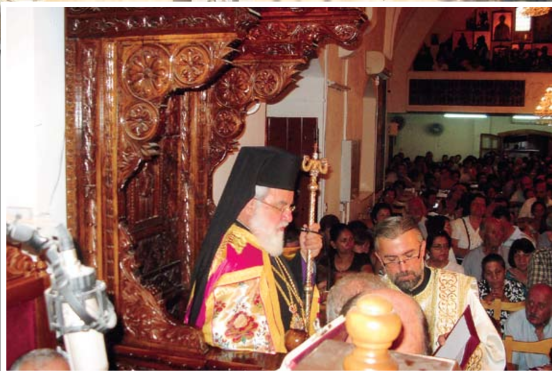
Από την τελετή του Εσπερινού στον ιερό ναό Αγίου Νικολάου Κάτω Δευτεράς