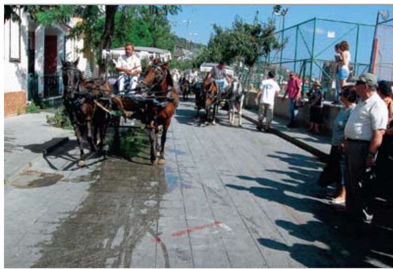
Κάτω στην παραλία της Χάλκης οι εκδρομείς μας περιδιαβαίνουν τα γραφικά δρομάκια του νησιού, αναμένοντας τις άμαξες να τους μεταφέρουν στην κορυφή, όπου βρίσκεται η Σχολή