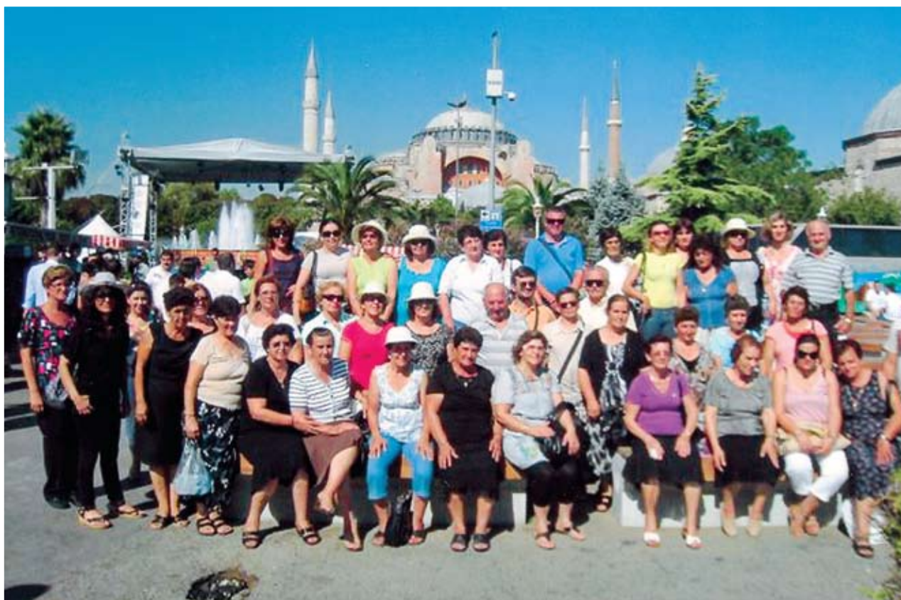
Αναμνηστική φωτογραφία μιας ομάδας των εκδρομέων μας μπροστά στην Αγία Σοφία