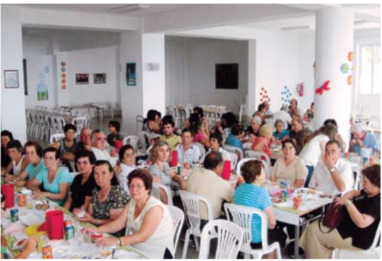
Αβραμιαία η φιλοξενία σε όλους τους εκδρομείς (163 άτομα) στην τραπεζαρία της κατασκήνωσης της Αδελφότητας