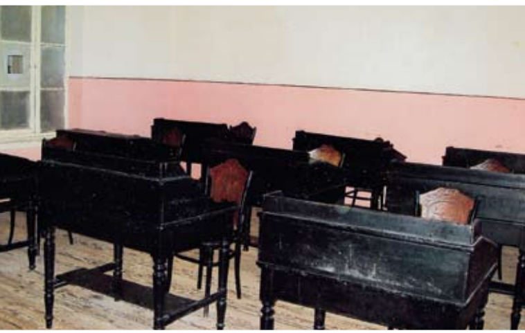
Έτοιμες αλλά κενές και βουβές οι τάξεις διδασκαλίας της Σχολής, οι οποίες άλλοτε βούιζαν από ζωή και μεγαλείο

Η πρώτη μας επίσκεψη στο νησί Χάλκη. Πήγαμε κατ' ευθείαν στην Πατριαρχική Θεολογική Σχολή Χάλκης, που σήμερα λόγω της άρνησης των Τούρκων δεν λειτουργεί. Βρίσκεται στην κορυφή του βορείου πευκόφυτου λόφου του νησιού. Η Σχολή ιδρύθηκε το 1844 στην εκεί ευρισκόμενη Μονή της Αγίας Τριάδος, την οποία έκτισε ο Μ. Φώτιος, Πατριάρχης Κωνσταντινουπόλεως (864 μ.Χ.). Όλοι οι εκδρομείς απολαύσαμε τη διαδρομή από το μικρό λιμανάκι του νησιού μέχρι τη Σχολή. Ανεβήκαμε με άμαξες και στη διαδρομή περάσαμε δίπλα από τα ωραία αρχοντικά που ανήκουν σε Έλληνες, που ζουν στην Ελλάδα ή σε άλλες χώρες. Η περιήγηση στη Σχολή συγκίνησε όλους μας, και αυτό, γιατί στο παρελθόν, όταν λειτουργούσε, υπήρξε το πνευματικό φυτώριο για μορφωμένους κληρικούς και θεολόγους. Ήταν αυτοί που υπηρετούσαν