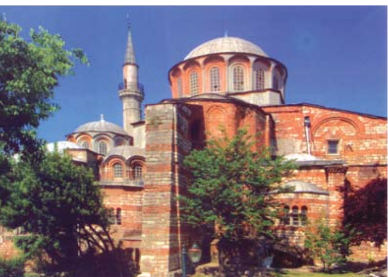
Μονή της Χώρας

Συνεχίσαμε την πορεία μας με επίσκεψη στην Παναγία της Ζωοδόχου Πηγής ή Βαλουκλή. Εδώ βρίσκονται οι τάφοι των Πατριάρχων. Ο χώρος της Παναγίας της Βαλουκλιώτισσας συνδέεται με το γνωστό θρύλο των μισοτηγανισμένων ψαριών, που ζωντάνεψαν και ξεπετάχτηκαν από το τηγάνι και έπεσαν στο νερό, όταν η Πόλη έπεφτε στα χέρια των Τούρκων. Η παράδοση λέγει ότι κάποιος καλόγηρος τηγάνιζε ψάρια κατά την ώρα που έπεφτε η Πόλη. Όταν του φώναξε κάποιος «εάλω η Πόλις» αυτός είπε! «Αν τα ψάρια που τηγανίζω ζωντανέψουν και βγουν από το τηγάνι, τότε θα πιστέψω ότι «εάλω η Πόλις». Και τα ψάρια, πράγματι, πετά-