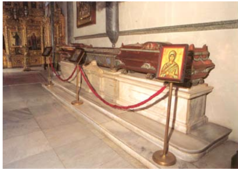
Η Στήλη της Φραγγελώσεως (του Χριστού), ένα από τα ιερότερα κειμήλια της Μεγάλης Εκκλησίας, που φυλάσσεται στον Πατριαρχικό Ναό, μαζί με τα λείψανα των τριών Αγίων γυναικών Θεοφανούς, της Βασιλίσσης, Μεγαλομάρτυρος Ευφημίας και Σολομονής, μητέρας των Επτά Παίδων