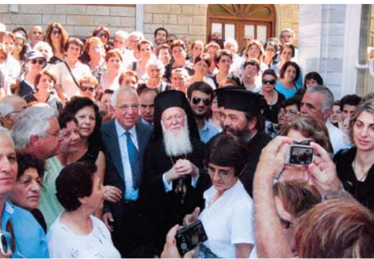
Στιγμιότυπο από την επίδοση της εικόνας της Ελεούσας του Κύκκου στον Παναγιώτατο και Οικουμενικό Πατριάρχη κ.κ. Βαρθολομαίο από τον Πανοσ. Αρχιμ. Στέφανο Κυκκώτη, στο προαύλιο του Πατριαρχικού ναού στο Φανάρι