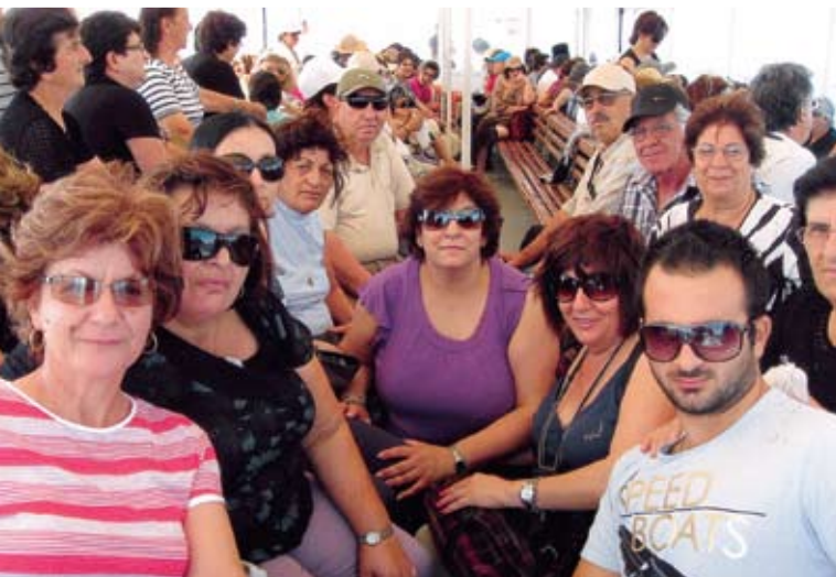
Ασφαλώς στις επισκέψεις μας στα Πριγκιπόνησα μεταφερόμαστε με καράβια