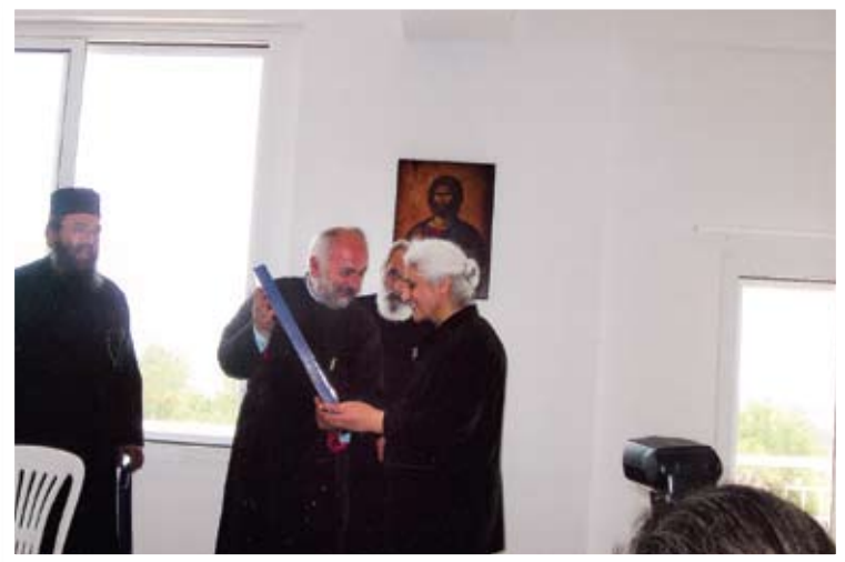
Αναμνηστικό αντίδωρο μια εικόνα της Παναγίας της Ελεούσας του Κύκκου

Αρχιμανδρίτη Θεόφιλο, αδελφές μάς μετέφεραν με μικρά λεωφορεία, που διαθέτει η Αδελφότητα στην τραπεζαρία του ιδρύματος. Εκεί είχαμε την ευκαιρία να απολαύσουμε ένα πλούσιο γεύμα, που με πολλή αγάπη ετοίμασαν οι ίδιες για μας. Κατά τη διάρκεια του γεύματος ο Αρχιμανδρίτης της Ιε-