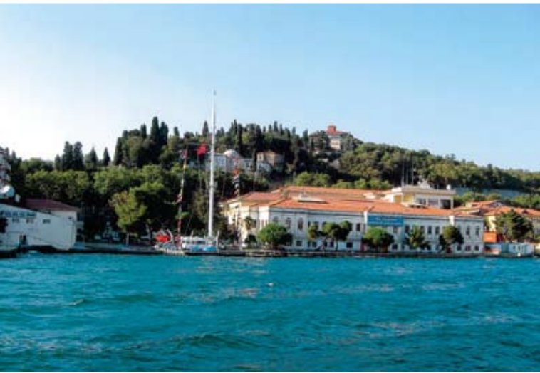
Άποψη της Χάλκης, η οποία είναι η τρίτη στη σειρά μετά την νήσο Πρώτη και την Αντιγόνη