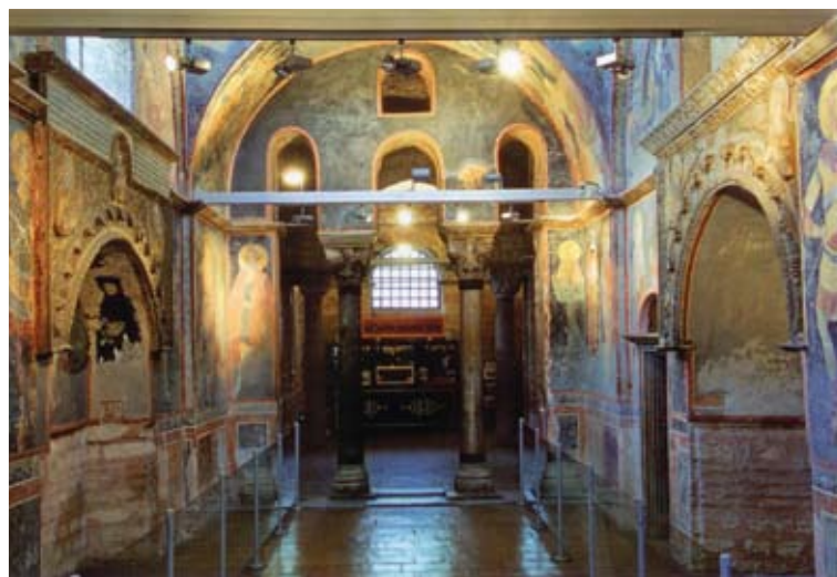
Εσωτερικό του ναού της Μονής της Χώρας

χτηκαν από το τηγάνι και έπεσαν στο νερό για να επιβεβαιωθεί ότι η Πόλη έπεσε.