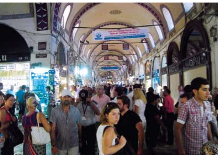
Μια επίσκεψη μας στην κλειστή αγορά

παραθέσεις των πολιτικών μας πάνω στο εθνικό μας πρόβλημα; Αντί της ομόνοιας, της συνεργασίας και της συντονισμένης προσπάθειας οι πολιτικοί μας και στην Κύπρο δυστυχώς υποσκάπτουν ο ένας τον άλλο. Ας αναλογιστούμε και διδαχθούμε επιτέλους ποια μπορεί να είναι η καταστροφή στη μικρή μας ταλαίπωρη πατρίδα ως αποτέλεσμα των συνεχιζόμενων αυτών εμφύλιων συγκρούσεων.