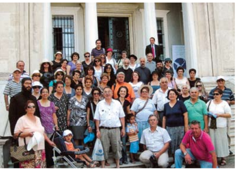
Αναμνηστική φωτογραφία μιας ομάδας των εκδρομέων μας στα προπύλαια της Θεολογικής Σχολής της Χάλκης