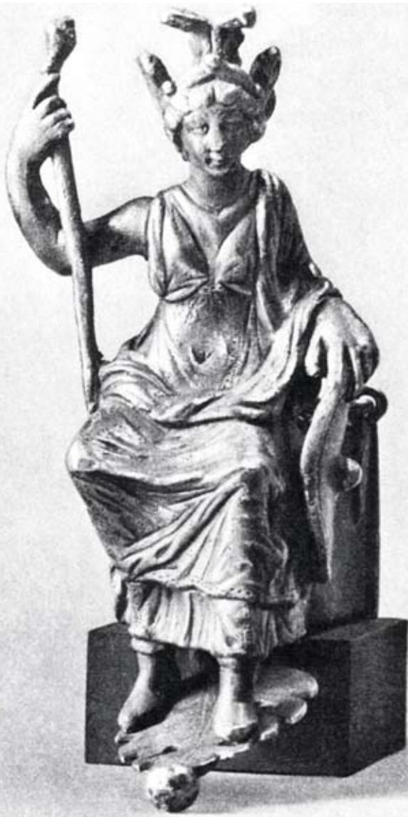
Ο θησαυρός του Esquilin. Το άγαλμα της Πρώμης, Λονδίνο, Βρετανικό Μουσείο

Κωνσταντίνου η χριστιανική θρησκεία αποτέλεσε επίσημη θρησκεία του κράτους και άσκησε επίδραση στον καθορισμό των θρησκευτικών αντιλήψεων του αυτοκράτορα. Σχετικά με το ζήτημα,