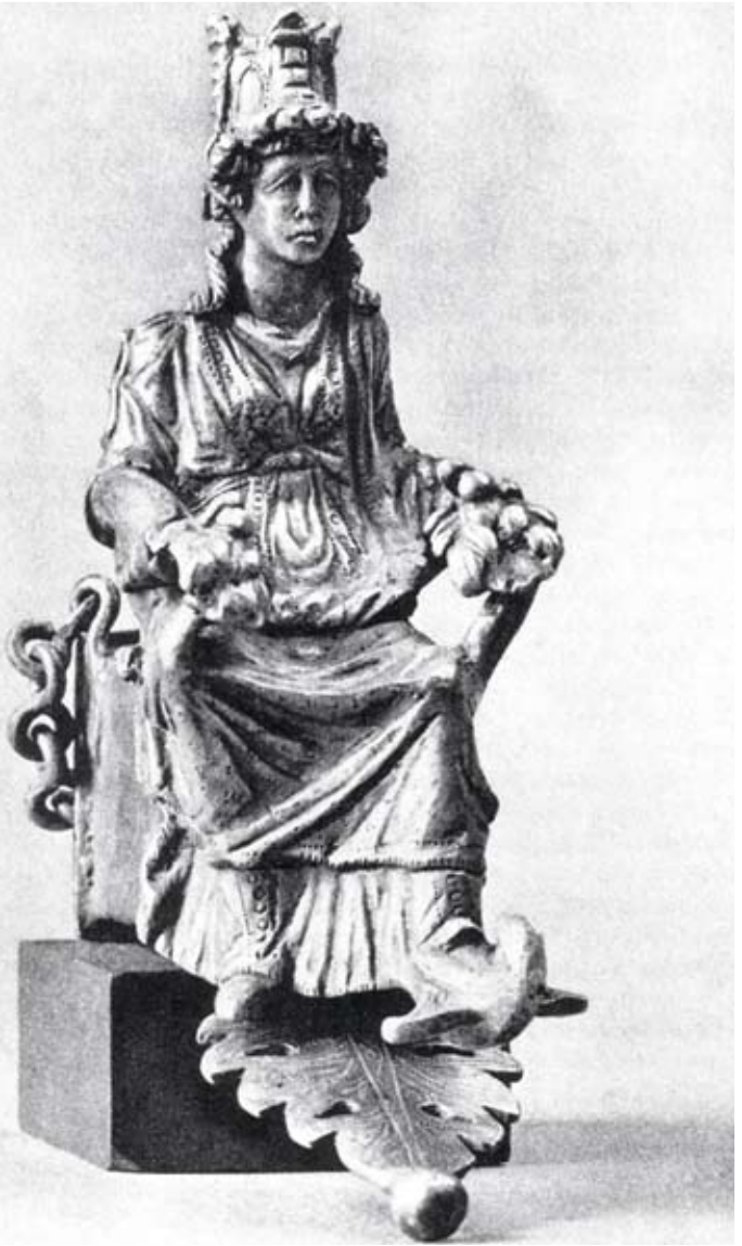
Ο θησαυρός του Esquilin. Το άγαλμα της Αλεξάνδρειας, Λονδίνο, Βρετανικό Μουσείο

Τύχη έφερε πόλο και κέρας Αφθονίας 38 . Ο Franke επισήμανε ότι η Τύχη για τον Αντίλοχο μαζί με τη Μοίρα μοίραζε αγαθά στους ανθρώπους 39 . Ο Αλκμάν ανέφερε επίσης την “Τύχη Ευνομίας τε και Πειθούς αδερφή και Προμαθείας θυγάτηρ” 40 . Σε αυτό το πλαίσιο μπορεί να γίνει αντιληπτή η Τύχη που αναφέρει ο Αλκμάν ως θεά της πόλης. Στο πέρα-