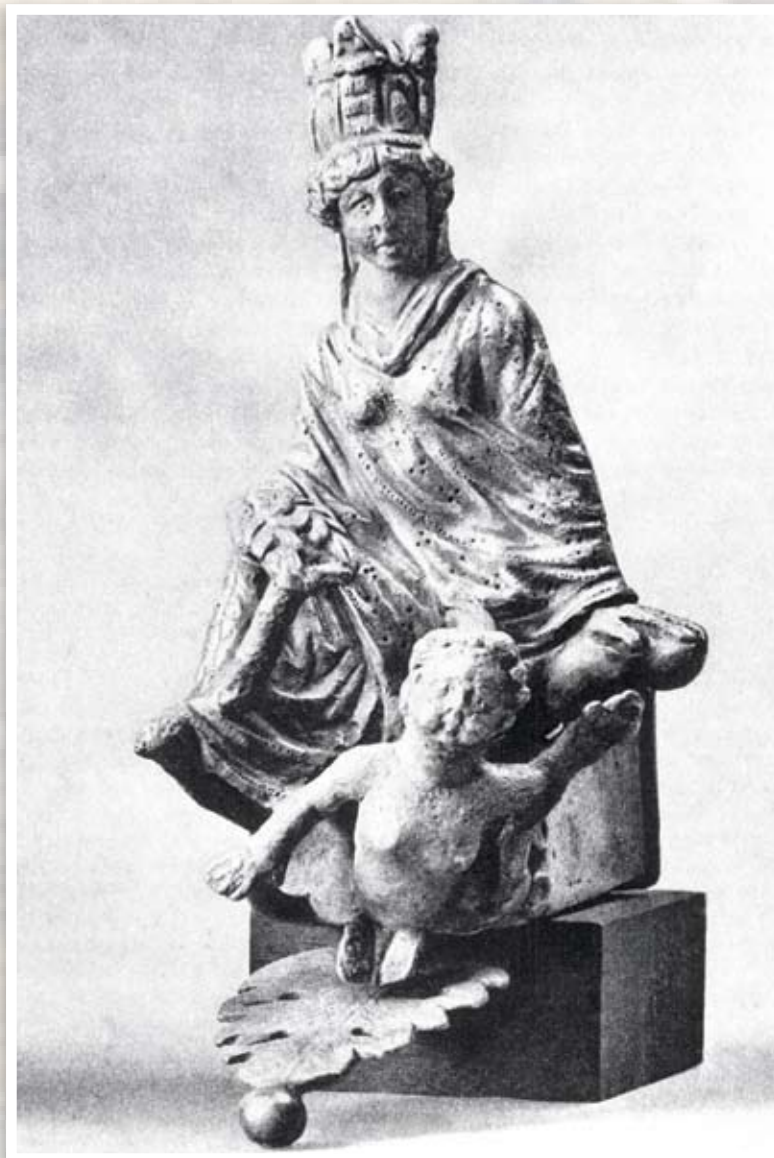
Ο θησαυρός του Esquilin. Το άγαλμα της Αντιόχειας, Λονδίνο, Βρετανικό Μουσείο

Μια αναδρομή στη νομισματική παραγωγή της τετραρχίας επισημαίνει την ανάδειξη των θεών και των ηρώων που αποτελούσαν σημαντικές δυνάμεις. Η αναφορά στον κόσμο των θεών είχε σκοπό να συνδέσει τον αυτοκράτορα με το Δία ή τον Ηρακλή και να εξασφαλίσει την ιδεολογική βάση για την ισχυροποίηση της θέσης του. Ο Δίας για το Διοκλητιανό και ο Ηρακλής για το Μαξιμιανό ήταν οι εγγυητές της αυτοκρατορικής εξουσίας. Χωρίς αμφιβολία η στήριξη αυτής της ιδεολογίας αποσκοπούσε στην απομάκρυνση των σφετεριστών, επειδή μόνο η ένταξη σε μια αυτοκρατορική ή θεϊκή γενιά μπορούσε να εγγυηθεί την πολιτική νομιμότητα 17 . Η pietas απέναντι στους αρχαίους θεούς, οι οποίοι εξασφάλιζαν την ευημερία της αυ-