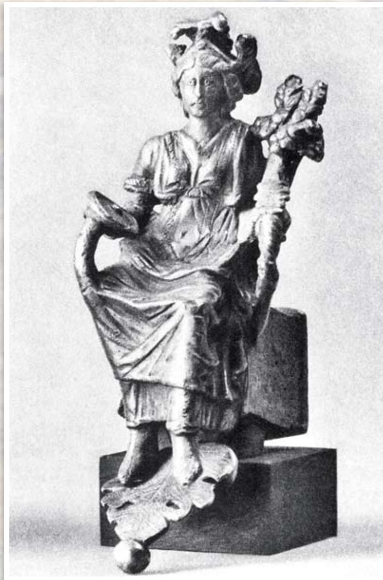
Ο θησαυρός του Esquilin. Το άγαλμα της Κωνσταντινούπολης, Λονδίνο, Βρετανικό Μουσείο

Ο Strzygowski τονίζει την ανάγκη να στραφεί το ενδιαφέρον περισσότερο στην απόδοση του τύπου μιας Τύχης πόλης στην ελληνιστική και ρωμαϊκή περίοδο. Σε σχέση με την Τύχη της Κωνσταντινούπολης συμπληρώνει ότι η νέα χριστιανική πόλη προσωποποιήθηκε ακολουθώντας την ελληνιστική παράδοση 37 . Η Τύχη κάθε πόλης κατείχε στην ελληνιστική περίοδο ιδιαίτερη σημασία, καθώς δεν αποτελούσε μόνο φύλακα της πόλης αλλά συνέβαλε στο καλό και την πρόοδο της. Η λατρεία της Τύχης καθιερώθηκε πριν από την ελληνιστική περίοδο. Το αρχαιότερο άγαλμα μιας Τύχης συναντάται στη Σμύρνη, αποτελεί έργο του Βούβαλου και χρονολογείται τον 6ο αι. π.Χ. Η