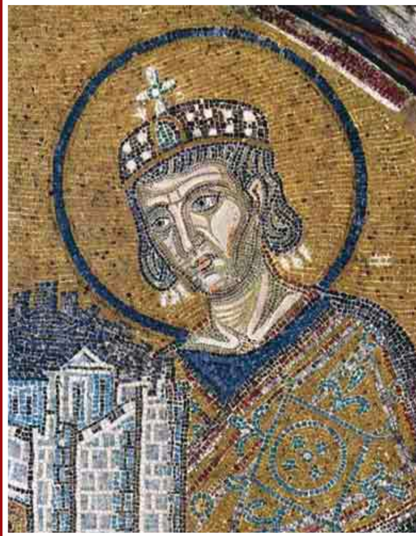
Ο Μεγάλος Κωνσταντίνος με το μοντέλο της πόλης της Κωνσταντινούπολης. Μωσαϊκό στην Αγία Σοφία, 1000 μ.Χ.