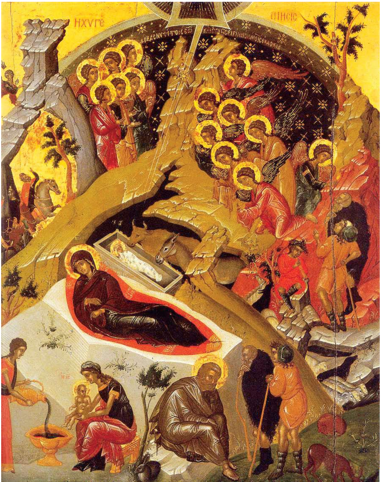
Η Γέννηση του Χριστού (15ου αι.), Ελληνικό Ινστιτούτο Βενετίας