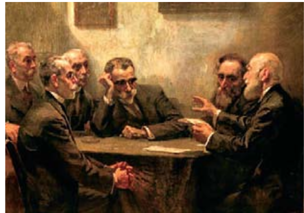
Ο Κωστής Παλαμάς (στο κέντρο) μαζί με άλλους αγαπημένους ποιητές, Δροσίνης, Πολέμης, Σουρής...

Εθνος! Ζήτω ο Ελληνικός λαός!». Κι η αυθεντική περιγραφή των Αγώνων από κείμενα της εποχής, σημειώνει: «Και ήγειρε την δεξιάν. Πάραυτα βροντώδεις εξερράγησαν καθᾶ όλον τον απέραντον χώρον επευφημίας απαντώσαι εις την βασιλικήν επιφώνησιν».