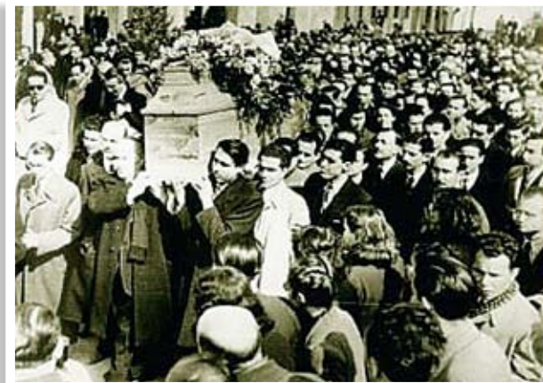
Η κηδεία του Κωστή Παλαμά το 1943 μετατράπηκε σε παλλαϊκό συλλαλητήριο κατά της Γερμανικής κατοχής