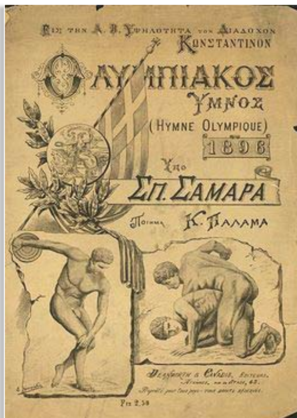
Το εξώφυλλο σε έκδοση του 1896, αφιερωμένο στον Ολυμπιακό Ύμνο του Κωστή Παλαμά και του Σπυρίδωνα Σαμάρα