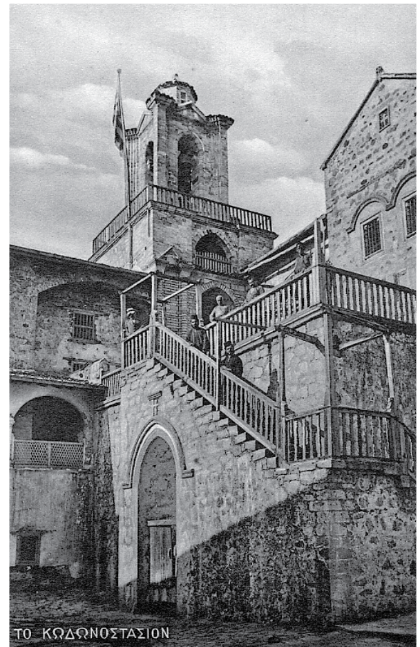
Το κωδωνοστάσιο της Μονής Κύκκου