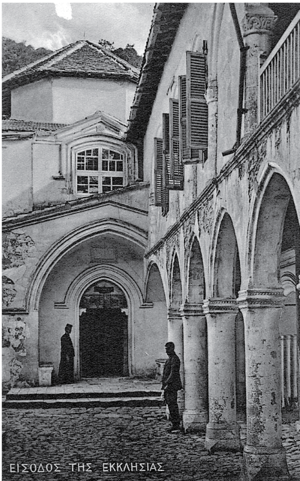
ΕΙΣΟΔΟΣ ΤΗΣ ΕΚΚΛΗΣΙΑΣ