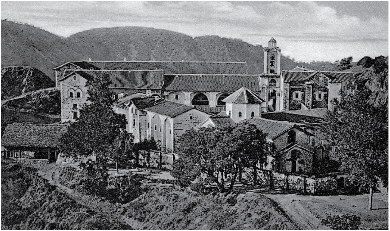
Γενική άποψη της Μονής Κύκκου από δυτικοανατολικά