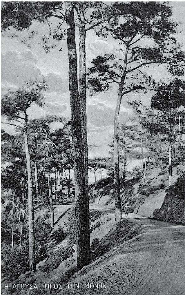
Η ΑΓΟΥΣΑ ΠΡΟΣ ΤΗΝ ΜΟΝΗΝ