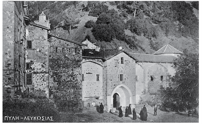
Η ανατολική είσοδος της Μονής γνωστή ως Πύλη Λευκωσίας

Και στον τομέα αυτό η Ιερά Μονή Κύκκου σύμφωνα με τα δεδομένα της τότε εποχής θα πρωτοτυπήσει. Θα αναθέσει στον επτανησιακής καταγωγής φωτογράφο Ιωάννη Φώσκολο, ο οποίος δραστηριοποιείτο στην Κύπρο σαν φωτογράφος και είχε στο ενεργητικό του πλούσια δράση στην κυκλοφορία ταχυδρομικών καρτών, να της εκδώσει ξεχωριστό - ανεξάρτητο βιβλιάριο, το οποίο περιείχε σειρά δώδεκα μαυρόασπρων καρτών με απεικονίσεις σχετικές με τη Μονή Κύκκου, το Καθολικό, την αδελφότητα, τον τότε ηγούμενο Κλεόπα, καθώς και τοπία γύρω από το Μοναστήρι. (Για τον Φώσκολο βλ. Μαλέκος Ανδρέας, J.P.Foscolo, Λευκωσία 1992). Οκτώ από τις δώδεκα φωτογραφίες αποδίδουν το θέμα σε οριζόντια εκτύπωση και οι υπόλοιπες τέσσερις σε κάθετη. Η εικόνα καλύπτει ολόκληρη την πρόσοψη της κάρτας. Η πίσω όψη παραμένει τελείως καθαρή, χωρίς οποιοδήποτε διακριτικό. Έτσι ο χώρος ήταν ολόκληρος στη διάθεση του αποστολέα για τα δικά του γραπτά μηνύματα (ευχές, εντυπώσεις κλπ.). Όλες οι φωτογρα-