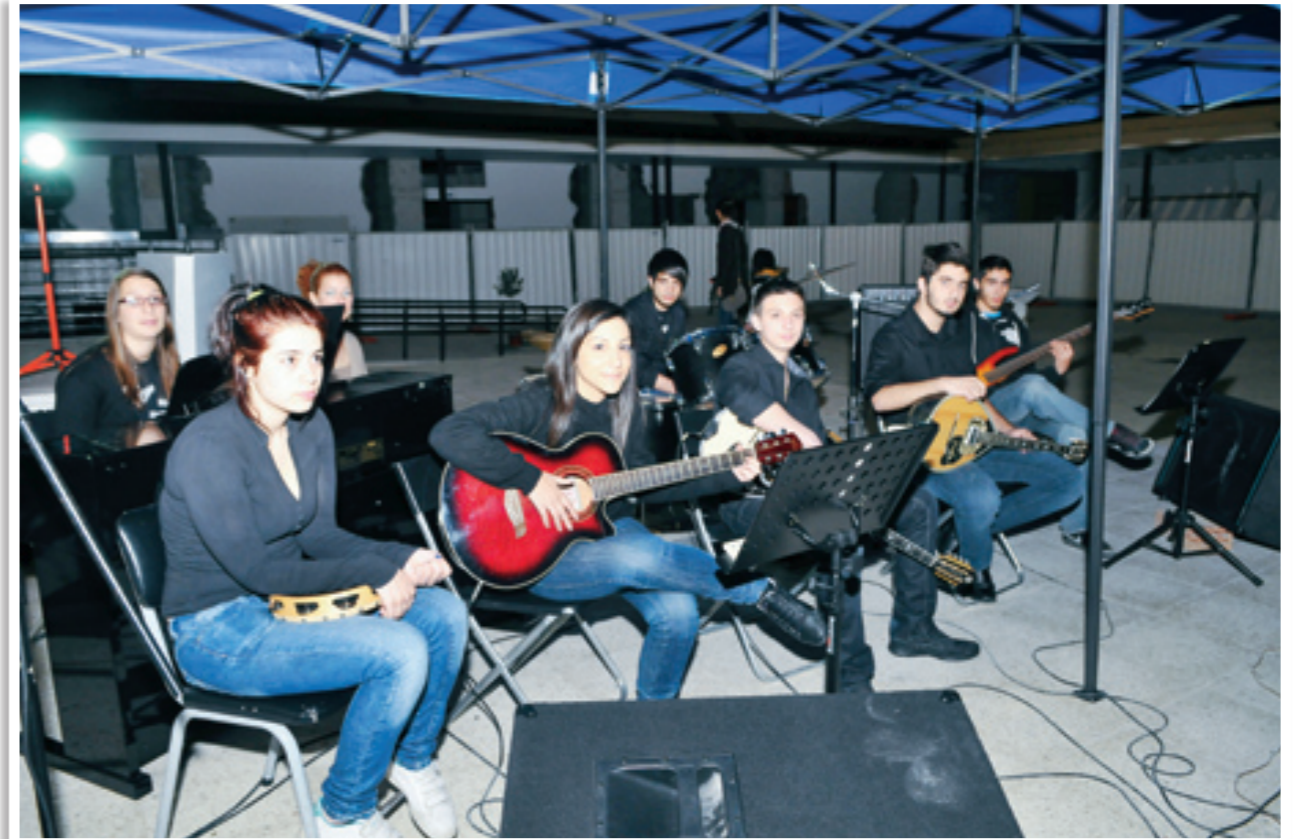
Το πρόγραμμα της τελετής διάνθησε με τραγούδια το μουσικό συγκρότημα του σχολείου