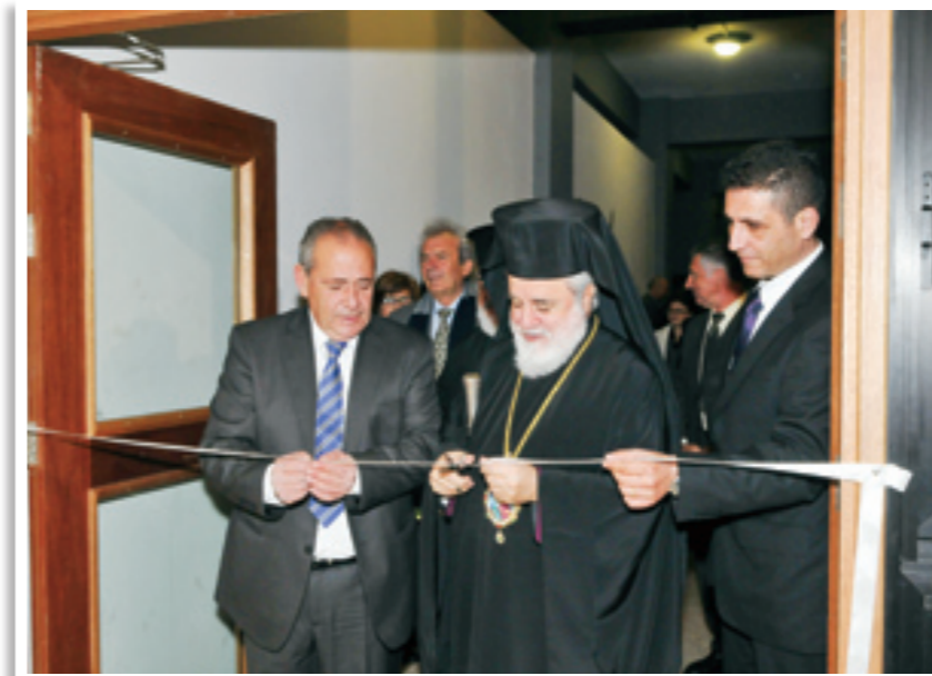
Ακολούθως ο Πανιερώτατος τέλεσε τα εγκαίνια έκθεσης, η οποία περιλάμβανε φωτογραφίες από τη σύνολη ιστορική πορεία και δράση του σχολείου