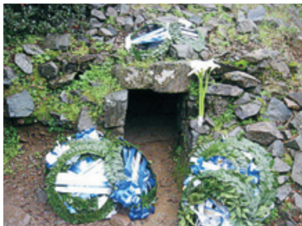
Το κρησφύγετο του ἥρωα στο Μαχαιρᾶ

Ἡ σύναξή μας σήμερα ἐδῶ εἶναι τὸ σωτήριο δρόσισμα, εἶναι ἡ ἀναβάπτιση τῆς ματαιότητάς μας στὸν ἴσκιό ενός μύθου, πού μὲ τὸ κυπαρισσένιο του ἀνάστημα φυλάει ἀκόμην ἀκοίμητος τίς ὥρες.