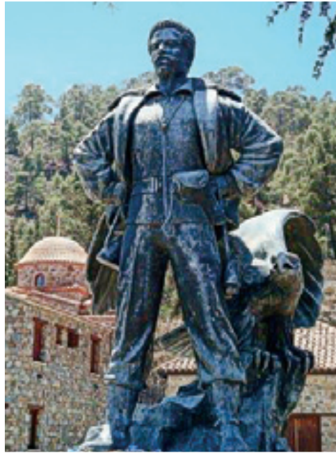
Το άγαλμα του Γρηγόρη Αυξεντίου στην Ιερά Μονή Μαχαιρά