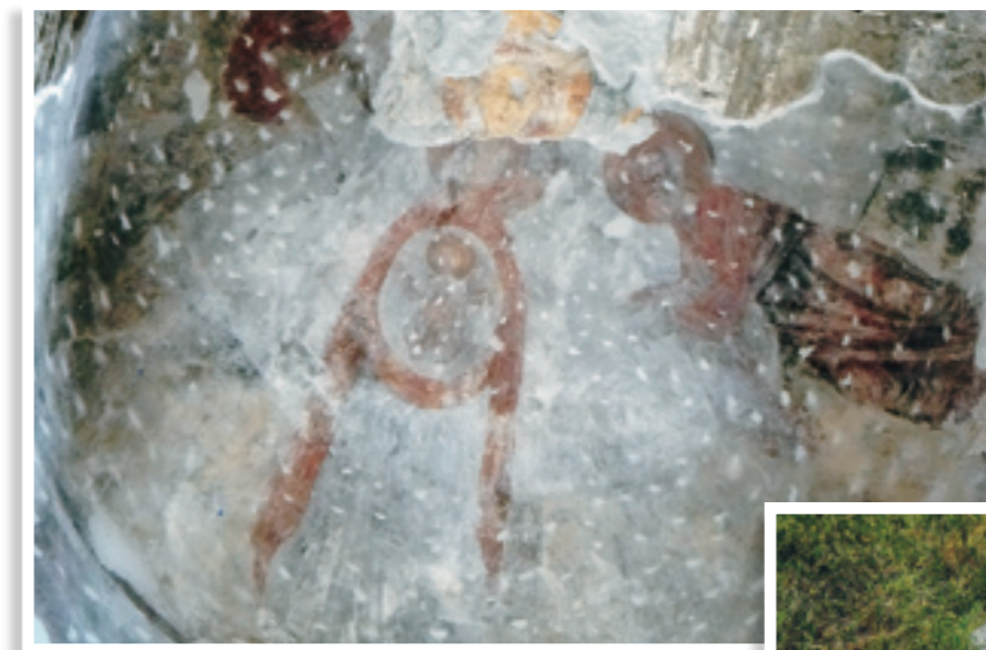
Τοιχογραφία της Παναγίας στην αυίδα του ιερού

Ο ναός είναι κτισμένος στην τοπική παραδοσιακή ναϊκή αρχιτεκτονική. Και ανήκει, βέβαια, στην Παναγία. Μικρός σε διαστάσεις, τρίκλιτος, κοσμημένος με τοιχογραφίες. Οι τοιχογραφίες, που ήδη συντηρούνται, έχουν υποστεί μεγάλη φθορά. Φαίνεται μάλιστα να είχαν κάποτε καλυφθεί με κονίαμα, όπως φανερώνουν σκαψίματα πάνω σ'