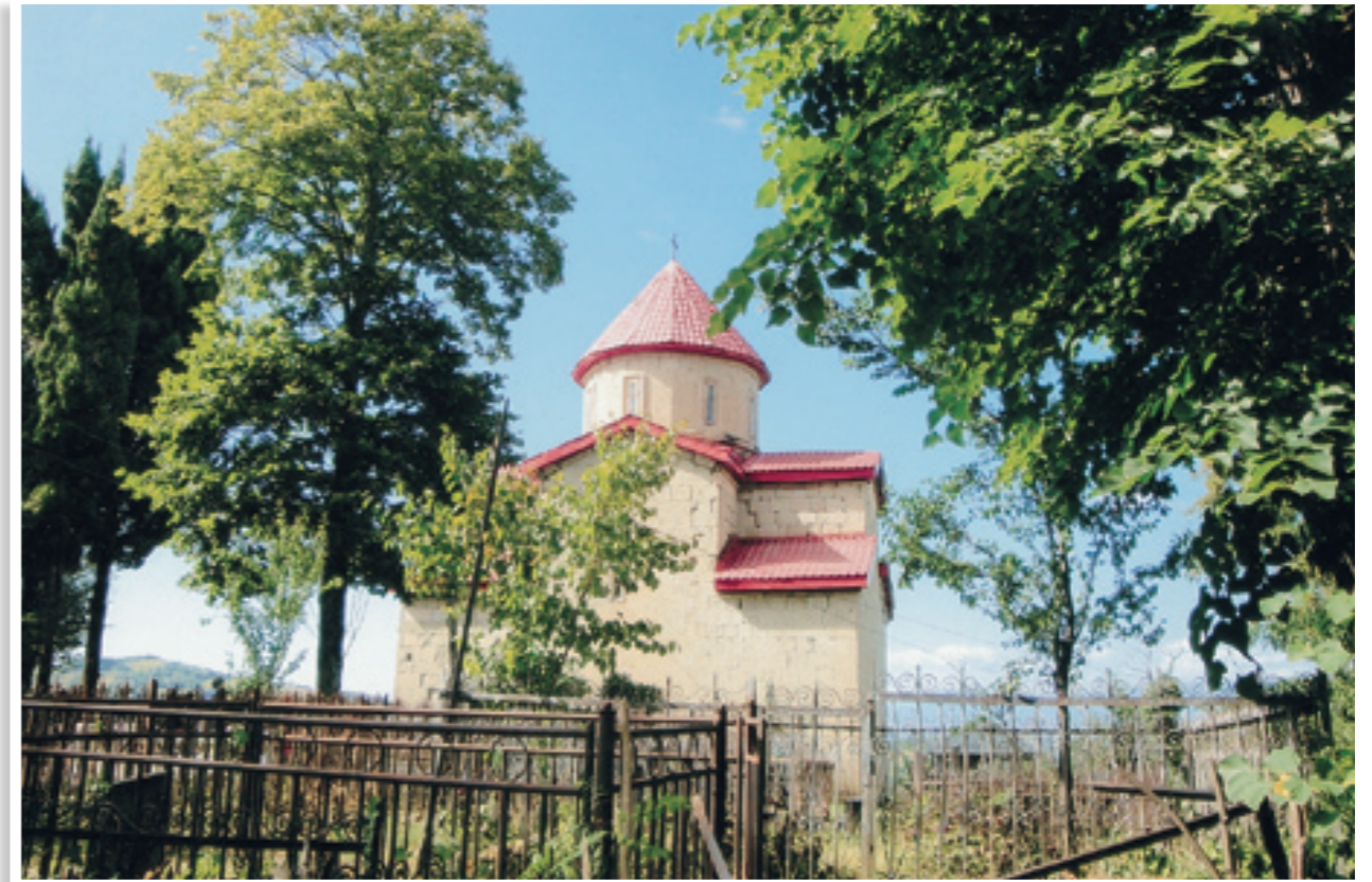
Ο ναός του Μετοχίου, αφιερωμένος στην Παναγία

Ξεκινήσαμε από την πόλη Ακχαλτσίκχε της νοτιοδυτικής Γεωργίας, περάσαμε στην επαρχία