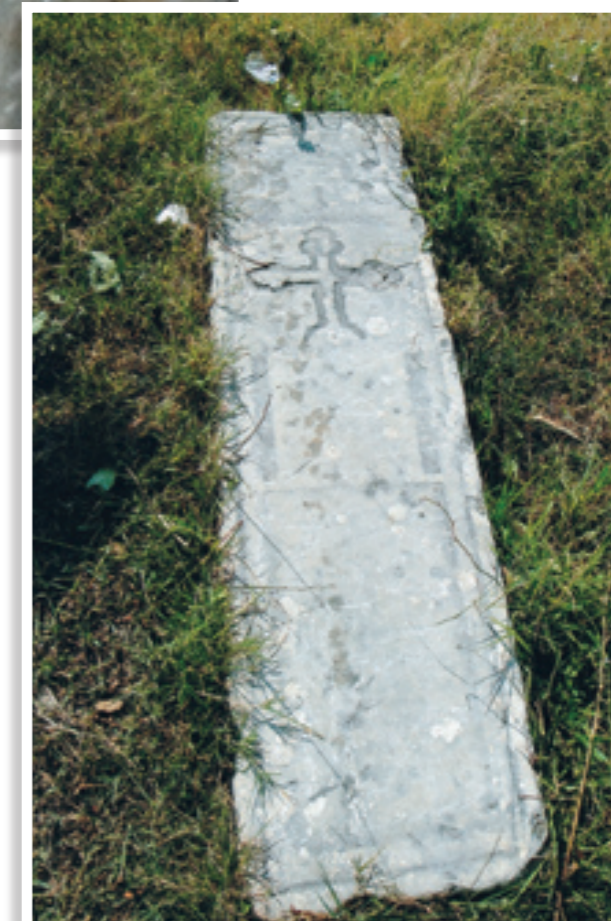
Τάφος άγνωστου Κυκκώτη μοναχού στον περίβολο του ναού

αυτές, σκαψίματα για να στερεωνόταν το κονίαμα με το οποίο είχαν καλυφθεί. Από το εικονοστάσι απουσιάζουν μερικές εικόνες, εκ των οποίων κάποιες βρίσκονται υπό συντήρηση.