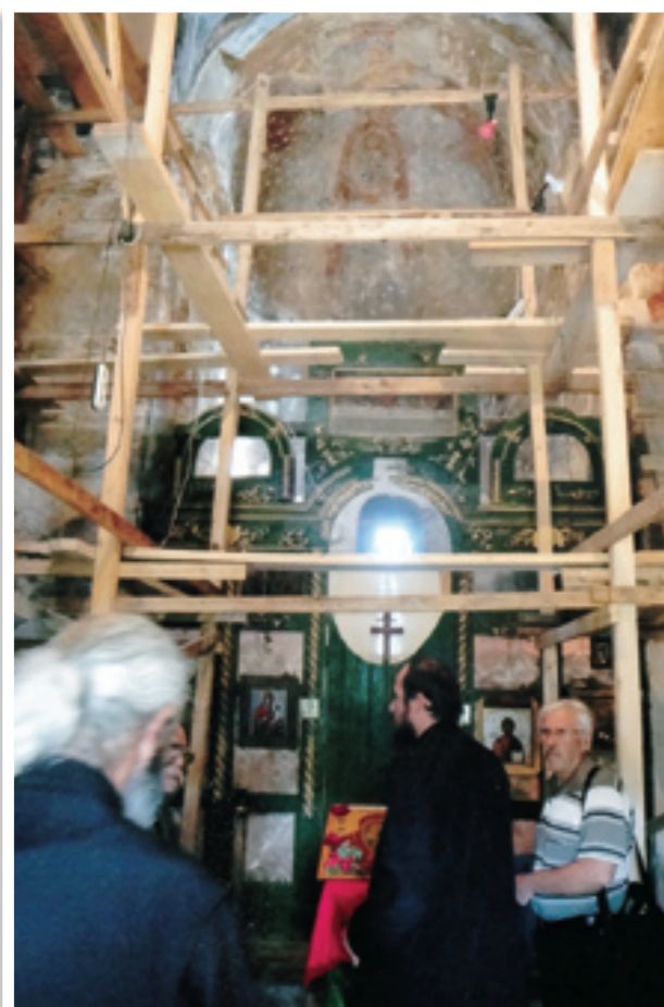
Εσωτερικό του ναού

Το μοναστήρι του Κύκκου αναφέρεται ότι έστειλε στο μετόχι της Γεωργίας μοναχούς για 5ετή υπηρεσία. Οι 5 που δεν επέστρεψαν ποτέ και ετάφησαν εδώ, σε άγνωστους χρόνους, ήσαν μερικοί μόνο από όσους είχαν έλθει και υπηρετήσει σε τούτο το μετόχι. Το οποίο, μαζί και με τα άλλα εκτός Κύπρου μετόχια της Μονής Κύκκου, συνέβαλε στο να κρατηθεί στη ζωή το μοναστήρι. Και