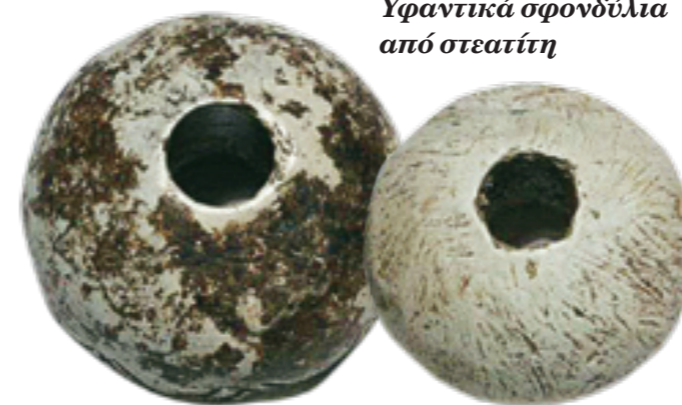
Υφαντικά σφονδύλια από στεατίτη

Η κεραμική, που έχει συγκεντρωθεί, μπορεί να χωριστεί σε δύο γενικές κατηγορίες: σε