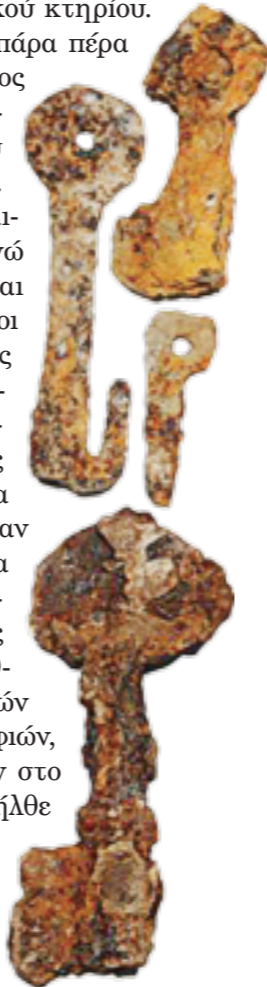
Διάφοροι τύποι κλειδιών

Σημαντικές ποσότητες οστών από ζώα και πτηνά, καθώς και θαλασσινά κοχύλια, περισυνελέγησαν, και παραπέμπουν κυρίως στο διαιτολόγιο των ενοίκων του χώρου. Η κεραμική, που έχει συγκεντρωθεί, μπορεί να χωριστεί σε δύο γενικές κατηγορίες: σε