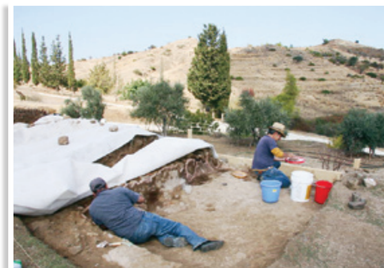
Εργασίες στερέωσης κονιαμάτων από τους συντηρητές των Εργαστηρίων του Μουσείου της Μονής Κύκκου

στον ίδιο άξονα αποκαλύφθηκαν άλλα δύο δωμάτια, δομημένα με ακατέργαστους ηφαιστειογενείς λίθους και σπαράγματα από δομικά υλικά σε δεύτερη χρήση, προερχόμενα από την ανατολική μάλλον πτέρυγα. Την ίδια δόμηση παρουσιάζουν και