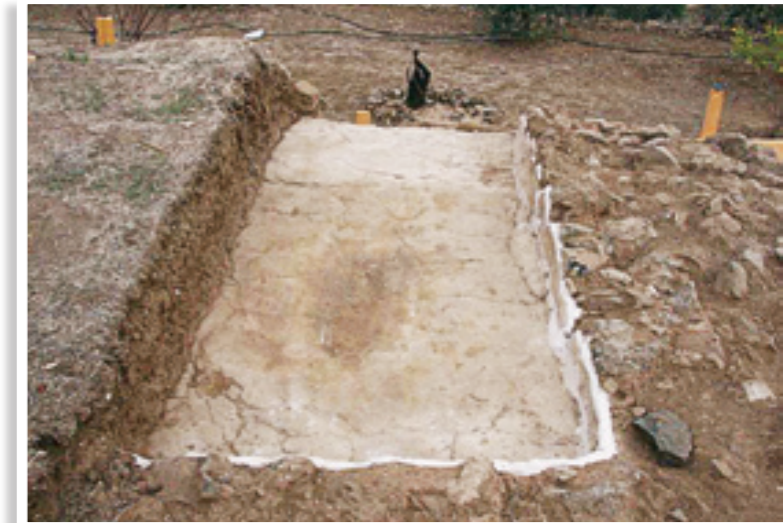
Τμήμα δαπέδου και κονιάματος τοίχων στο βόρειο μέρος της ανασκαφής