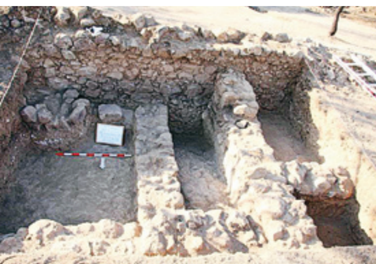
Αρχιτεκτονικά κατάλοιπα σε τομή στο νότιο μέρος της ανασκαφής

τα κτηριακά κατάλοιπα του ανώτερου στρώματος, που καλύπτουν σχεδόν όλη τη δυτική πλευρά του συγκροτήματος, παρά την εκτενέστερη φθορά, που υπέστησαν. Σε κατώτερο επίπεδο είναι εμφανής παλαιότερη δομική φάση με πιο πλατιούς τοίχους, οι οποίοι απαρτίζονται από ανάμεικτους ορθογωνισμένους ψαμμιτόλιθους και ηφαιστειογενείς λίθους, συγκρατημένους με ασβεστοκονίαμα. Περαιτέρω διερεύνηση του σημείου αυτού θα διαλευκάνει την όλη αρχιτεκτονική του σύνθεσης.