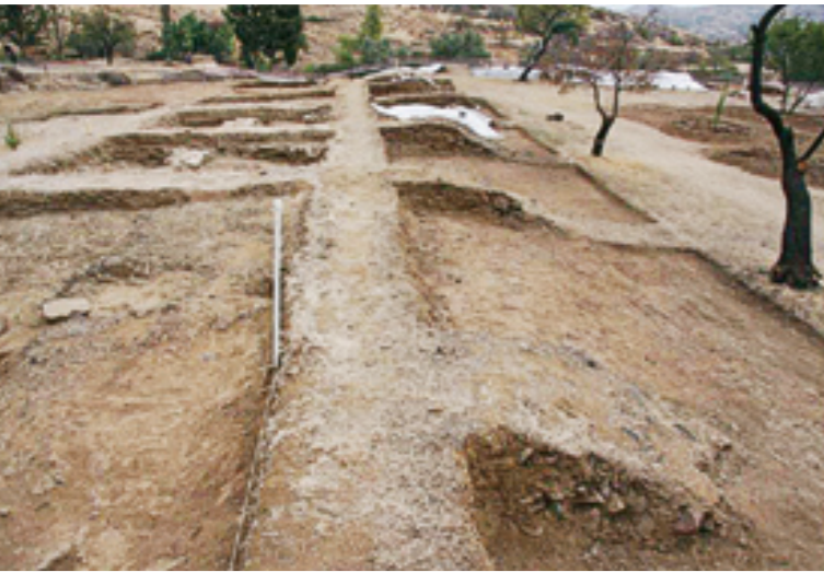
Γενική άποψη του ανασκαμμένου χώρου στα δυτικά