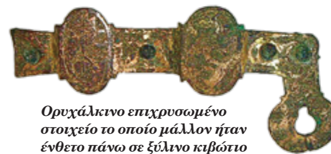
Ορυχάλκινο επιχρυσωμένο στοιχείο το οποίο μάλλον ήταν ένθετο πάνω σε ξύλινο κιβώτιο

Ταυτόχρονα με την ανασκαφή διενεργήθηκε προληπτική συντήρηση των ερειπίων από συνερ-