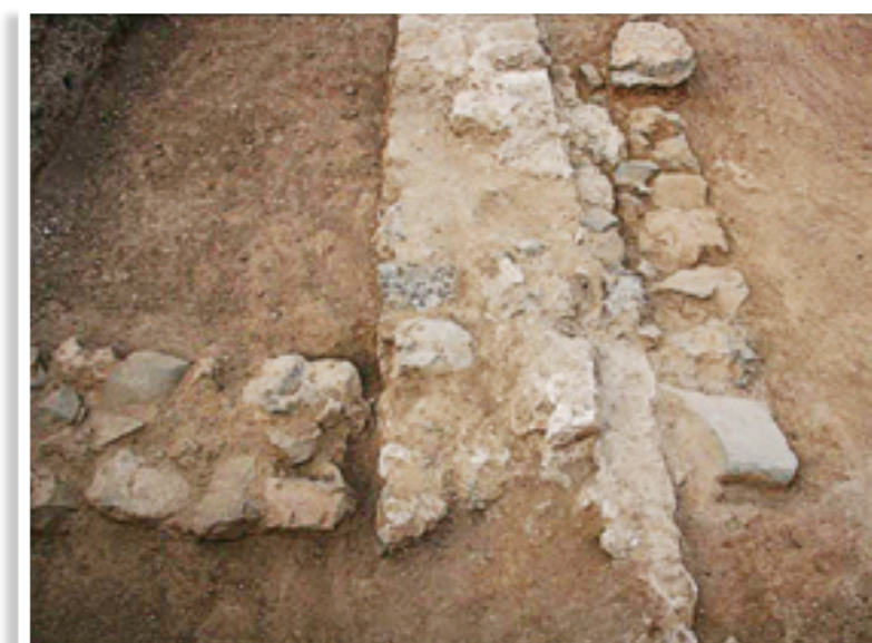
Παλαιότερα αρχιτεκτονικά κατάλοιπα πάνω από τα οποία διέρχεται νεότερος τοίχος (οριζόντια) δομημένος με ψαμμιτόλιθους

γείο των Εργαστηρίων Συντηρήσεως του Μουσείου Κύκκου. Παράλληλα άρχισε η σταδιακή διαμόρφωση του χώρου με περιποίηση και ενίσχυση της υφιστάμενης βλάστησης.