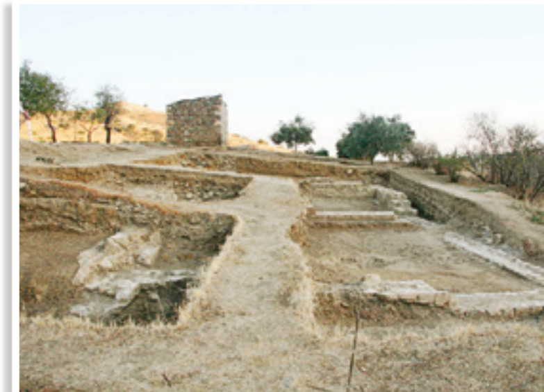
Γενική όψη του ανατολικού μέρους της ανασκαφής