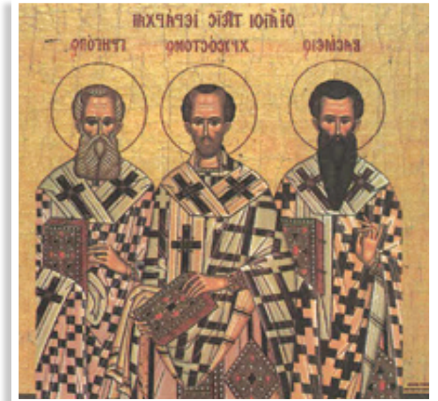
Οι Τρεις Ιεράρχες

Η ελληνική σκέψη, με τους εκλεκτούς εκπροσώπους της και με επικεφαλής τον Πλάτωνα ασκεί και προπαρασκευάζει τον χριστιανό υποψήφιο προς την αλήθεια. Έτσι, τα πολύτιμα σπέρματα των Εθνικών, όπως τα αποκαλούσε ο Ιουστίνος συνταιριάζονται και εναρμονίζονται