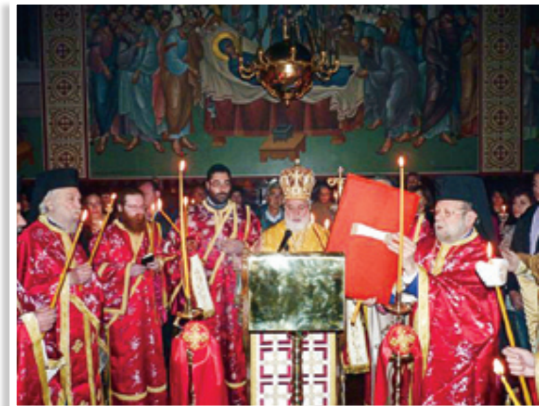
Ο Πανιερώτατος, κατά την Πασχαλινή Ακολουθία, περιστοιχιζόταν από τους Πατέρες της Μονής, οι οποίοι και πήραν μέρος στην Αναστάσιμη θεία Λειτουργία.