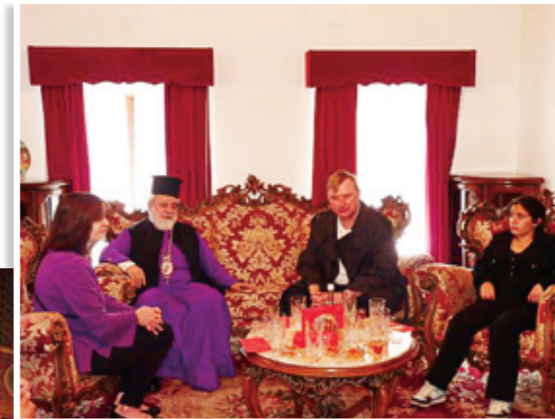
Ο Πανιερώτατος Μητροπολίτης μας κ.κ. Νικηφόρος σε μια φιλοφρονητική συνάντηση με τον Πρέσβη των ΗΠΑ και την οικογένειά του στο Συνοδικό της Μονής