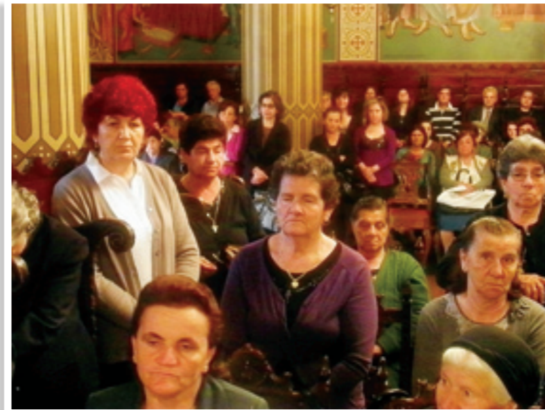
Τα μέλη των Συνδέσμων συμμετείχαν το πρωί της Κυριακής στη θεία Λειτουργία, της οποίας προέστη ο Πανιερώτατος Μητροπολίτης μας κ.κ. Νικηφόρος, συμπαραστατούμενος από Πατέρες της Μονής.