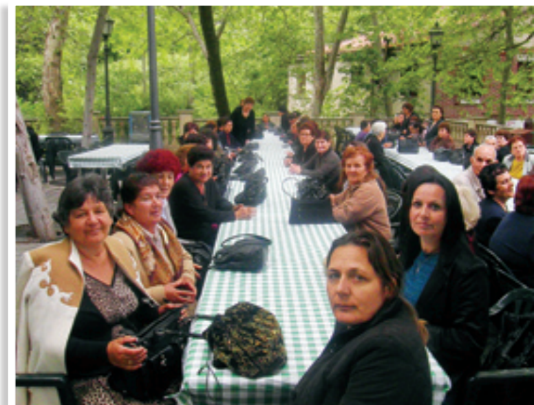
Μετά το πέρας της θείας Λειτουργίας, ακολούθησε κοινό πρόγευμα στη Μονή και στη συνέχεια τα μέλη των Συνδέσμων μετέβησαν στο χωριό Κάμπος, όπου μέσα σε ένα ειδυλλιακό τοπίο παρακάθισαν σε κοινό γεύμα, που προσέφερε η Ιερά Μονή Κύκκου.