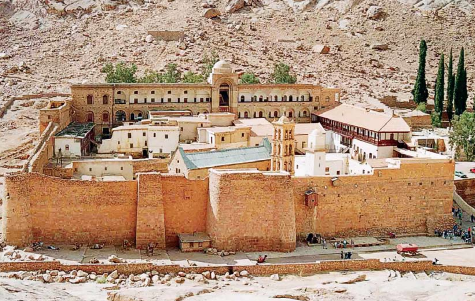
Ἡ Ἱερά Μονή Ἀγίας Αἰκατερίνης-Σινᾶ