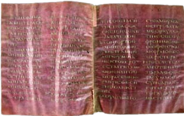
νη, 1 στο Βυζαντινὸ Μουσείο Ἀθηνῶν, 1 στο Βυζαντικὸ Μουσείο Θεσσαλονίκης καὶ 1 στὴ Νέα Ὑόρκη).