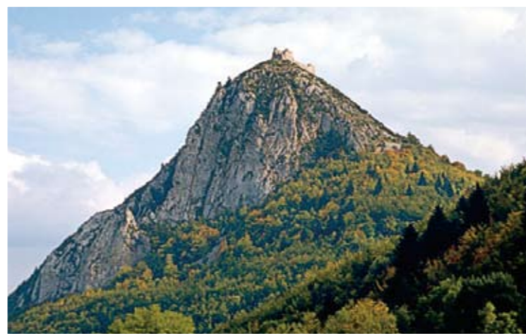
Το οχυρό των Καθάρων Montségur

Το οχυρό Montségur υπήρξε το τελευταίο καταφύγιο των αιρετικών, ιδιαίτερα αυτών που είχαν υψηλές κοινωνικές θέσεις, και σταδιακά έγινε το