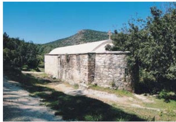
Ο ναός του Αγίου Μηνά, ένα των ξωκλησιών του Ακάμα

Τα εγκαταλειμμένα είτε για τον ένα λόγο είτε για τον άλλο χωριά, σταδιακά εξαφανίζονταν καθώς οι άνθρωποι αφαιρούσαν από αυτά κάθε οικοδομικό ή άλλο υλικό, για χρήση αλλού. Το μόνο που απέμενε τελικά ήταν η εκκλησία, αφού η πίστη των ανθρώπων δεν τους επέτρεπε να τη χαλάσουν κι αυτή για να πάρουν και εκείνης τα υλικά, αντίθετα τη συντηρούσαν όσο τους ήταν δυνατό. Έτσι παρέμειναν στο τέλος πολλοί ναοί, σε ολόκληρο το νησί, μόνοι σε έρημα μέρη. Σε αρκετές