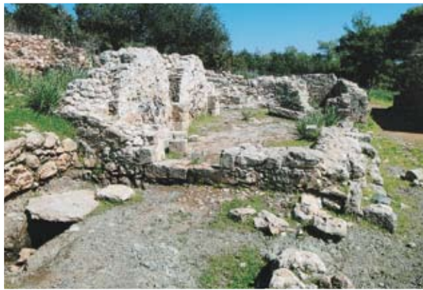
Ο ερειπωμένος ναός του άλλοτε μοναστηριού, γνωστού ως «Πύργος της Ρήγαινας»

Το όλο οικοδομικό σύμπλεγμα, κτισμένο με πέτρινους χοντρούς τοίχους, είχε σχήμα ορθογώνιο με πτέρυγες σε όλες τις πλευρές, κάποιες διώροφες. Στο μέσον της εσωτερικής αυλής βρισκόταν ο μικρός ναός, μονόκλιτος, με μικρή αψίδα και εσωτερικές διαστάσεις περίπου 6Χ3 μέτρα. Σε μερικά σημεία διακρίνονται ίχνη τοιχογραφιών. Το μοναστήρι αυτό είχε ιδρυθεί τον 11ο ή 12ο αιώνα, περίοδο ακμής του μοναχισμού στην Κύπρο και