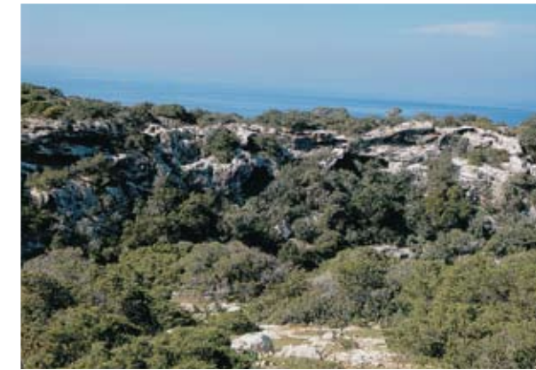
Λαξευμένα σπήλαια ερημιτών στο φαράγγι του ρυακιού των Θεορακείων

Πάντως ανατολικότερα, στην κοντινή τοποθεσία Μάα, έχει ανασκαφεί μικρός οχυρωμένος οικισμός του 13ου – 12ου π.Χ. αιώνα, της περιόδου δηλαδή του ελληνικού εποίκισμού. Αλλά και στην περιοχή της Λάρας (περί το 1 χλμ. από την ακτή) η επιφανειακή εξέταση δείχνει σαφώς την ύπαρξη αρχαιολογικού χώρου. Εξάλλου και στον κοντινό