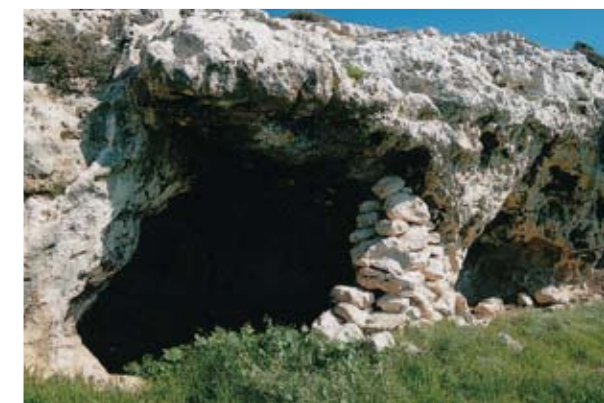
Σπήλαια ερημιτών επί λόφου ανατολικά του μοναστηριού του Αγίου Κόνωνος

Κατά τα Βυζαντινά χρόνια στον Ακάμα υπήρχε ένας τουλάχιστον κύριος οικισμός με την ονομασία Αρά. Με την αυτή ονομασία σημειώνεται σε παλαιούς χάρτες και οικισμός βόρεια της Λευκωσίας. Κατά την περίοδο της Φραγκοκρατίας η Αρά του Ακάμα, με την προσθήκη του γαλλικού άρθρου, έγινε Λάρα, γνωστή πανέμορφη τοποθεσία που φέρει και σήμερα το όνομα αυτό. Στην αμμώδη ακτή της γεννούν χελώνες. Η Αρά αναφέρεται ως χωριό από τον ιερωμένο Άντζελο Καλλέπιο που υπήρξε αυτόπτης μάρτυρας του πολέμου του 1570 και της κατάληψης της Κύπρου από τους Οθωμανούς. Αναφέρει συγκεκριμένα ότι στο χωριό Λάρα είχαν πλησιάσει, στις 20 Ιουνίου 1570, 6