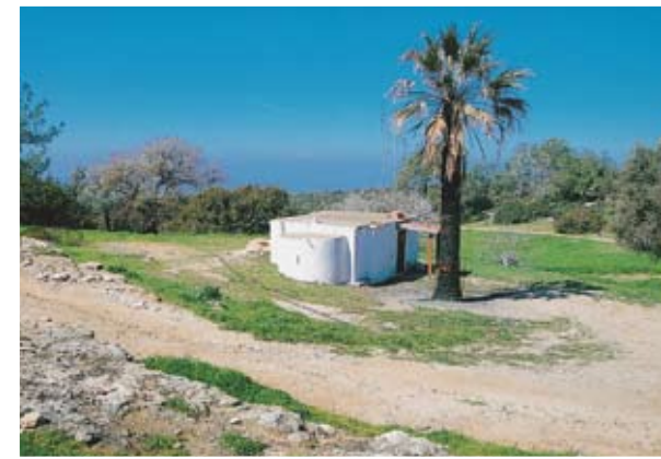
Ο σημερινός ναός στην τοποθεσία όπου άκμασε το μοναστήρι του Αγίου Κόνωνος

και οι ναοί σε τέτοιες περιπτώσεις ήταν λαξευμένοι στους βράχους και μπορούμε να κάνουμε λόγο για πολύ μικρά τρωγλοδυτικά μοναστήρια, όπως εκείνο της Παναγίας Στάζουσας πάνω από το χωριό Καραβάς και εκείνο σε γκρεμό στον κόλπο της Επισκοπής (Λεμεσού). Αλλά σε κάποιες περιπτώσεις τα λαξευμένα κελιά των ερημιτών πιθανώς να συνδέονταν με κοντινά μοναστήρια, όπως στην περίπτωση των κελιών ανατολικά του μοναστηριού του Αγίου Κόνωνος. Στην περίπτωση αυτή έχουμε ερημίτες που όμως υπάγονταν σε κάποιο μοναστήρι, όπως και στο Άγιο Όρος, στο Σινά και αλλού. Δεν ημπορεί ακόμη να αποκλειστεί η πιθανότητα ερημίτες του Ακάμα να είχαν διαβίσει και σε προϋπήρξαντες αρχαίους λαξευτούς τάφους που τους μετέτρεψαν σε ασκητήρια, όπως είναι γνωστό ότι είχε συμβεί σε άλλες περιπτώσεις (λ.χ. Ελληνόσπηλιο κοντά στην Πάφο, τάφοι στην ακτή του Αγίου Γεωργίου Πέγειας, ασκητήριο Αγίας