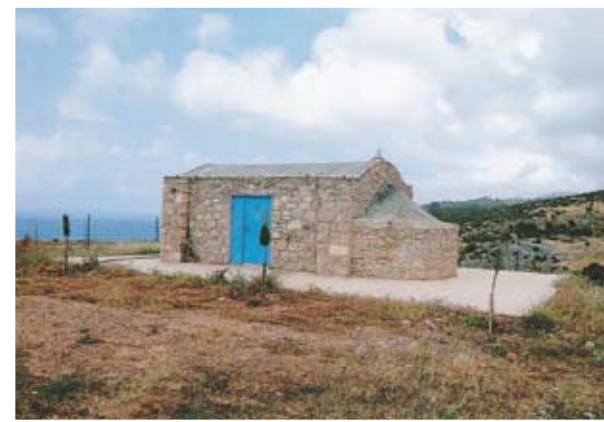
Ο μικρός ναός της Παναγίας του Βλού, σε δυσπρόσιτη περιοχή του Ακάμα

Πάντως η διαβίωση ερημιτών στον Ακάμα ήταν ήδη παλαιά ανάμνηση κατά τον 18ο αιώνα. Επί του προκειμένου, ενδιαφέρουσα είναι και μία αναφορά του Ρώσου μοναχού Βασιλείου Μπάρσκι που είχε περιηγηθεί τα μοναστήρια της Κύπρου. Στην εκτενέστερη των περιηγήσεών του, κατά το έτος 1735, ο Μπάρσκι γράφει ότι είχε πάει και στον Ακάμα μαζί με μοναχούς από τη μονή της Παναγίας των Ζαλακίων, κοντά στην Πέγεια. Είχε δει τότε και την εκκλησία του Αγίου Γεωργίου στον Ακάμα που ήταν, λέει, εξάρτημα της μονής. Ίσως να επρόκειτο για την εκκλησία του Αγίου Γεωργίου που βρίσκεται λίγο περισσότερο από ένα χιλιόμετρο βορειοδυτικά εκείνης του Αγίου Κόνωνος. Δεν αναφέρει όμως αυτό τούτο τον Άγιο Κόνωνα, που φαίνεται να ήταν ήδη από τότε ερειπωμένος και εγκαταλειμμένος, ένα και μισό αιώνα πριν τον δει ο επισκέπτης Hogarth.