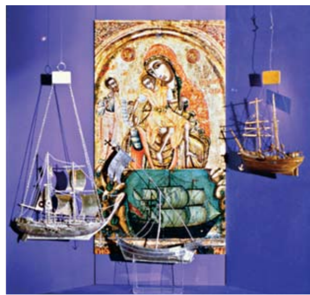
Προθήκη με θέμα « Η Παναγία του Κύκκου και η θάλασσα»

μπληρωματικές μέθοδοι έρευνας αποτελούνται από μικρές συνεντεύξεις επισκεπτών του Μουσείου, λεπτομερείς συνομιλίες με τον διευθυντή του Μουσείου και με τον επί τόπου διευθύνοντα του Μουσείου και την εξέταση των γραπτών μηνυμάτων των επισκεπτών στα βιβλία επισκεπτών.