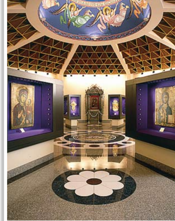
Γενική άποψη της αίθουσας 3

Επομένως, το τοπίο του Μουσείου του Κύκκου με το μοναστήρι του Κύκκου και το άγαλμα του Αρχιεπισκόπου Μακαρίου Γ' γίνεται ταυτόχρονα το μέσο ταύτισης είτε με την εθνική-Ελληνοκεντρική ταυτότητα είτε με την εδαφική-Κυπριοκεντρική ταυτότητα και η απεικόνιση της «διπλής ταυτότητας» σε υλική μορφή. Παρόλο που αυτοί οι χώροι αντιπροσωπεύουν την «διπλή ταυτότητα» της Κύπρου, μια εθνική κοινότητα δημιουργείται η οποία αποκλείει τις άλλες κοινότητες που διαμένουν στο νησί. Τέλος αυτό το τοπίο πλαισιώνει την Ελληνοκυπριακή εθνική ταυτότητα με Ορθόδοξους θρησκευτικούς όρους που αποτελούν τον συνδετικό κρίκο της «διπλής ταυτότητας» καθώς είναι ζωτικό μέρος της αυτό-ταυτοποίησης των Ελληνοκυπρίων. ■