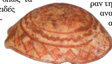
Φιάλη της λευκής γραπτής κεραμικής. Μέση εποχή του χαλκού

Η πιο πάνω σύντομη παρουσίαση του περιεχομένου του ανασκαμμένου τάφου στον Πύργο Τηλλυρίας δείχνει το εύρος του υλικού, που παραπέμπει σε ανθρώπινες δραστηριότητες στην εποχή του Χαλκού. Μας υποβοηθεί να αποκτήσουμε ένα απειροελάχιστο τμήμα από την χαμένη πραγματικότητα. Καταρχάς εντάσσει και επίσημα την περιοχή στην πιο πάνω εποχή. Η Τηλλυρία, όχι μόνο είναι κατοικημένη, αλλά φαίνεται ότι έχει επαφές και ανταλλαγές, τόσο με το υπόλοιπο νησί, όσο και με τον ευρύτερο χώρο της ανατολικής μεσογειακής λεκάνης, αφού προϊόντα εμπορίου, όπως τα μυκηναϊκά αγγεία και το ατρακτοειδές αγγείο, βρέθηκαν στον παρουσιαζόμενο τάφο. Ας σημειωθεί ότι η περιοχή Τηλλυρίας γειτνιάζει με την οροσειρά του Τροόδου, όπου υπάρχουν σημαντικά κοιτάσματα χαλκού και εκτεταμένα δάση, δύο βασικότετοι παράγοντες που συνέβαλλαν στην ανάπτυξη στην υπό αναφορά εποχή,