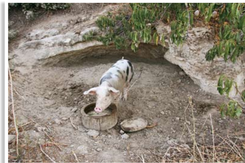
Αρχαίος τάφος ο οποίος χρησιμοποιείται για εκτροφή χοίρου

Ο τάφος ήταν διαταραγμένος από παλαιότερη εποχή και πλήρης χώματος, οστά και θρυμματισμένα αγγεία ήταν αναμειγμένα σε διάφορα επίπεδα, σε άτακτη διασπορά. Ως προς την αρχιτεκτονική εντάσσεται στην κατηγορία των λαξευτών θαλαμοειδών τάφων, τον πιο διαδεδομένο τύπο, που συναντούμε στον κυπριακό χώρο την εποχή του χαλκού. Ο δρόμος και η είσοδος του τάφου καταστράφηκαν από τον εκσκαφέα. Μέσα στα απομακρυνθέντα χώματα εντοπίστηκε μονολιθική