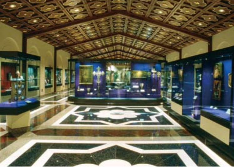
Γενική άποψη της αίθουσας 2