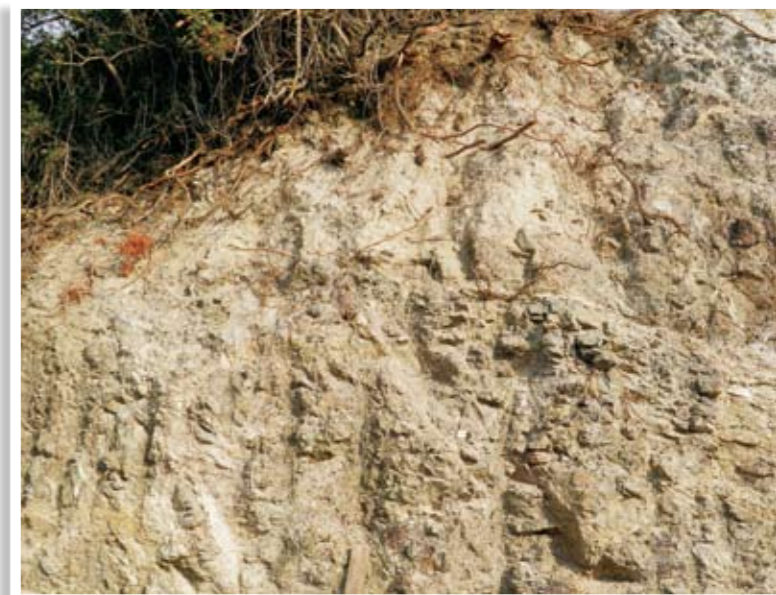
Ο χώρος του τάφου πριν την ανασκαφή

ενώ γεωγραφικά βρίσκεται ενδιάμεσα στα μεγάλα μεταλλεία χαλκού της Σκουριώτισσας και της Λίμνης. Μια πιο επιστημονική μελέτη του κεραμικού υλικού του τάφου μετά τον καθαρισμό και την αποκατάστασή του θα δείξει ακριβέστερα από πού προέρχονται τα αγγεία, αν είχαμε επιτόπια παραγωγή ή αν προέρχονται από άλλα κέντρα παραγωγής εντός και εκτός Κύπρου. Αναμφίβολα μια πιο εκτεταμένη και εμπεριστατωμένη αρχαιολογική – ανασκαφική έρευνα στην περιοχή θα δώσει πολύ περισσότερα ευρήματα, πράγμα το οποίο αναμφίβολα θα βοηθήσει στην εξαγωγή πιο σταθερών συμπερασμάτων. Πέραν της προϊστορικής νεκρόπολης πρέπει να αναζητηθεί και ο χώρος κατοίκησης των ανθρώπων με τα εξίσου ενδιαφέροντα στοιχεία, που διαφυλάσσει.