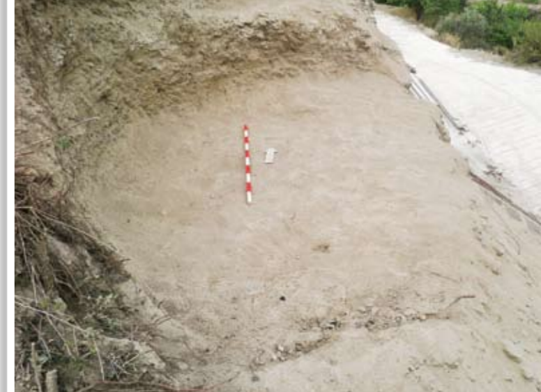
Ο ταφικός θάλαμος μετά την ανασκαφή