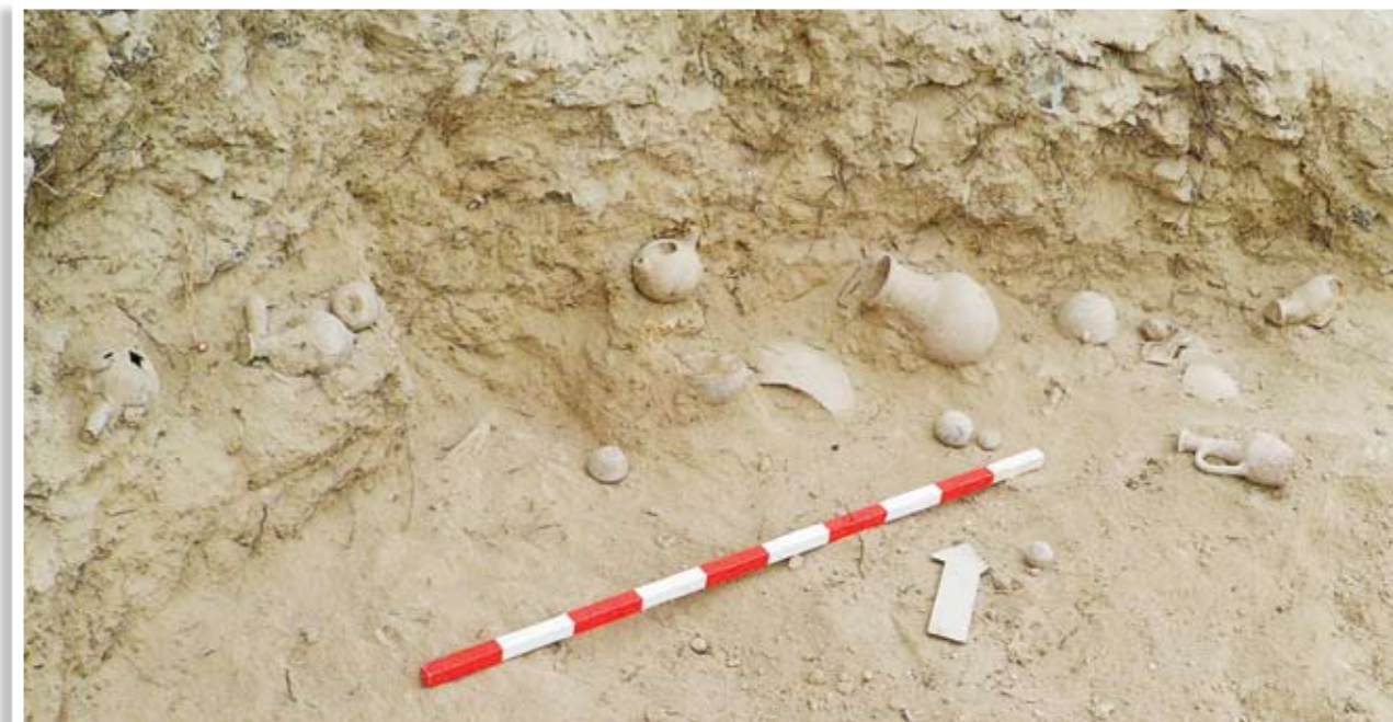
Ευρήματα κατά τη διάρκεια της ανασκαφής του τάφου

ανατολικό τμήμα, καταστράφηκε από τον εκσκαφέα. Τα απομακρυνθέντα χώματα μεταφέρθηκαν στην παραθαλάσσια τοποθεσία «Λίμνη», όπου το Κοινοτικό Συμβούλιο Κάτω Πύργου διαμορφώνει πάρκο. Από έρευνα, που διενεργήθηκε, περισυνελέγησαν μέσα από τα ριγμένα χώματα ποσότητα κεραμικών οστράκων, ανθρώπινων οστών, δυο μονολιθικοί τριπτήρες και μεγάλη ασβεστολιθική πλάκα, που μάλλον έφρασε την είσοδο ενός από τους τάφους,