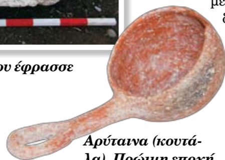
Αρύταινα (κουτάλα). Πρώιμη εποχή του Χαλκού γύρω στο 1900 π.Χ.

αρκετά αντικείμενα, υποβοηθητικά για τη χρονολογική ένταξη. Μετά την ανασκαφή καταλογογραφήθηκαν 37 αντικείμενα ακέραια ή σχεδόν ακέραια, ενώ περισυλλέχθηκε μεγάλος αριθμός κεραμικών οστράκων διαφόρων τύπων αγγείων. Μετά τον καθαρισμό και τη συγκόλλησή τους αναμφίβολα θα αυξηθούν κατά πολύ τον αριθμό των αντικειμένων του τάφου. Τα αντικείμενα, που συνοδεύουν τους νεκρούς, τα κτερίσματα, αντανακλούν τα ταφικά έθιμα της εποχής, την κοινωνική θέση και την οικονομική κατάσταση των κατόχων τους, αφενός των νεκρών και αφετέρου αυτών, που τα προσέφεραν. Επιπλέον μπορούν να εξαχθούν συμπεράσματα για την περίοδο χρήσης του τάφου, για την ευρύτερη κοινωνία και οικονομία της περιοχής, καθώς και για τις τυχόν εμπορικές επαφές. Όπως προαναφέρθηκε, από τον τάφο περισυλλεγήθηκε σωρεία ανθρωπίνων οστών, γεγονός που παραπέμπει σε τάφο πολλαπλής χρήσης. Μετά από πιο εξειδικευμένες έρευνες των οστών, που θα ακολουθήσουν, θα εξαχθούν στοιχεία για το φύλο των νεκρών, την ηλικία τους, πιθανές ασθένειες, που έπασχαν, καθώς και για διατροφικές συνήθειες.