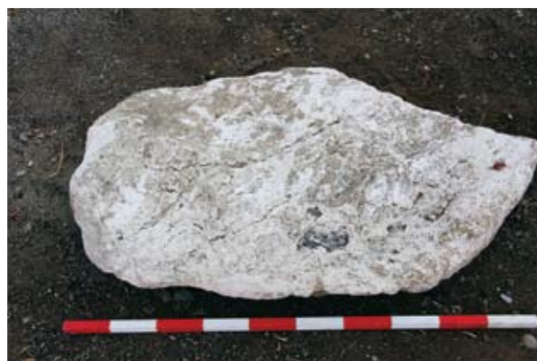
Η ασβεστολιθική πλάκα που έφρασε την είσοδο του τάφου

αρκετά αντικείμενα, υποβοηθητικά για τη χρονολογική ένταξη. Μετά την ανασκαφή καταλογογραφήθηκαν 37 αντικείμενα ακέραια ή σχεδόν ακέραια, ενώ περισυλλέχθηκε μεγάλος αριθμός κεραμικών οστράκων διαφόρων τύπων αγγείων. Μετά τον καθαρισμό και τη συγκόλλησή τους αναμφίβολα θα αυξηθούν κατά πολύ τον αριθμό των αντικειμένων του τάφου. Τα αντικείμενα, που συνοδεύουν τους νεκρούς, τα κτερίσματα, αντανακλούν τα ταφικά έθιμα της εποχής, την κοινωνική θέση και την οικονομική κατάσταση των κατόχων τους, αφενός των νεκρών και αφετέρου αυτών, που τα προσέφεραν. Επιπλέον μπορούν να εξαχθούν συμπεράσματα για την περίοδο χρήσης του τάφου, για την ευρύτερη κοινωνία και οικονομία της περιοχής, καθώς και για τις τυχόν εμπορικές επαφές. Όπως προαναφέρθηκε, από τον τάφο περισυλλεγήθηκε σωρεία ανθρωπίνων οστών, γεγονός που παραπέμπει σε τάφο πολλαπλής χρήσης. Μετά από πιο εξειδικευμένες έρευνες των οστών, που θα ακολουθήσουν, θα εξαχθούν στοιχεία για το φύλο των νεκρών, την ηλικία τους, πιθανές ασθένειες, που έπασχαν, καθώς και για διατροφικές συνήθειες.