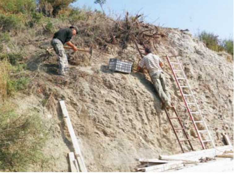
Κατά τη διάρκεια της ανασκαφής